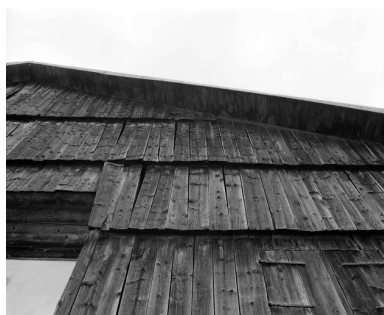
Détail de la lambrechure antérieure : rang de planches.