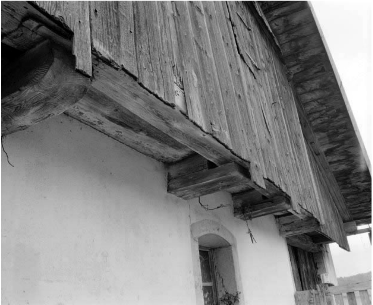
Surplomb de la lambrechure antérieure : rang de planches.