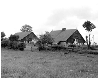
Vue d'ensemble. IVR43_19772500352X