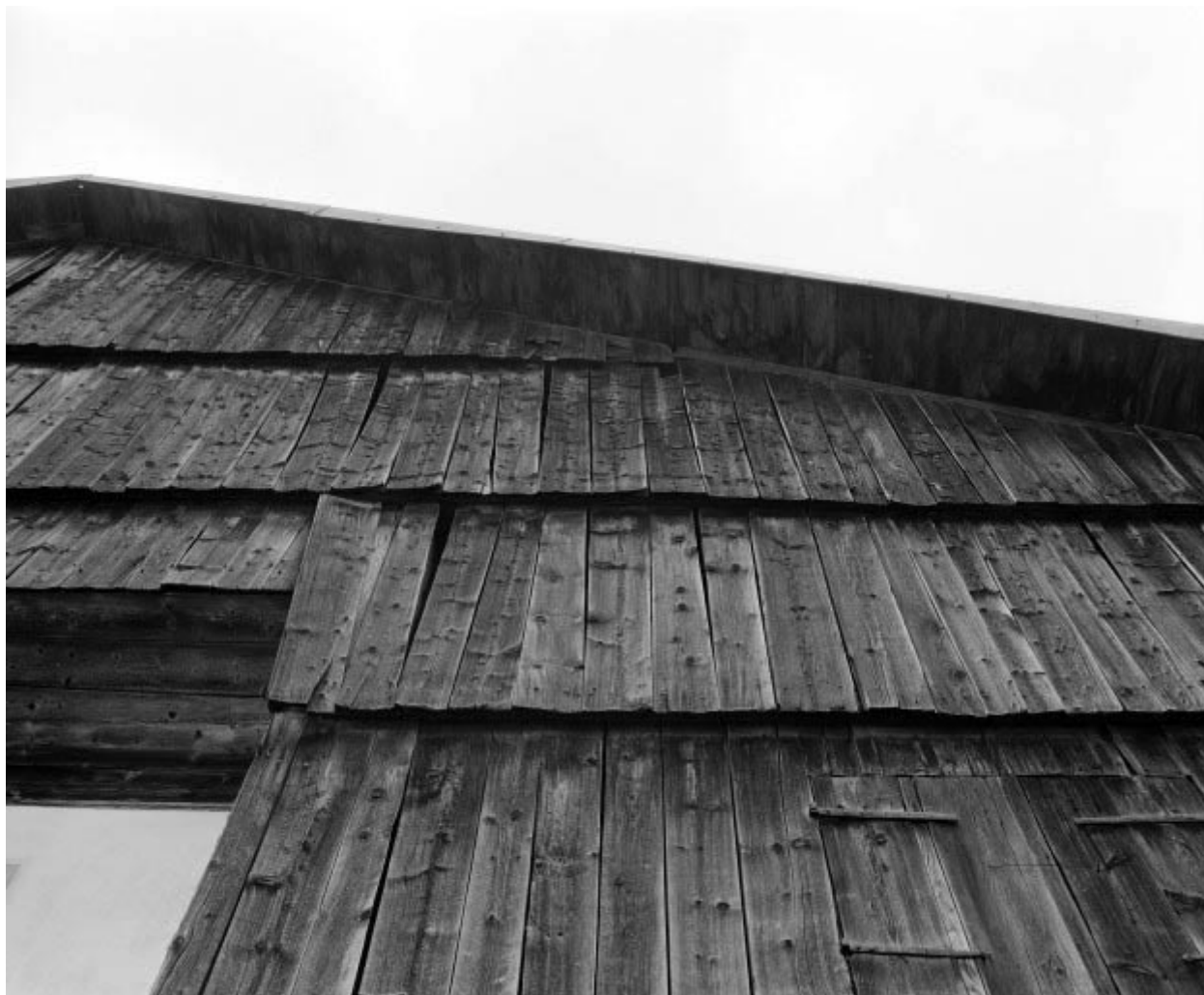
Détail de la lambrechure antérieure : rang de planches.