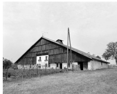
1ère ferme : façade antérieure. IVR43_19762500160X