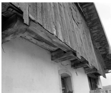
Surplomb de la lambrechure antérieure : rang de planches. IVR43_19772500355X