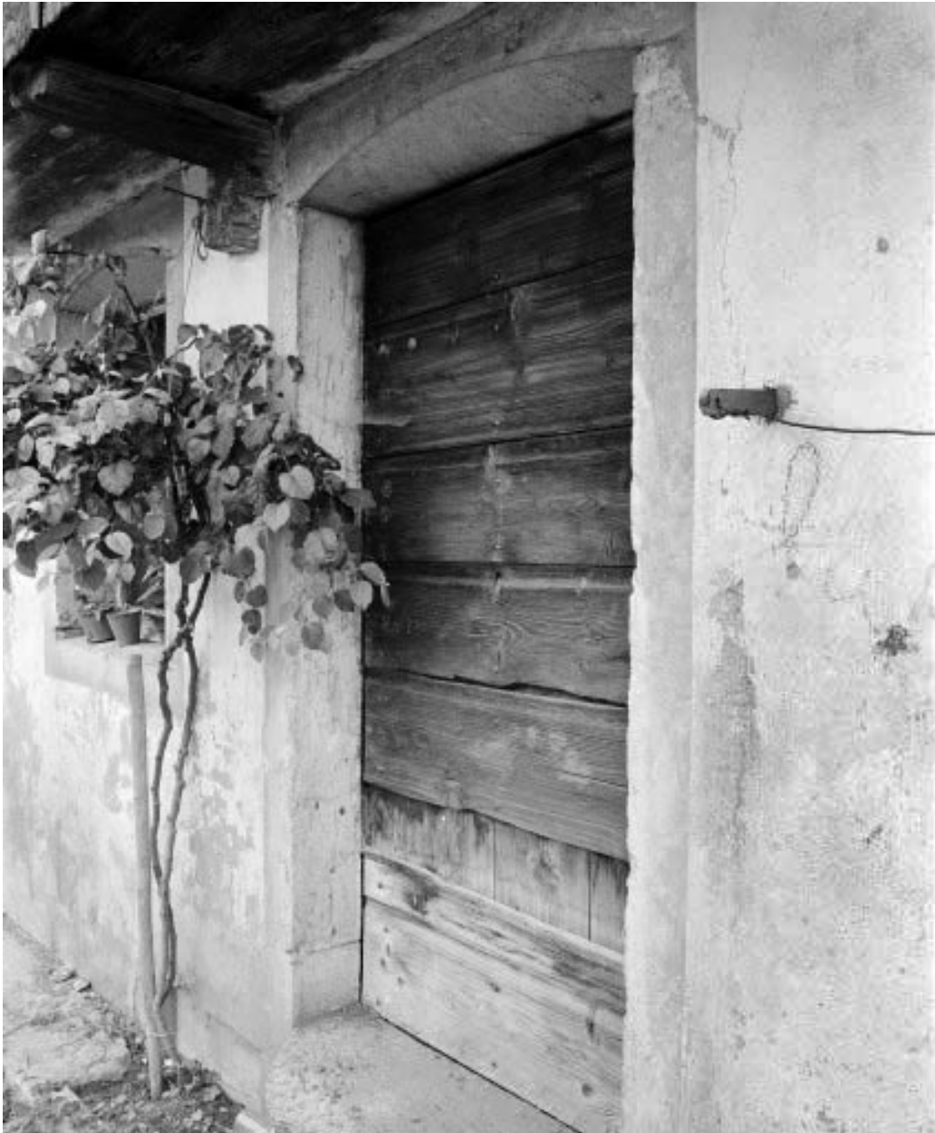
Détail de la porte d'entrée sur la facade antérieure.