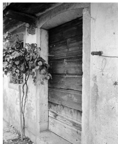
Détail de la porte d'entrée sur la façade antérieure. IVR43_19772500354X