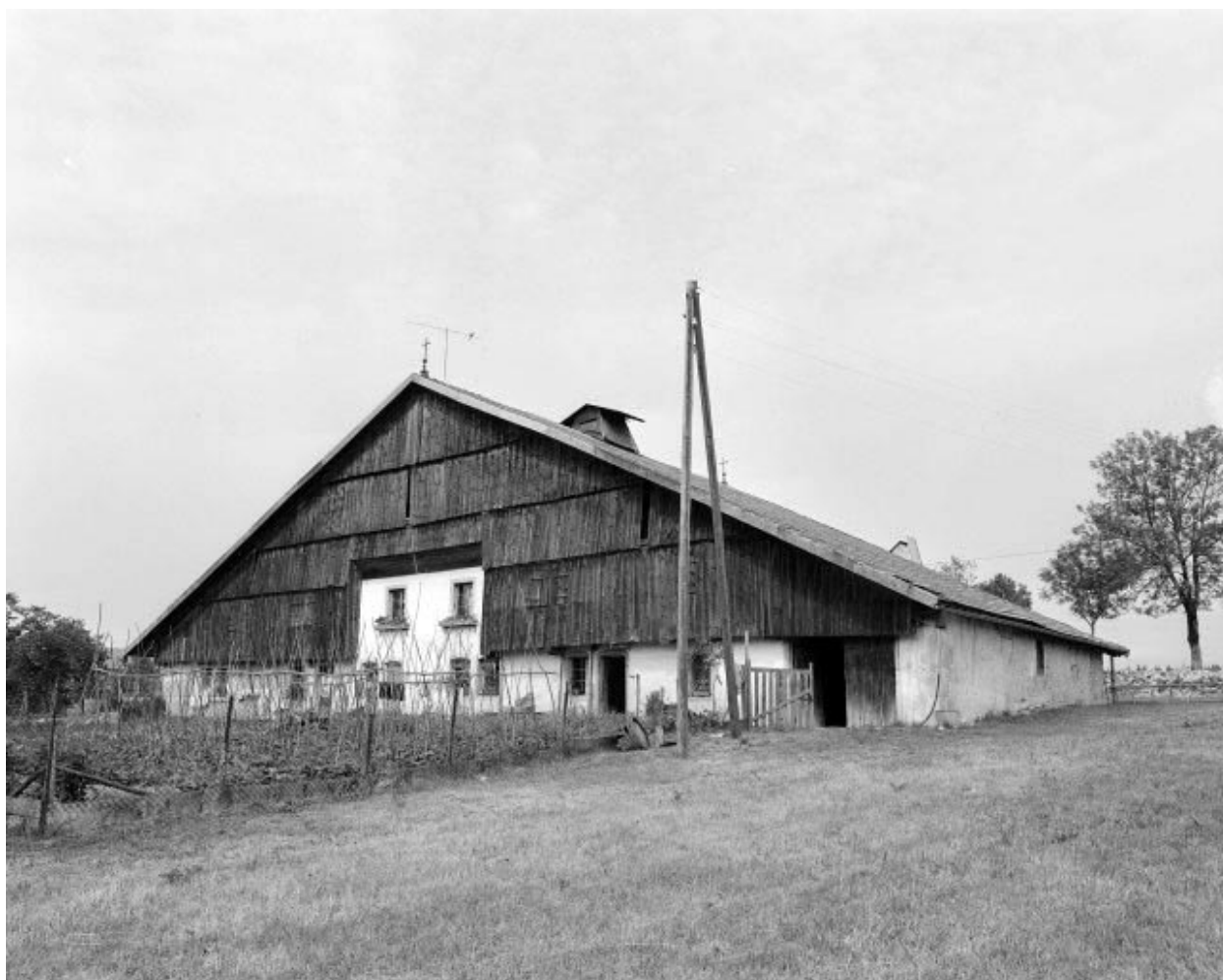
1ère ferme : façade antérieure.