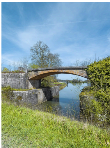
Vue d'ensemble. En arrière-plan le pont ferroviaire (IA21005578). IVR26_20162101415NUC4A