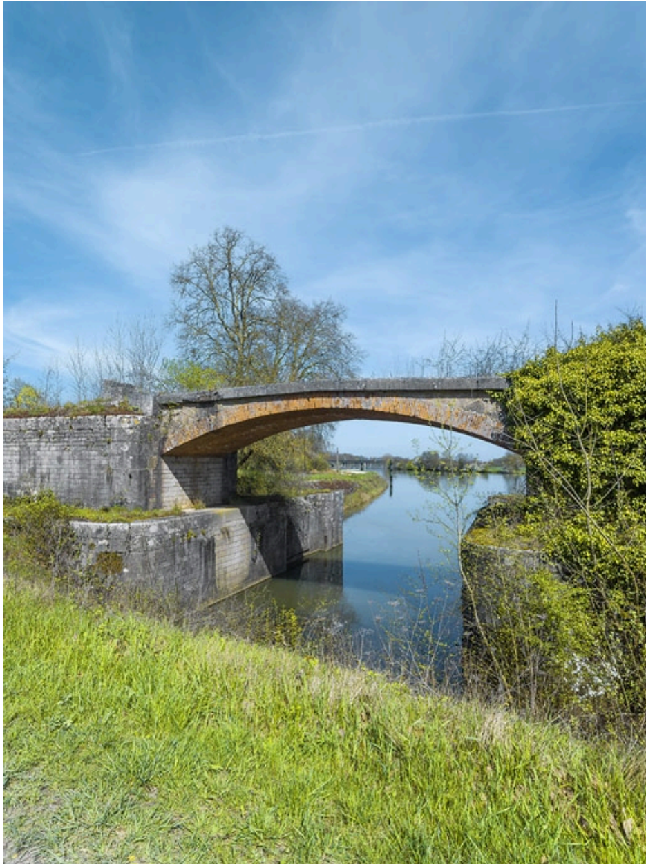
Vue d'ensemble. En arrière-plan le pont ferroviaire (IA21005578).