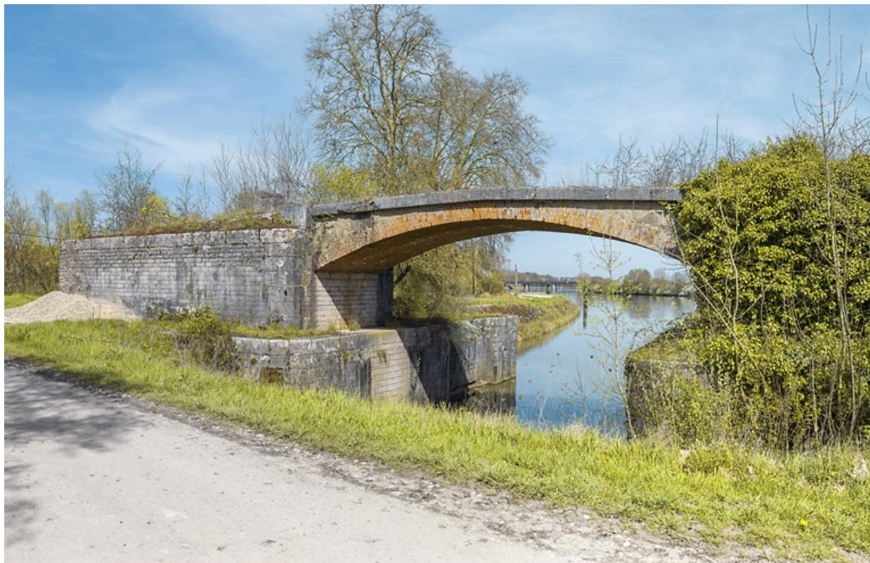
Vue d'ensemble. En arrière-plan le pont ferroviaire (IA21005578).