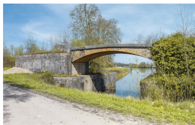
Vue d'ensemble. En arrière-plan le pont ferroviaire (IA21005578). IVR26_20162101419NUC4A