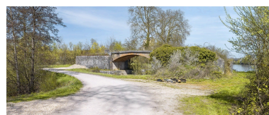
Vue d'ensemble. IVR26_20162101416NUC4A