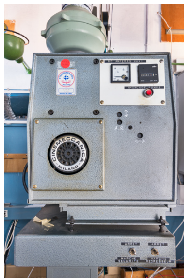
Face arrière de la lanterne. IVR26_20257100742NUC4A