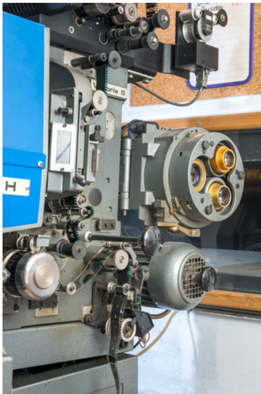
Chrono et tourelle porte-objectifs, de trois quarts.