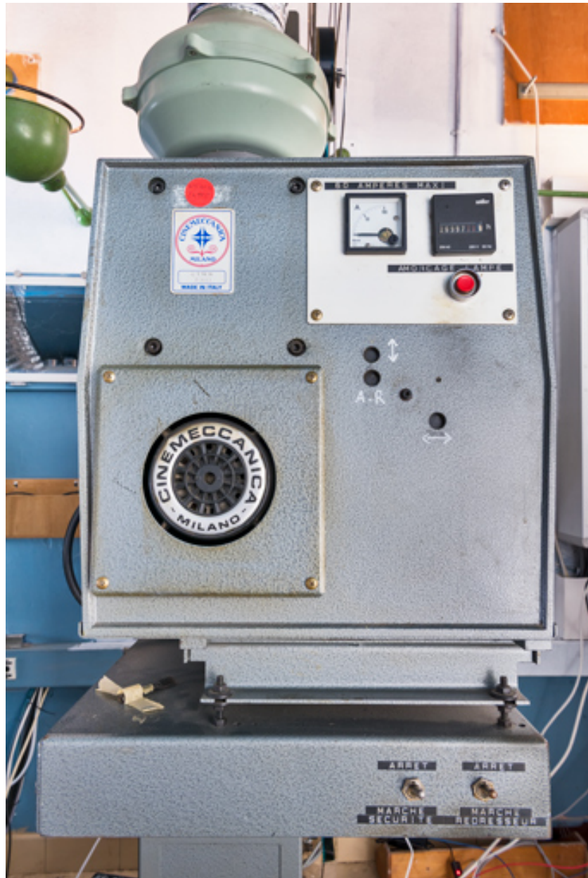
Face arrière de la lanterne.