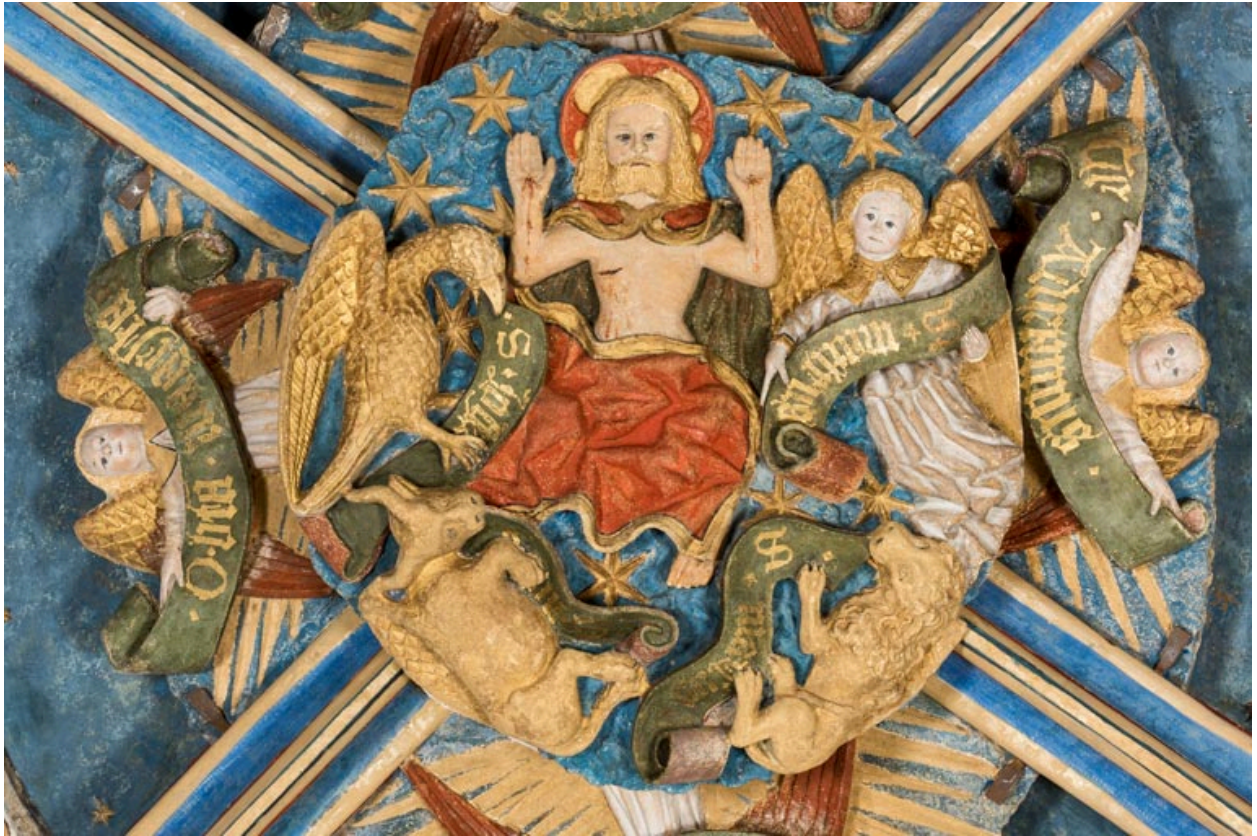
Clef de voûte de la travée orientale, détail.