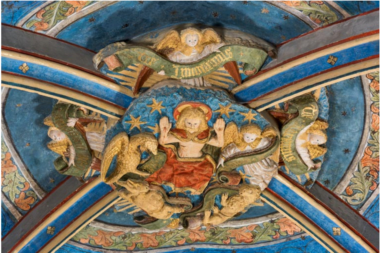
Clef de voûte de la travée orientale.