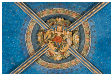
Clef de voûte de la travée orientale.