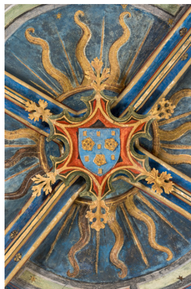
Clef de voûte de la travée occidentale. IVR26_20237100170NUC4A