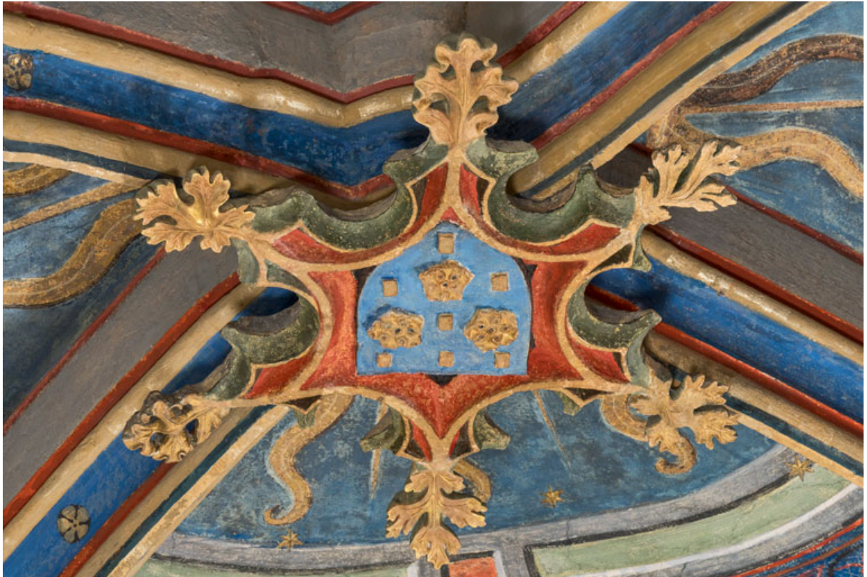
Clef de voûte de la travée occidentale.