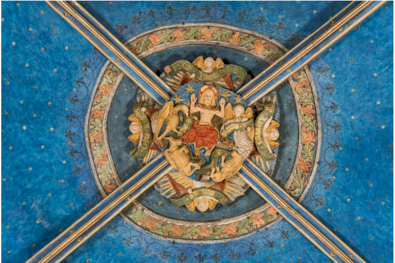
Clef de voûte de la travée orientale.