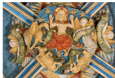
Clef de voûte de la travée orientale, détail. IVR26_20237100167NUC4A