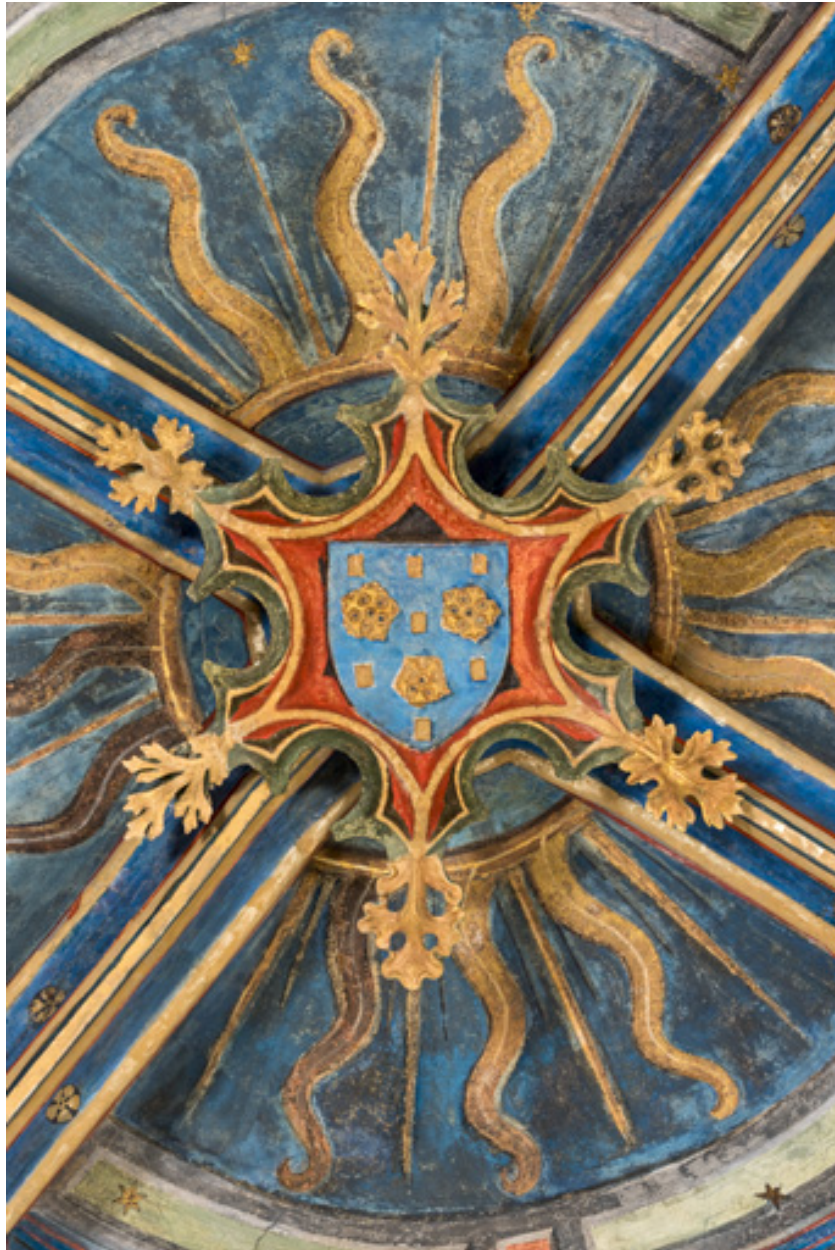
Clef de voûte de la travée occidentale.