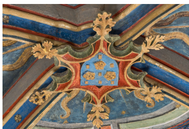
Clef de voûte de la travée occidentale.