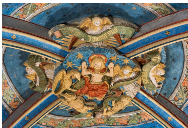
Clef de voûte de la travée orientale.