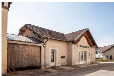
Nouvelle fromagerie vue de trois quarts gauche. IVR43_20162500233NUC4A