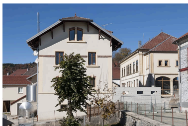
Vue depuis le sud-est. IVR43_20152502408NUC4A