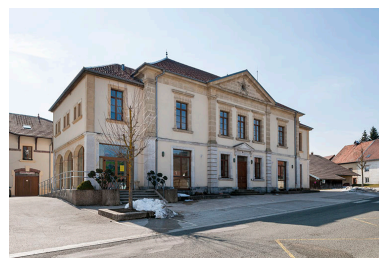
Mairie-fromagerie vue de trois quarts gauche.