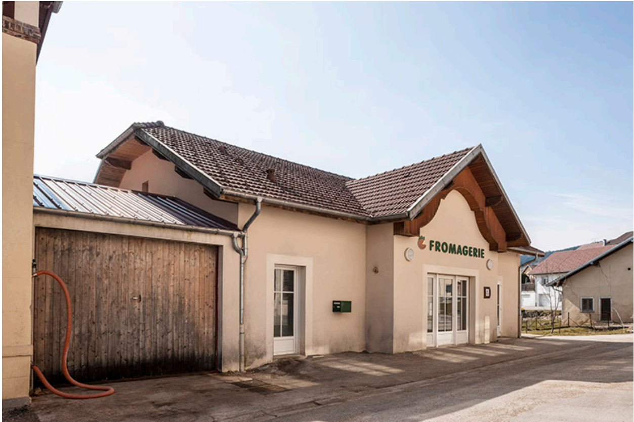
Nouvelle fromagerie vue de trois quarts gauche.