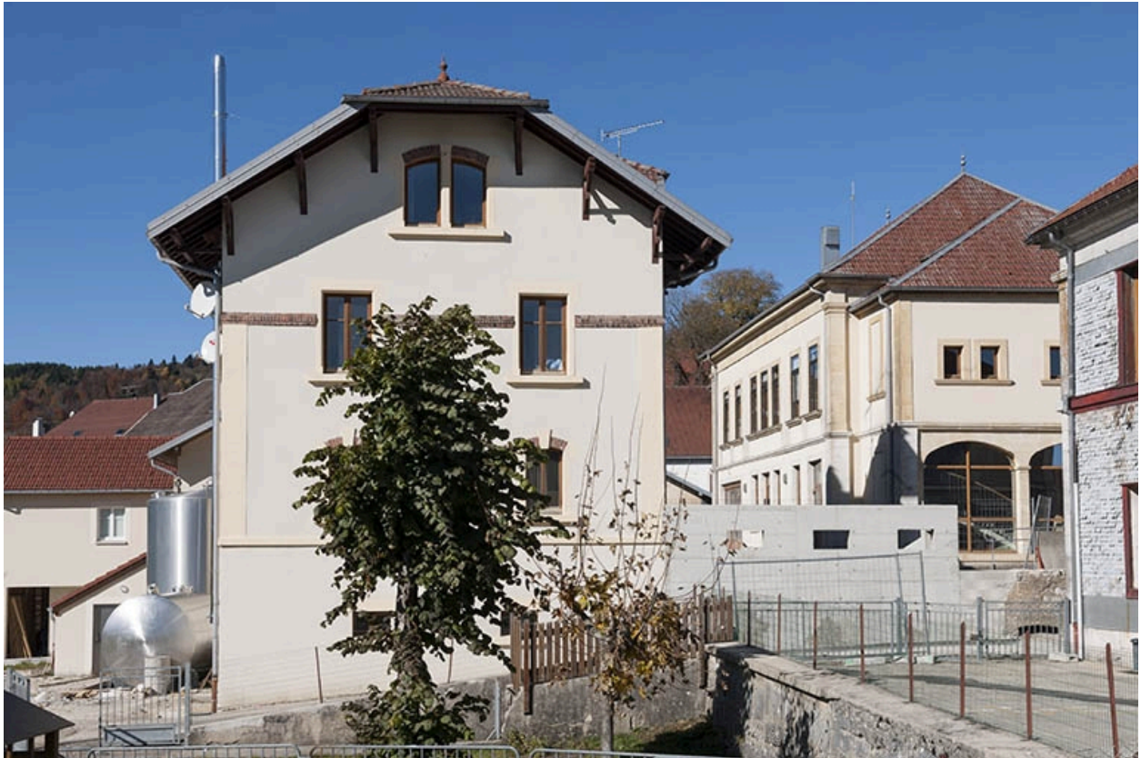
Vue depuis le sud-est.