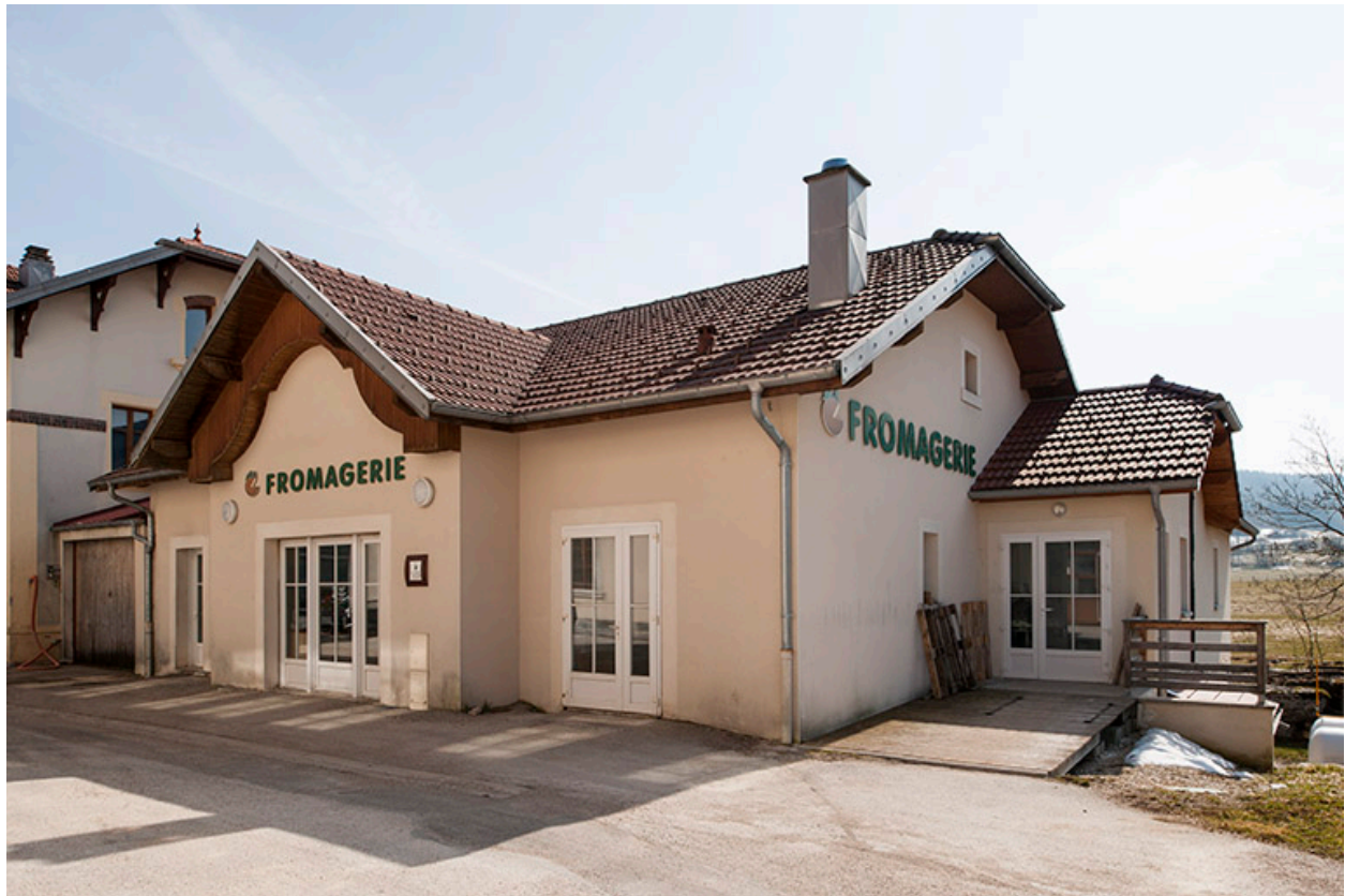
Nouvelle fromagerie vue de trois quarts droite.