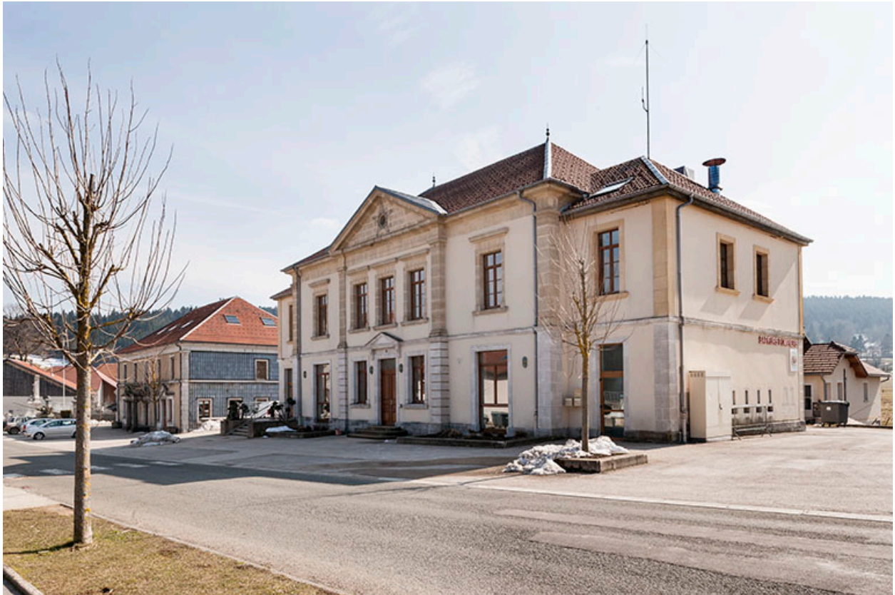
Mairie-fromagerie vue de trois quarts droite.