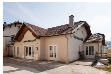
Nouvelle fromagerie vue de trois quarts droite. IVR43_20162500234NUC4A