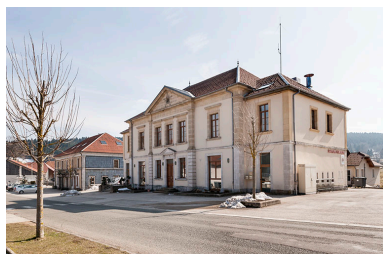
Mairie-fromagerie vue de trois quarts droite. IVR43_20162500236NUC4A