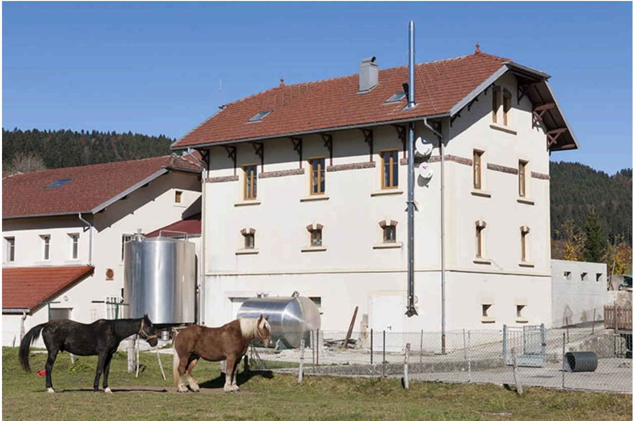
Vue de trois quarts arrière.