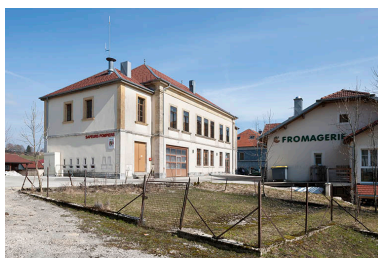
Les fromageries vues depuis l'ouest.