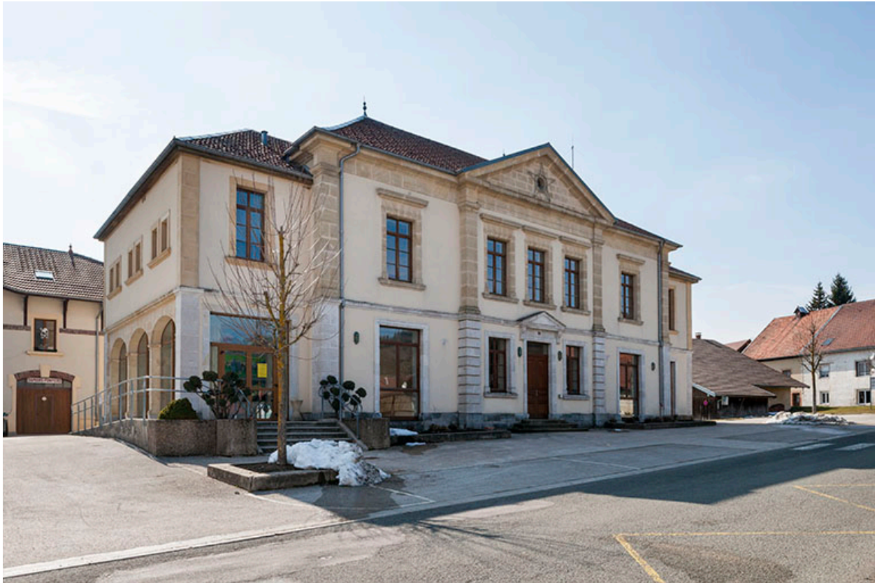
Mairie-fromagerie vue de trois quarts gauche.