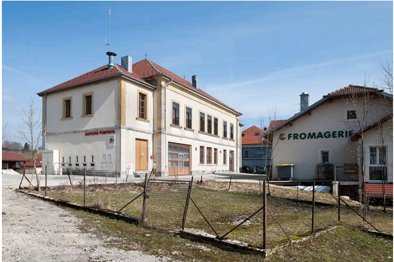
Les fromageries vues depuis l'ouest.