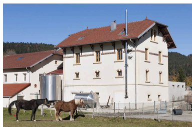
Vue de trois quarts arrière. IVR43_20152502407NUC4A