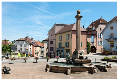
Vue générale de la fontaine et de la place de la mairie. IVR43_20102501097NUC4A