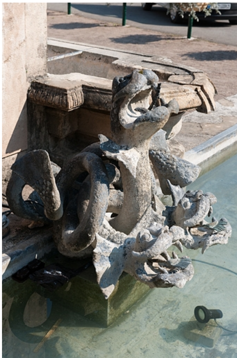
Vue de deux hydres.