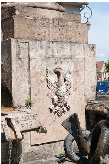
Détail de la borne-fontaine : les armes de la ville.