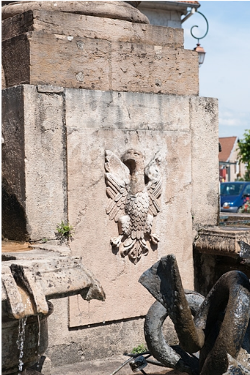
Détail de la borne-fontaine : les armes de la ville.