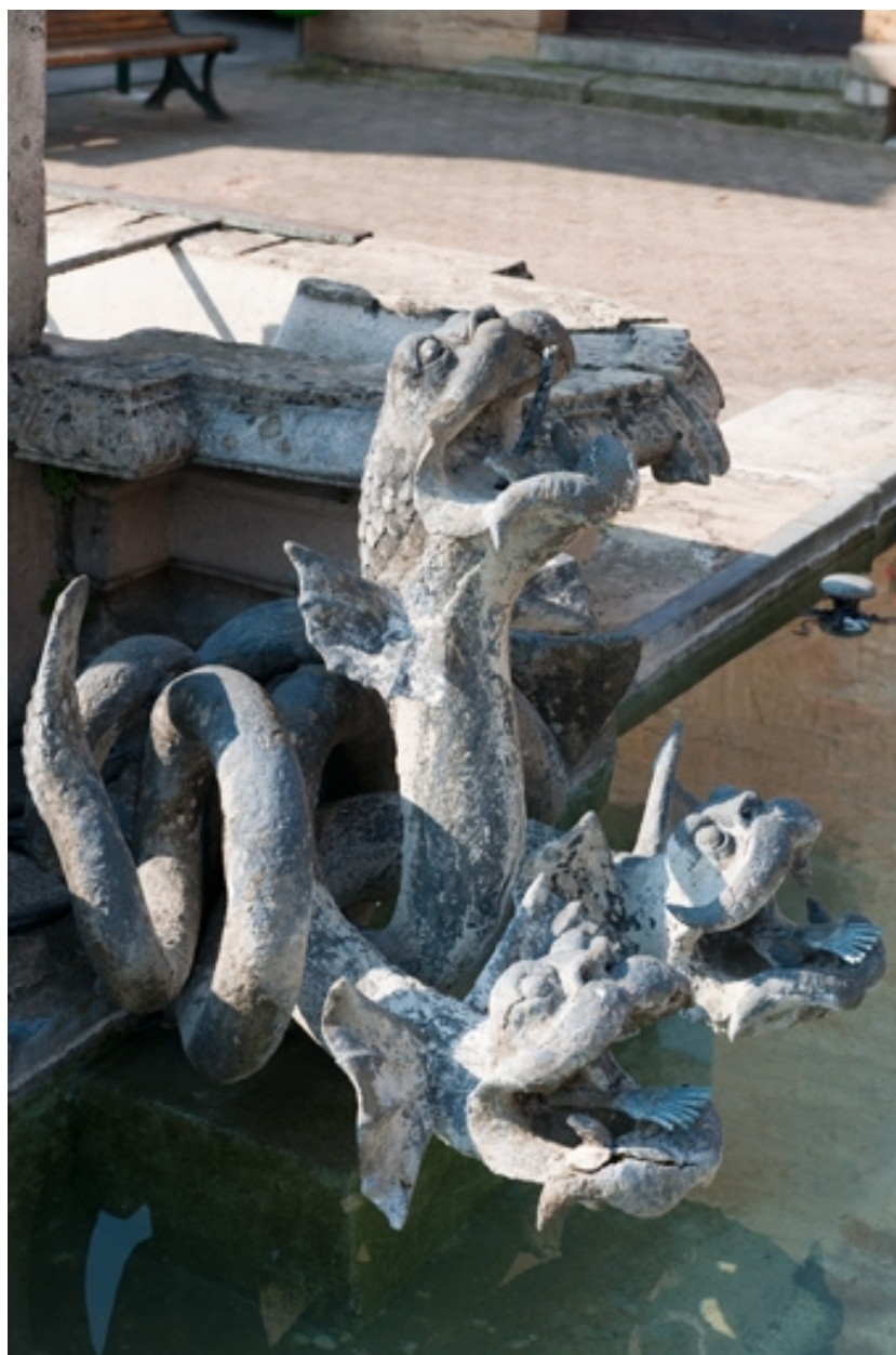
Vue en plongée de deux hydres.