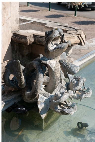
Vue de deux hydres.