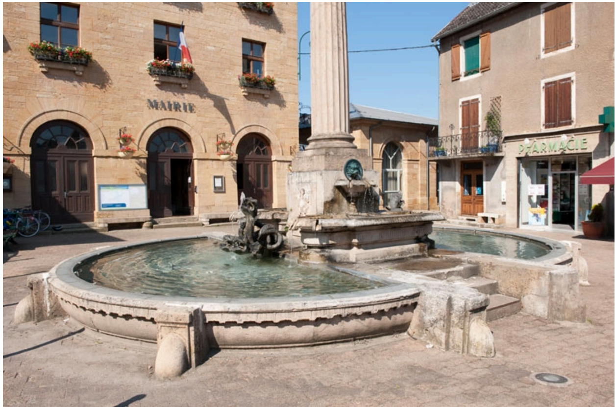
Vue générale des bassins.