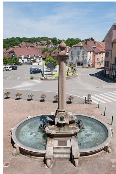
Vue générale plongeante, depuis la mairie. IVR43_20102501096NUC4A