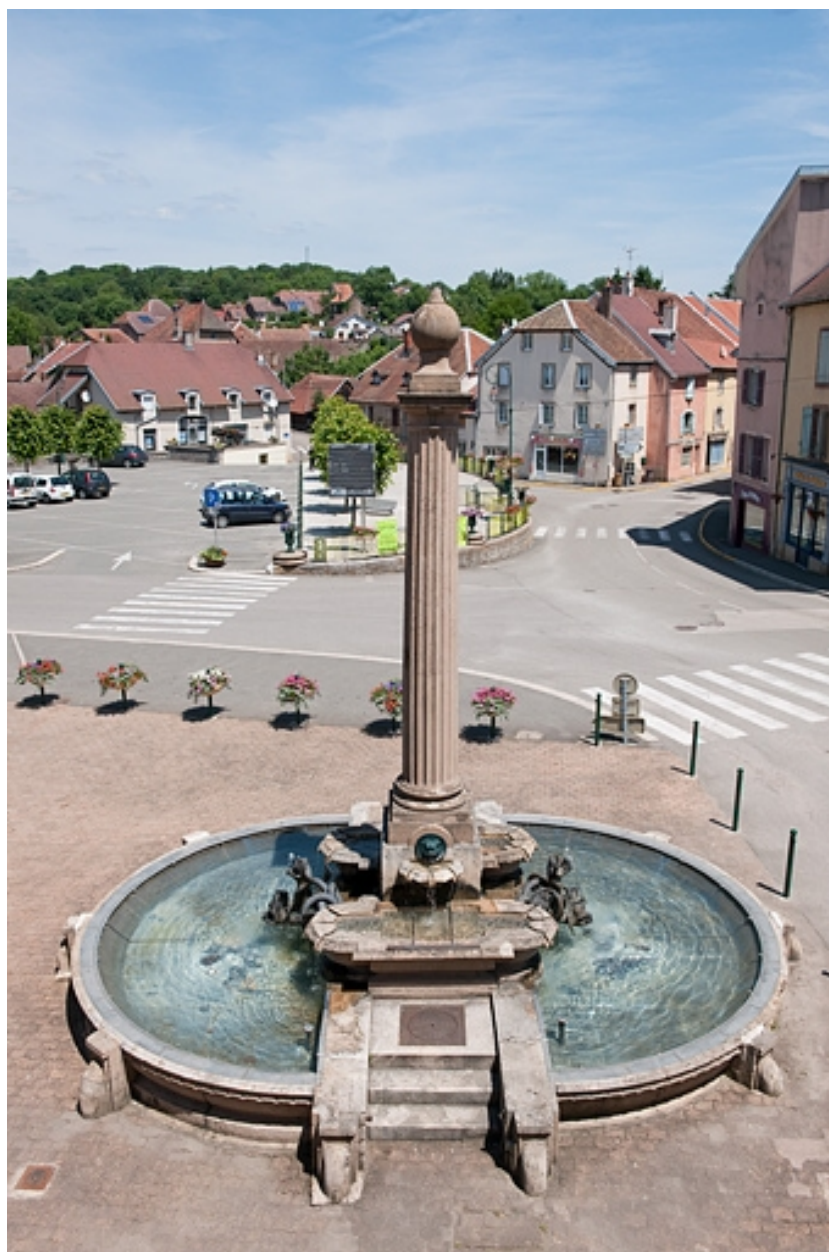
Vue générale plongeante, depuis la mairie.