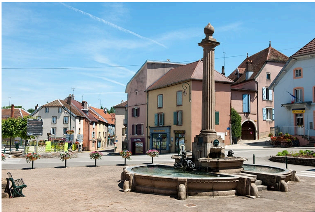
Vue générale de la fontaine et de la place de la mairie.