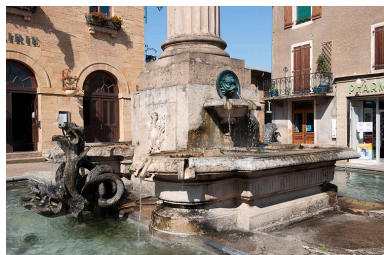
Vue trois quart (rapprochée) des bassins. IVR43_20102501100NUC4A