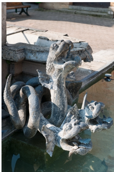
Vue en plongée de deux hydres. IVR43_20102501103NUC4A