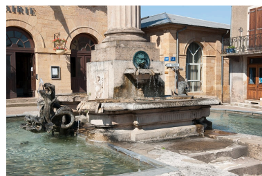
Vue de trois quart des bassins. IVR43_20102501098NUC4A