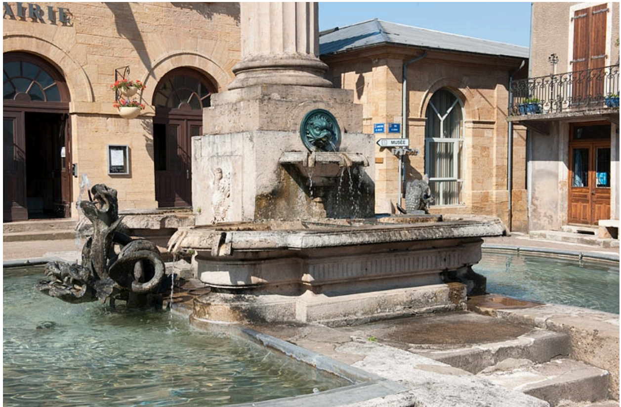
Vue de trois quart des bassins.