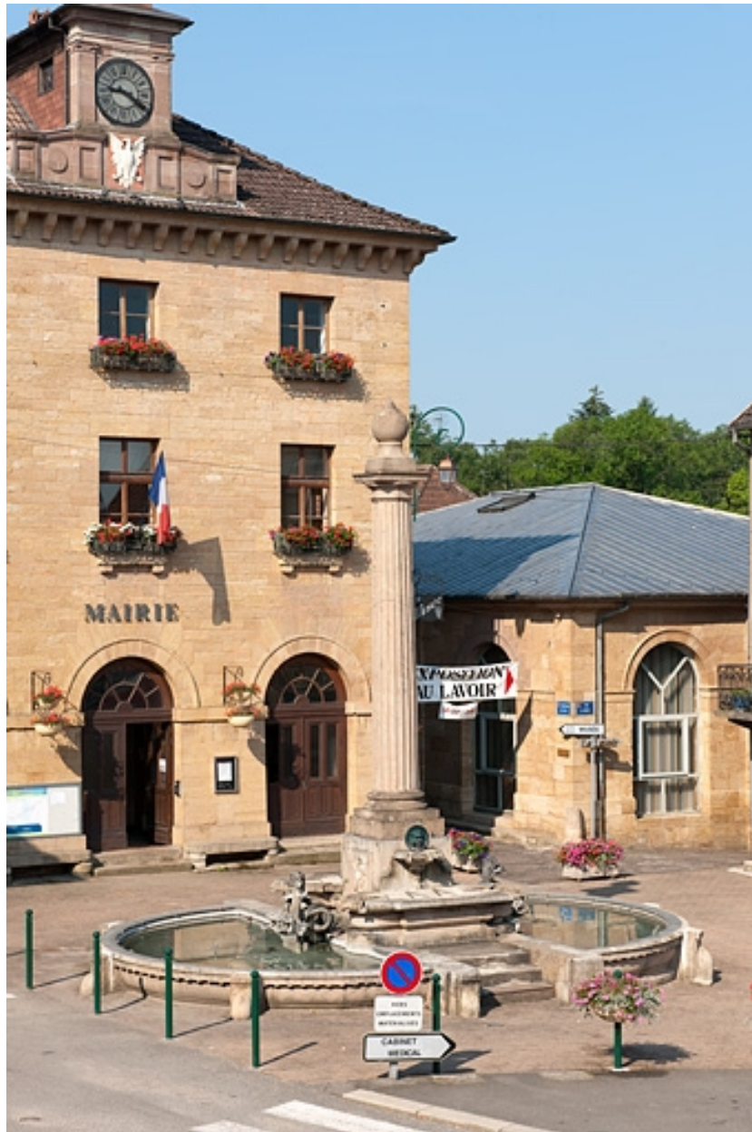
Vue générale, avec au second plan la mairie et la halle.