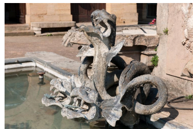
Vue de deux hydres. IVR43_20102501102NUC4A