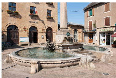
Vue générale des bassins.