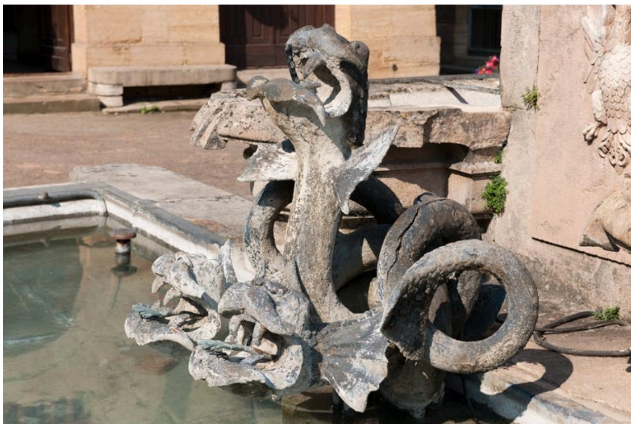
Vue de deux hydres.