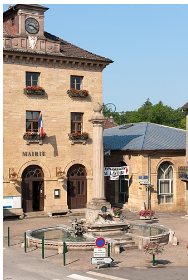
Vue générale, avec au second plan la mairie et la halle. IVR43_20102501101NUC4A