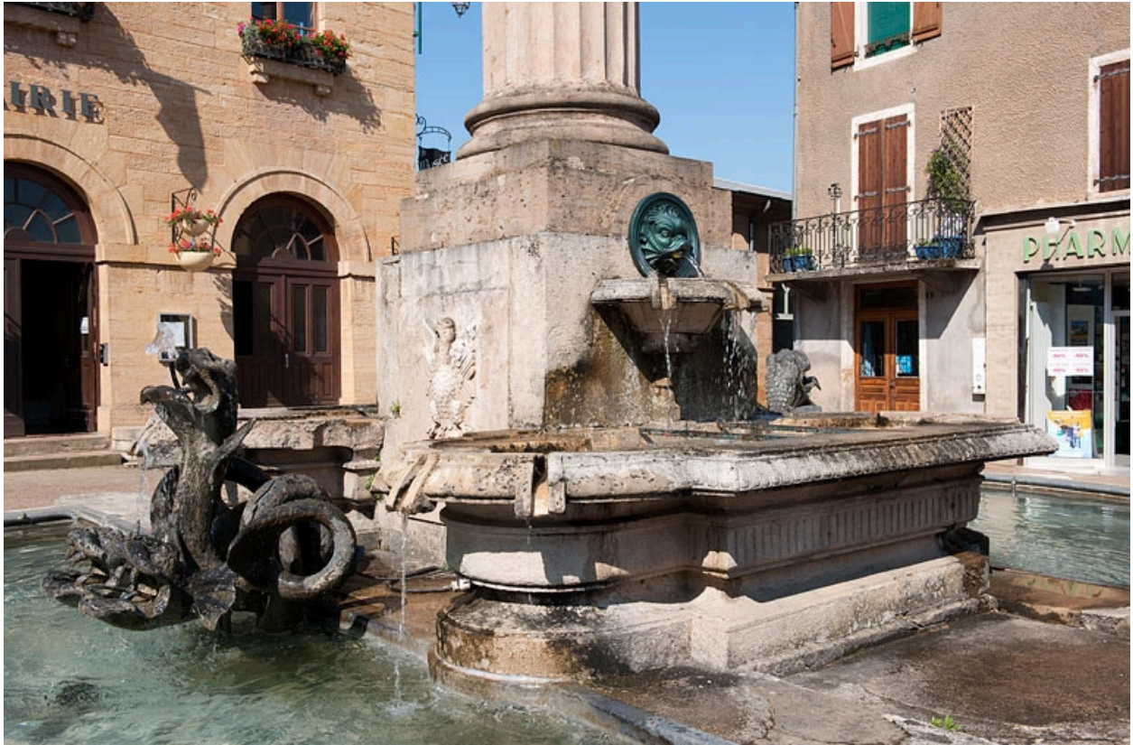
Vue trois quart (rapprochée) des bassins.