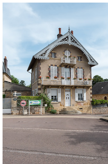
Façade principale sur l'avenue Eugène Collin.