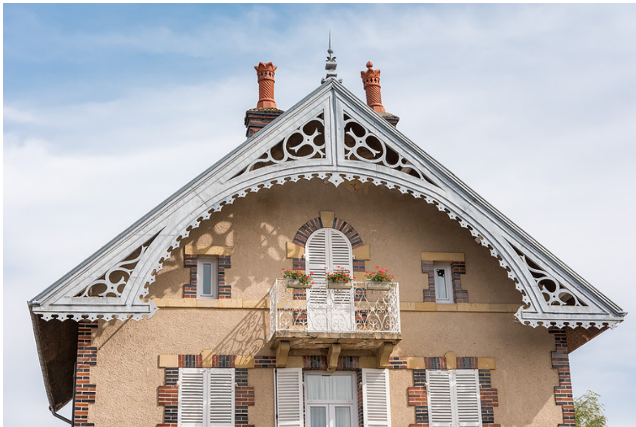
Pignon protégé par une large saillie de rive décorée d'un lambrequin métallique découpé.