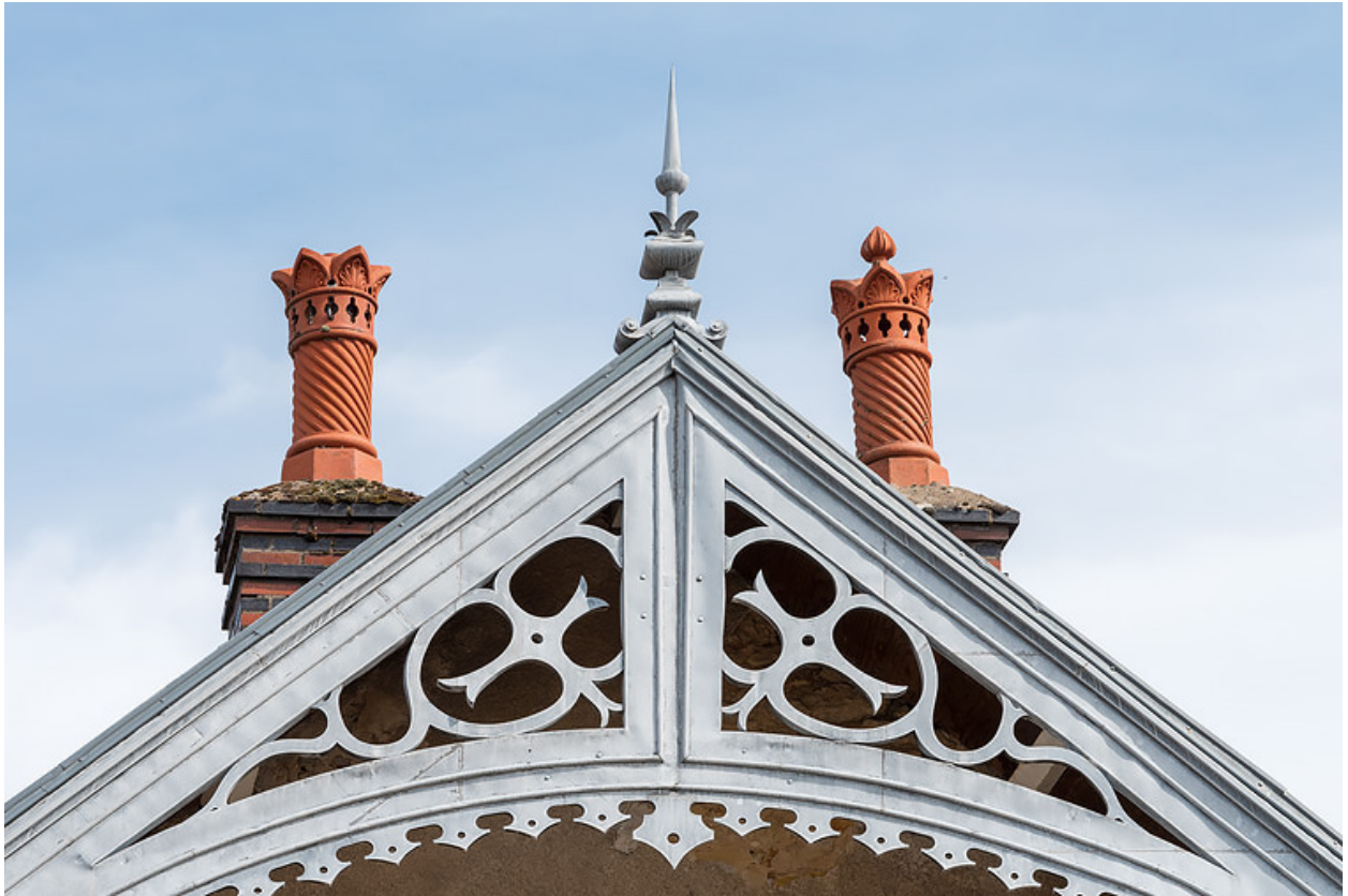
Lambrequin métallique découpé imitant un décor de menuiserie et cheminées ornées.