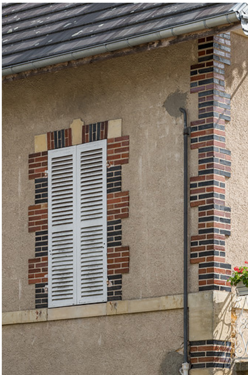
Encadrement de baie et chaîne d'angle harpée en brique vernissée.