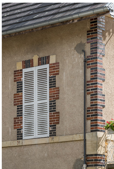
Encadrement de baie et chaîne d'angle harpée en brique vernissée. IVR26_20195800691NUC4A