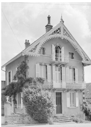
Façade principale sur l'avenue Eugène Collin, vue en 1978. IVR26_19785800225V