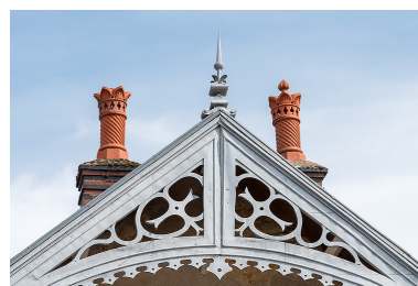
Lambrequin métallique découpé imitant un décor de menuiserie et cheminées ornées. IVR26_20195800693NUC4A