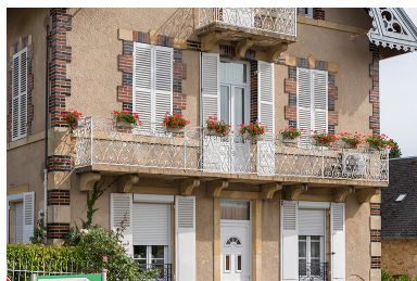
Baies et balcons du premier étage. IVR26_20195800695NUC4A