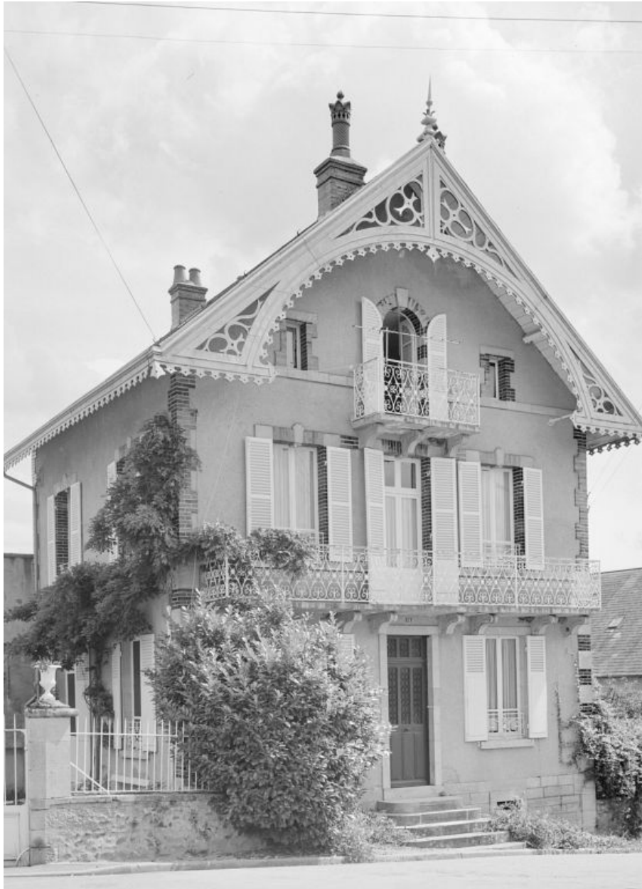
Façade principale sur l'avenue Eugène Collin, vue en 1978.