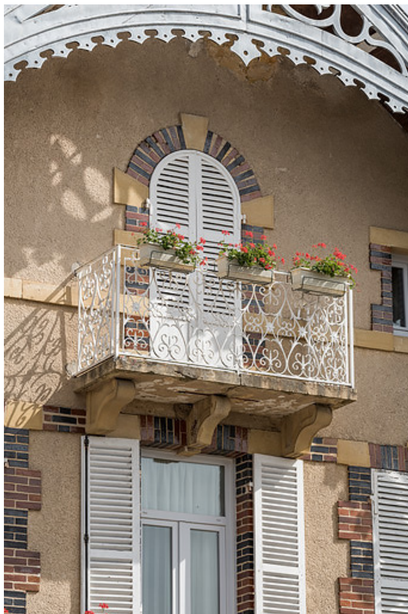
Baie et balcon du second étage.