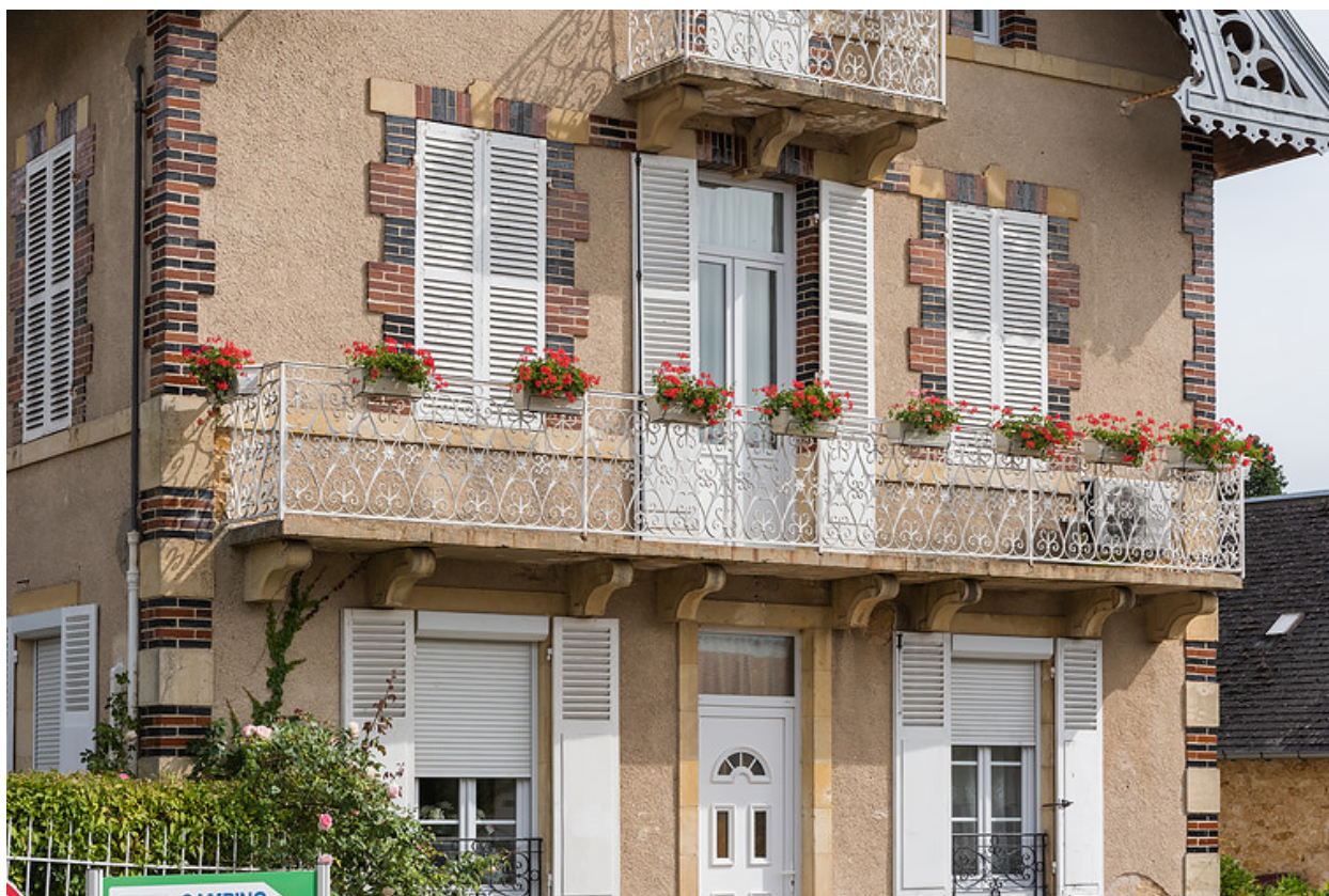
Baies et balcons du premier étage.