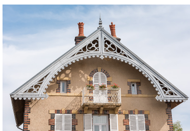
Pignon protégé par une large saillie de rive décorée d'un lambrequin métallique découpé. IVR26_20195800694NUC4A