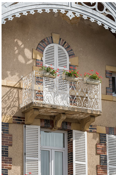
Baie et balcon du second étage.