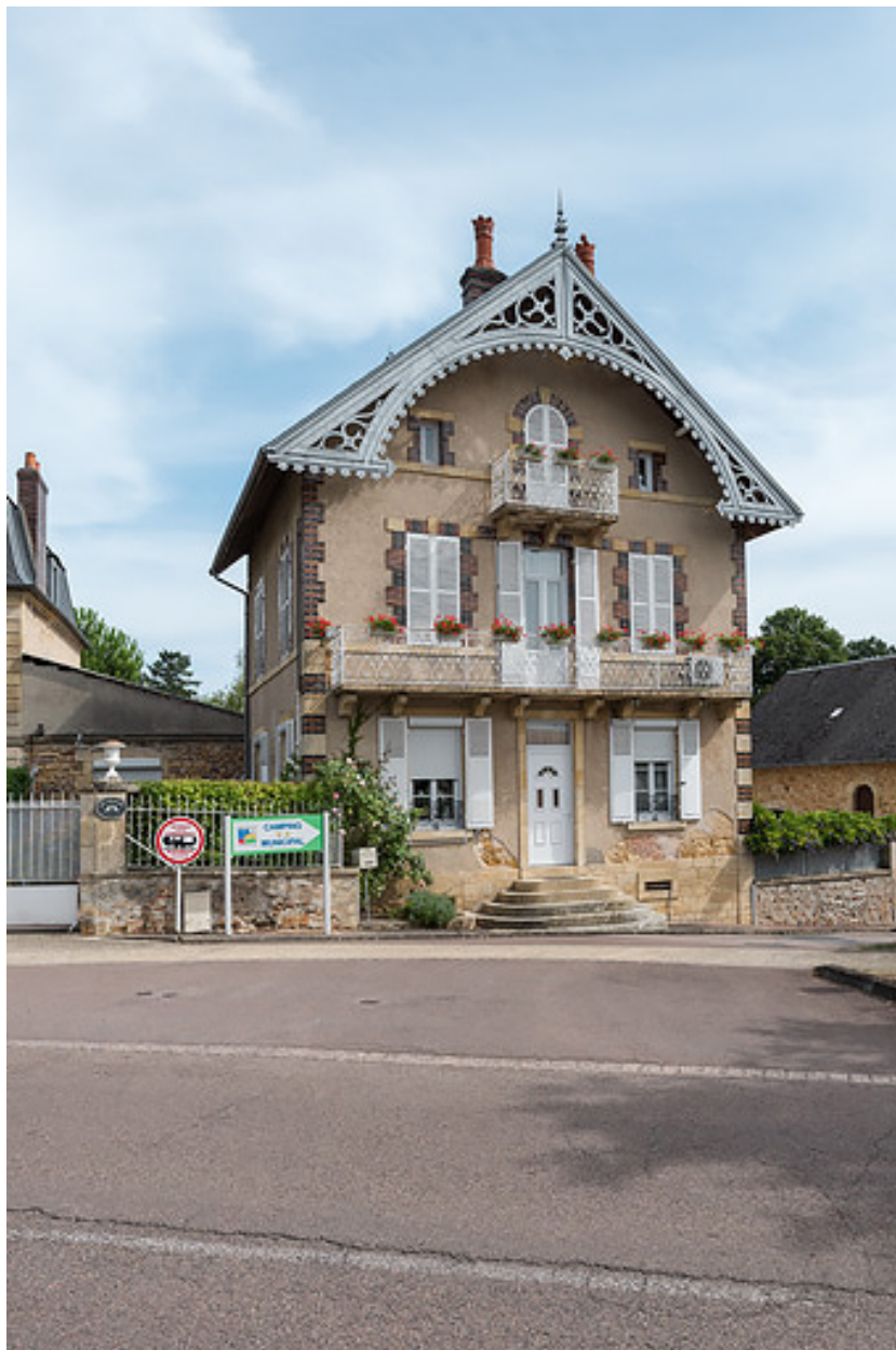
Façade principale sur l'avenue Eugène Collin.