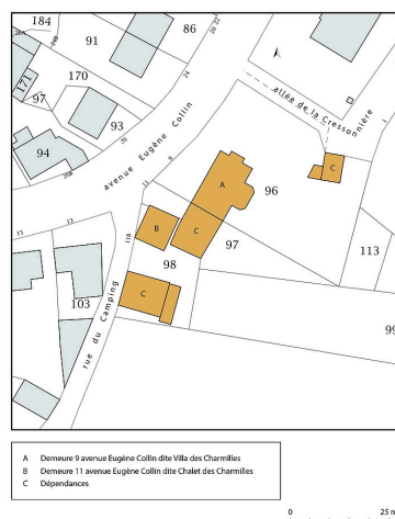
Plan-masse et de situation, extrait du plan cadastral (2020). IVR26_20205800634NUDA