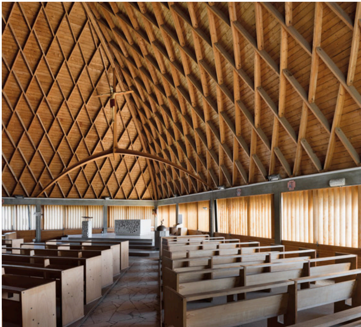
Mobilier du chœur. Vue de trois quarts.