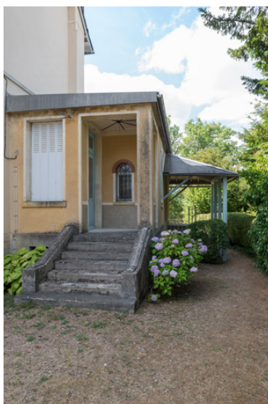
Entrée latérale, côté nord. IVR26_20195800615NUC4A