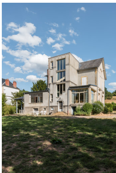
Vue depuis l'ouest. IVR26_20195800626NUC4A