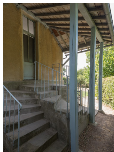
Entrée latérale, côté nord. IVR26_20195800616NUC4AQ