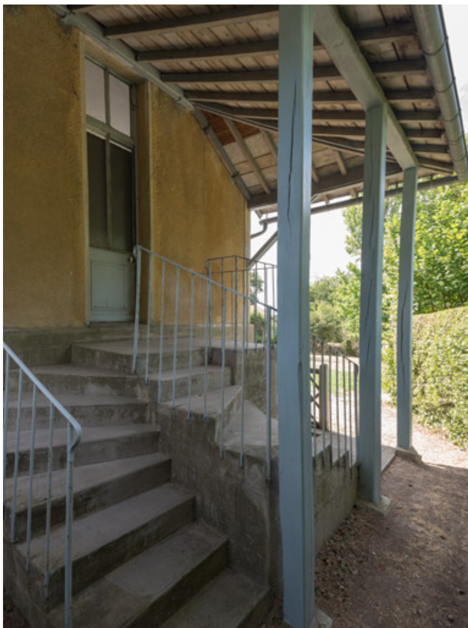
Entrée latérale, côté nord.