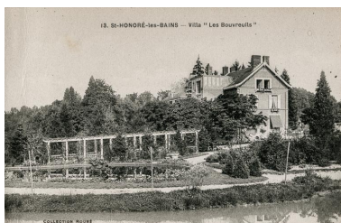
Vue du jardin et de la villa depuis le sud-ouest.