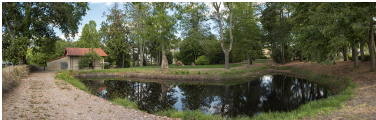
Étang du jardin.