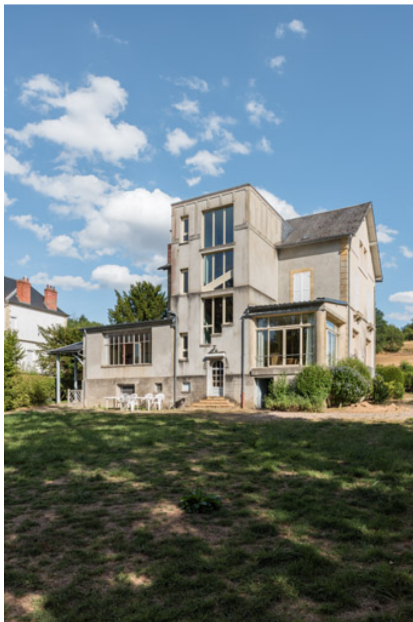
Vue depuis l'ouest.