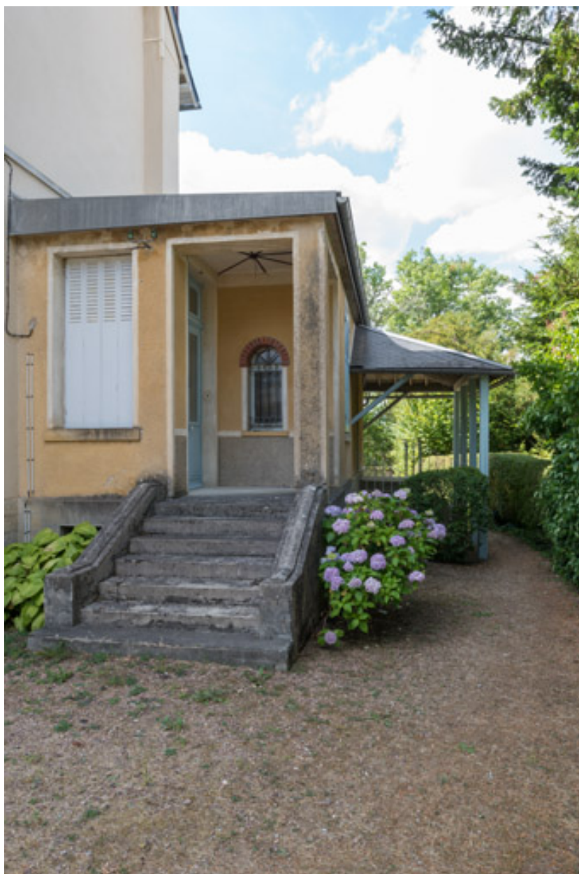
Entrée latérale, côté nord.