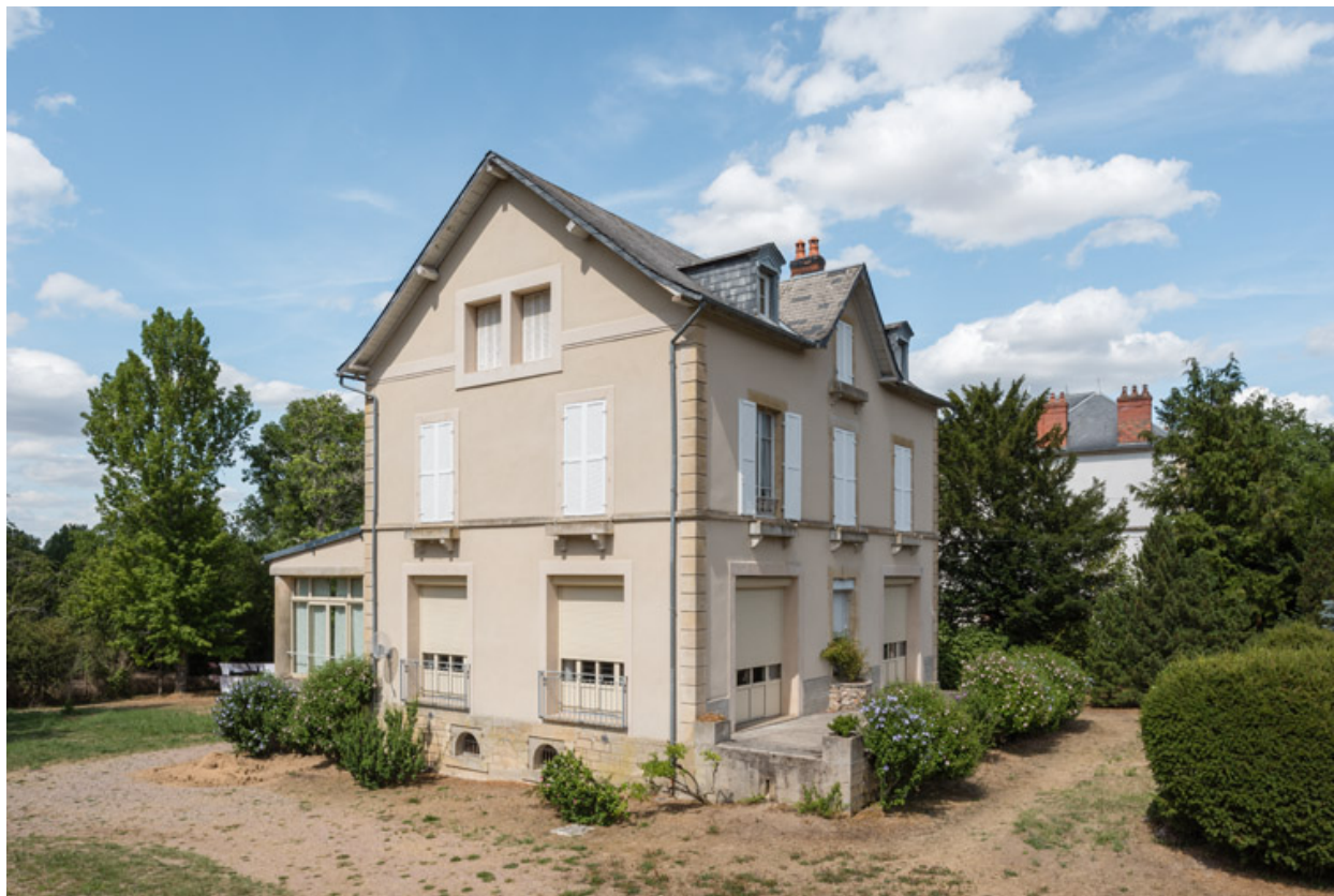
Vue depuis le sud.