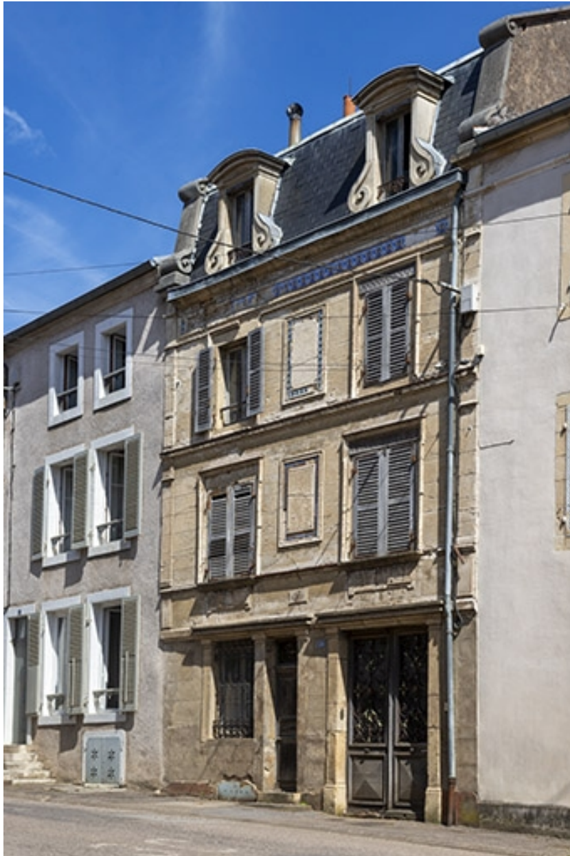
La façade antérieure, de trois quarts droite.