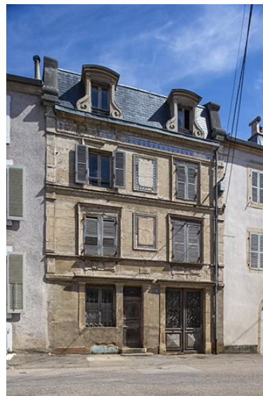
La façade antérieure.