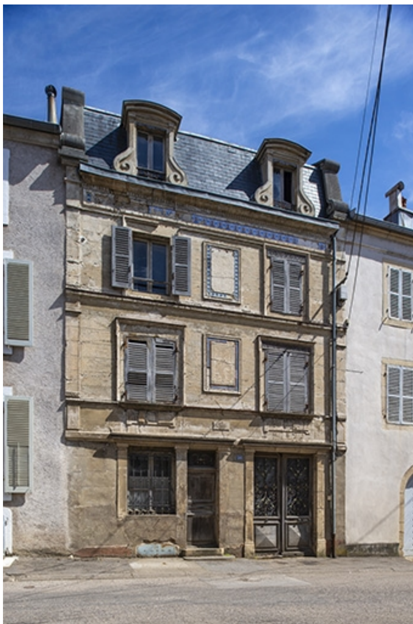
La façade antérieure.