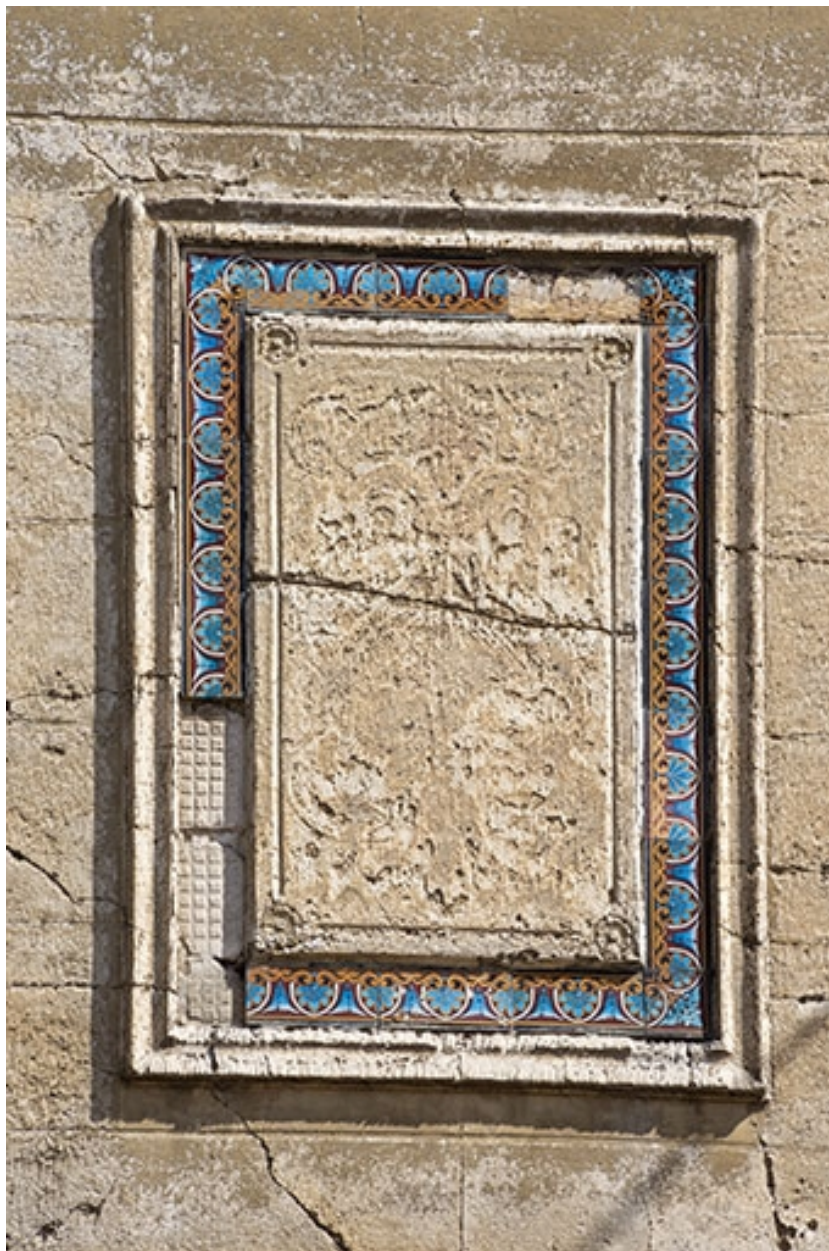
Détail de décor polychrome en céramique sur la façade.