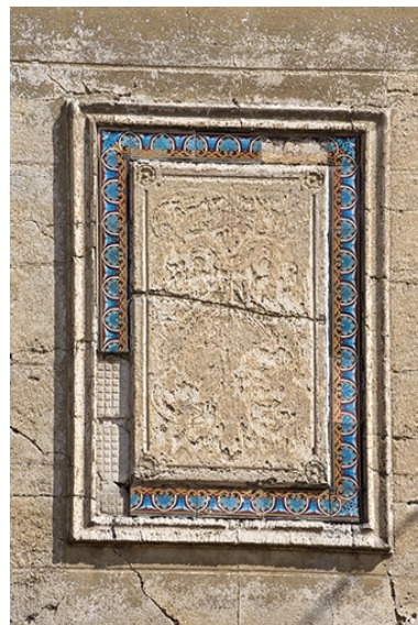
Détail de décor polychrome en céramique sur la façade. IVR43_20217000336NUC4A