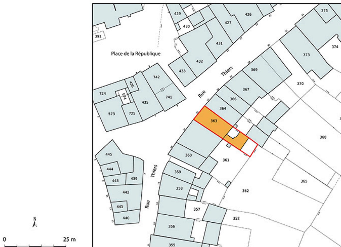
Plan-masse et de situation. Extrait du plan cadastral numérisé de la direction générale des finances publiques, 2025, 1/500.