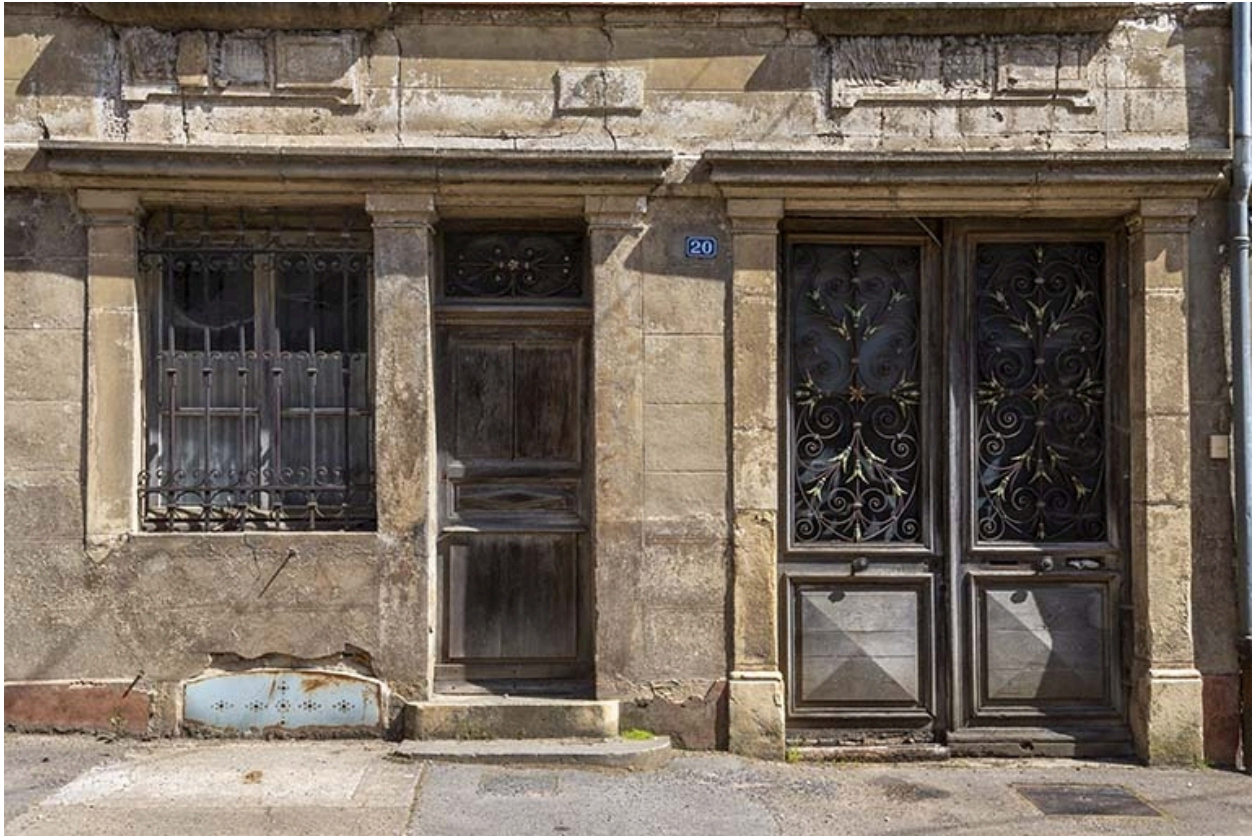
Pilastres, ferronnerie, menuiserie, bas-relief sur la façade.