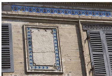
Détail de décor polychrome en céramique sur la façade. IVR43_20217000338NUC4A