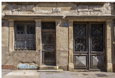
Pilastres, ferronnerie, menuiserie, bas-relief sur la façade. IVR43_20217000332NUC4A