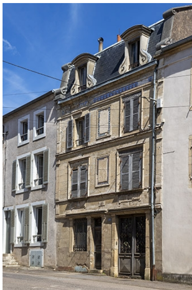
La façade antérieure, de trois quarts droite. IVR43_20217000331NUC4A