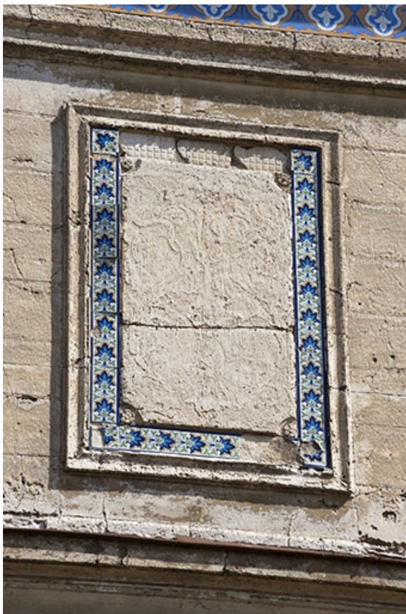
Détail de décor polychrome en céramique sur la façade.