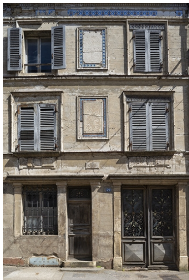
Le rez-de-chaussée et les deux étages carrés. IVR43_20217000334NUC4A