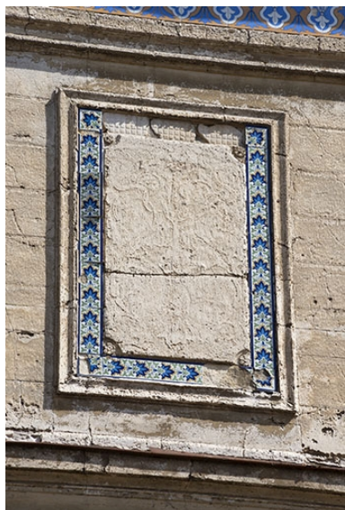
Détail de décor polychrome en céramique sur la façade. IVR43_20217000337NUC4A