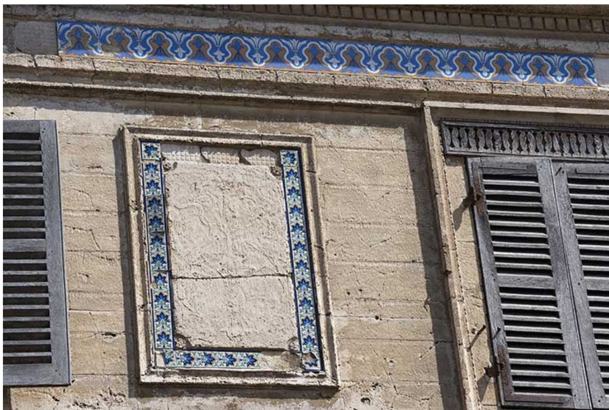
Détail de décor polychrome en céramique sur la façade.