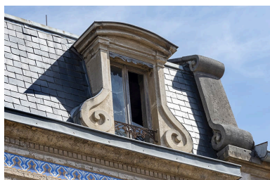
Détail de la lucarne sur le brisis, à droite.