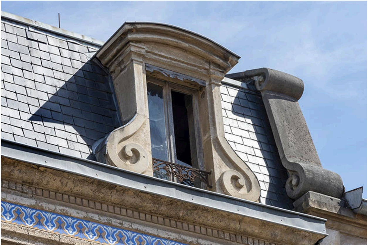
Détail de la lucarne sur le brisis, à droite.