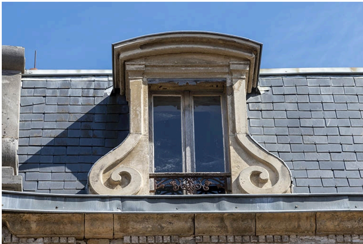
Détail de la lucarne sur brisis, à gauche.