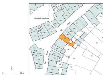
Plan-masse et de situation. Extrait du plan cadastral numérisé de la direction générale des finances publiques, 2025, 1/500.