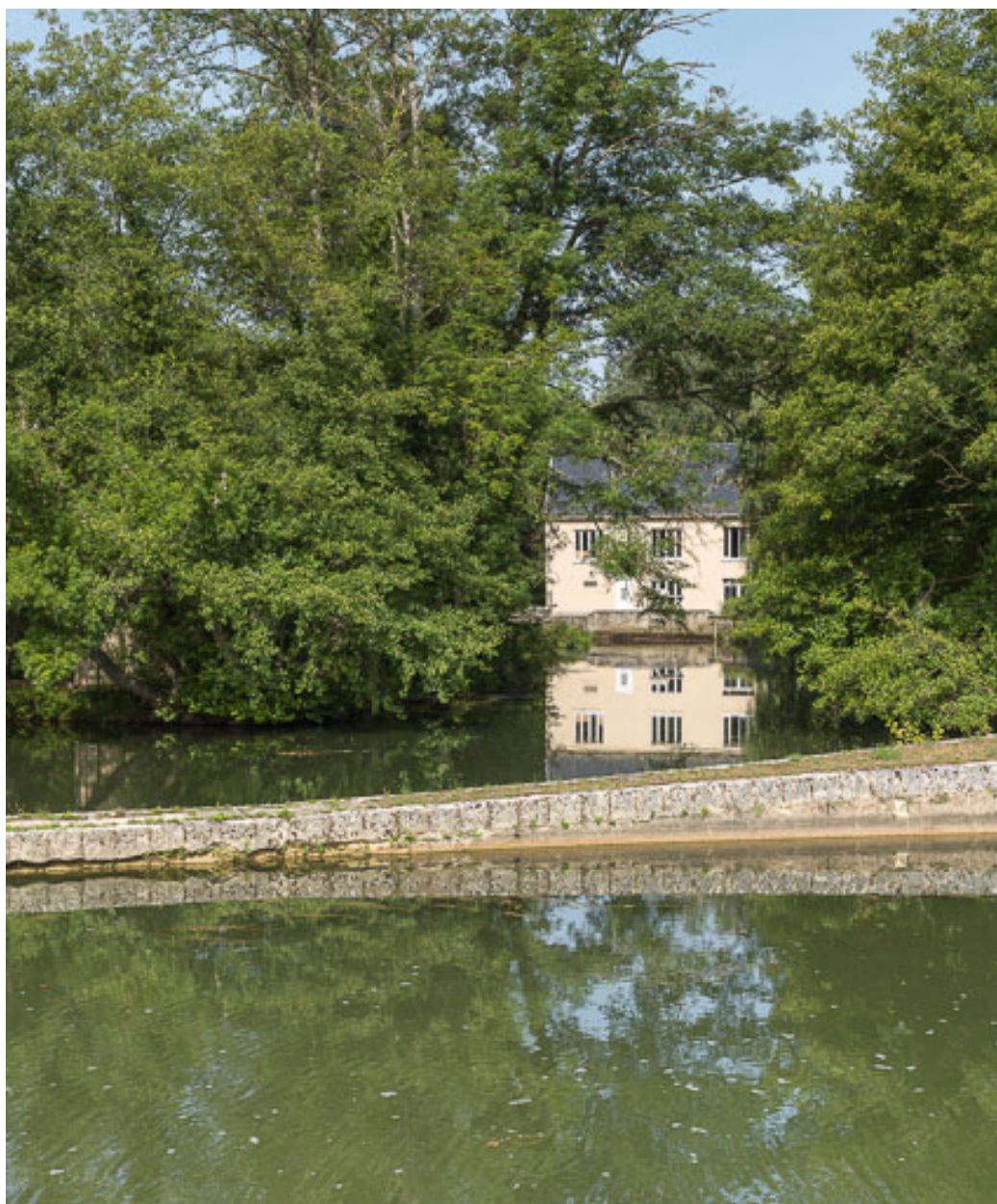
Vue du moulin.