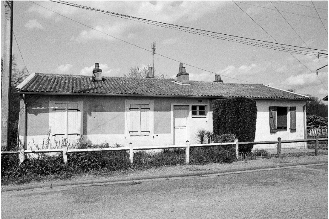
Bâtiment à 3 logements " type R ", 1939-1945.