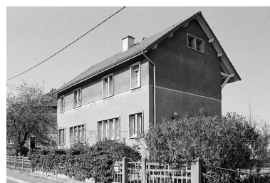
Bâtiment à 2 logements " type 16 rectifié ", toit à longs pans, 1946-1948.