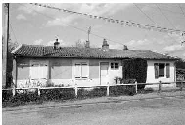
Bâtiment à 3 logements " type R ", 1939-1945. IVR26_19987100197Z