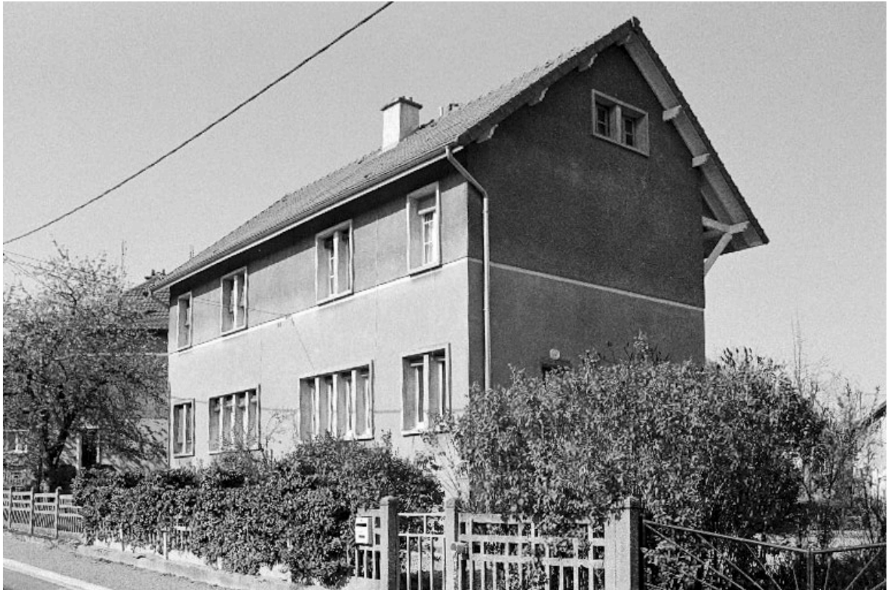
Bâtiment à 2 logements " type 16 rectifié ", toit à longs pans, 1946-1948.