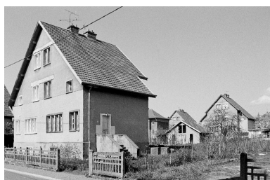
Bâtiment à 2 logements " type 16 " à meneaux, 1946-1948.