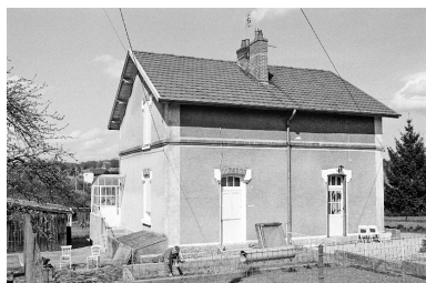
Bâtiment à 2 logements " type 8 ", 1938-1939.