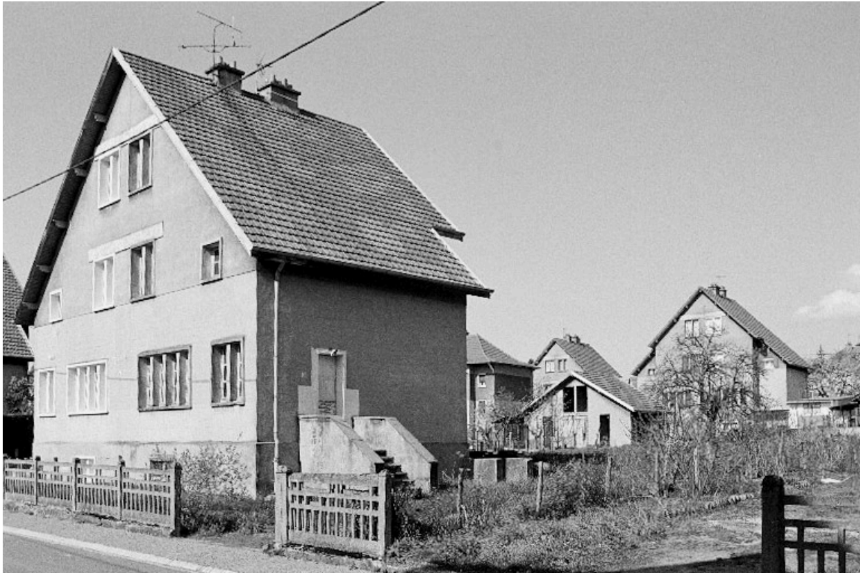
Bâtiment à 2 logements " type 16 " à meneaux, 1946-1948.