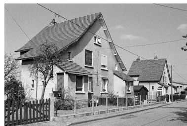
Bâtiment à logements " type 14 ", 1939-1945. IVR26_19987100198Z