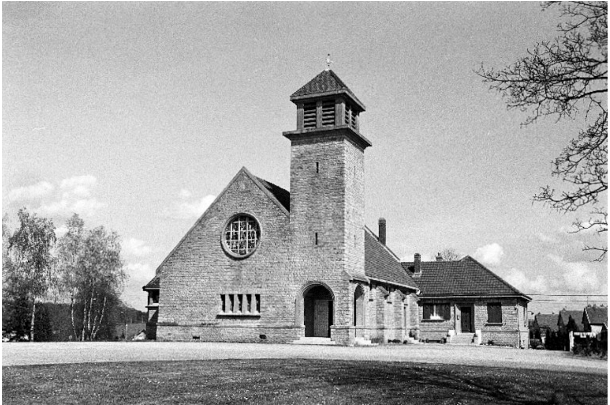
Eglise de la cité de Rozelay, 1954.