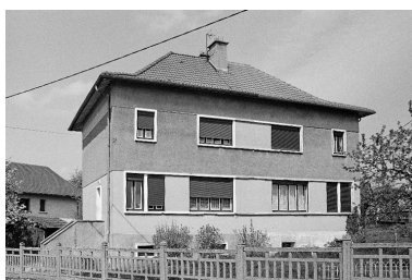
Bâtiment à 2 logements " type 16 rectifié ", toit à longs pans et croupes, 1946-1948.