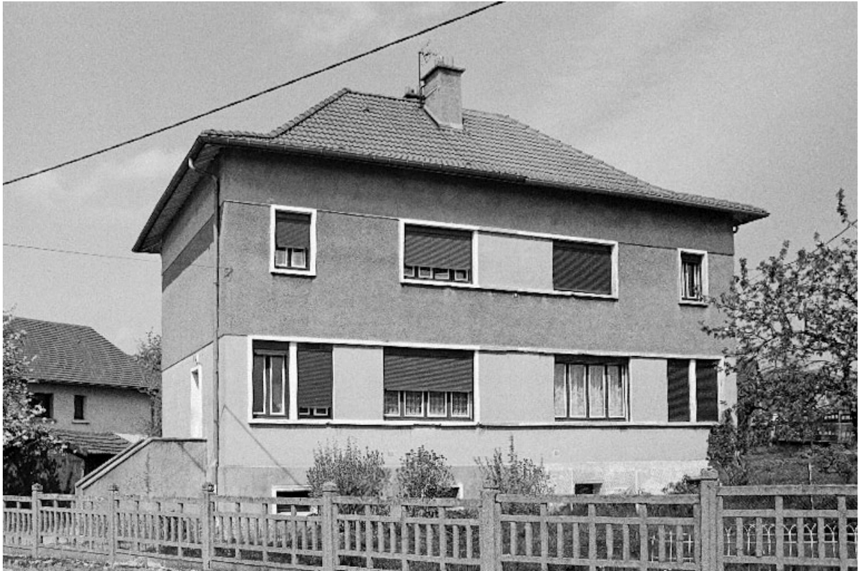
Bâtiment à 2 logements " type 16 rectifié ", toit à longs pans et croupes, 1946-1948.