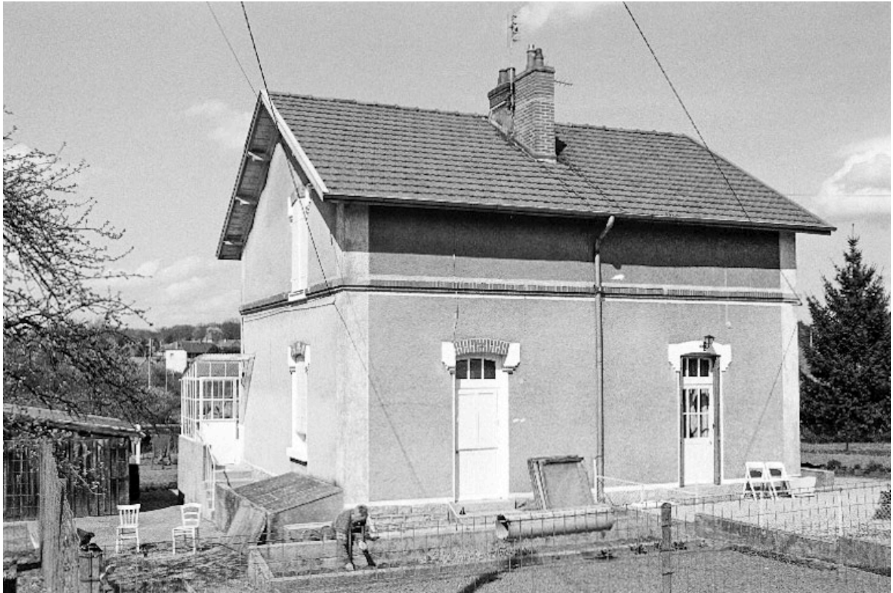
Bâtiment à 2 logements " type 8 ", 1938-1939.