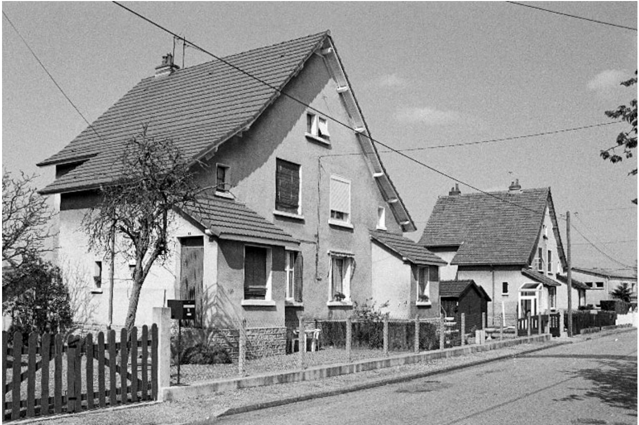
Bâtiment à logements " type 14 ", 1939-1945.