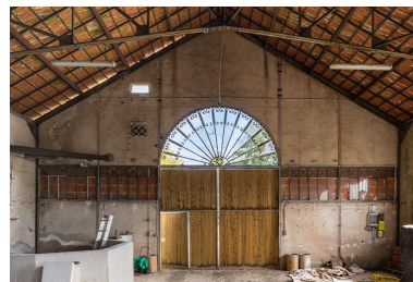
Vue intérieure. IVR26_20195800609NUC4A