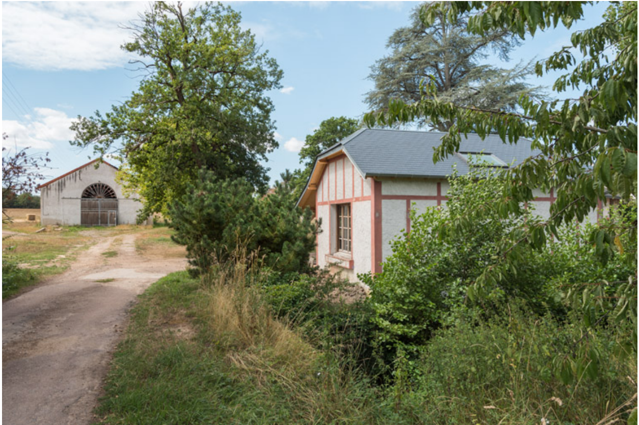
Vue du site avec le pavillon d'entrée (au premier plan) et de l'usine de mise en bouteilles (à l'arrière-plan).