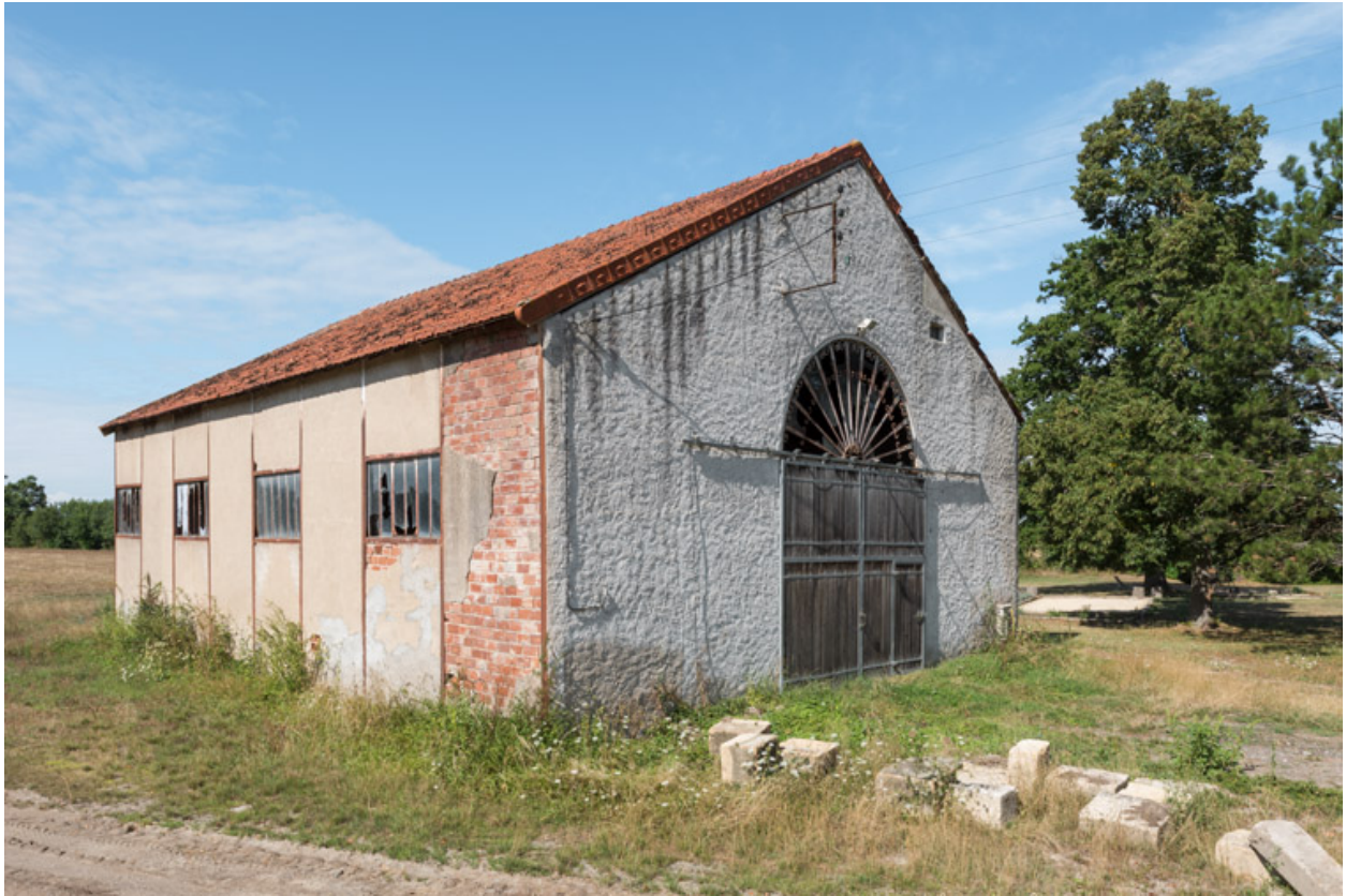
Vue de trois quarts.