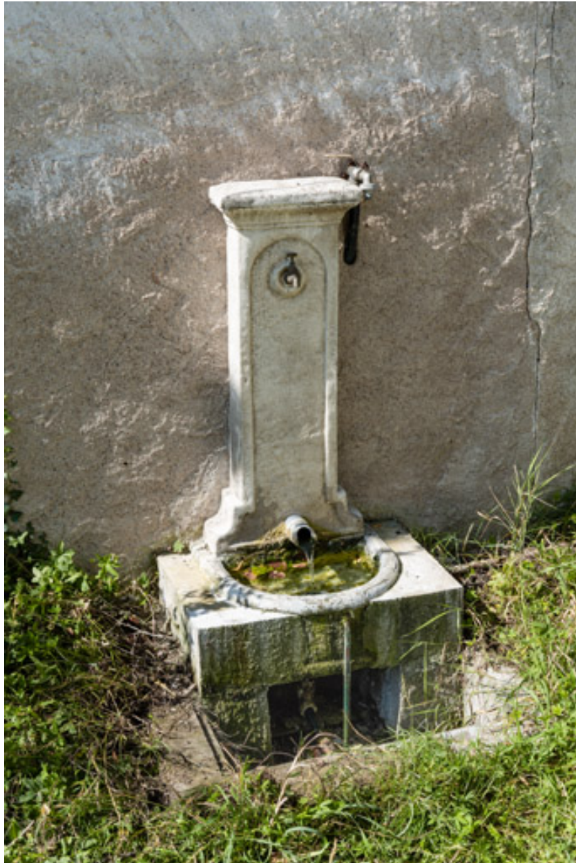
Fontaine de la source, état actuel.