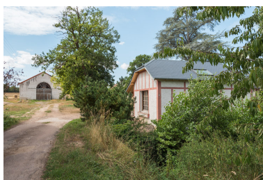
Vue du site avec le pavillon d'entrée (au premier plan) et de l'usine de mise en bouteilles (à l'arrière-plan).