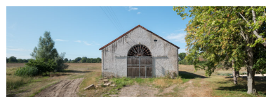
Vue de face. IVR26_20195800606NUC4AQ