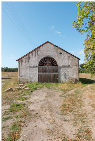
Vue de face (vue rapprochée). IVR26_20195800605NUC4A