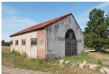
Vue de trois quarts. IVR26_20195800607NUC4A