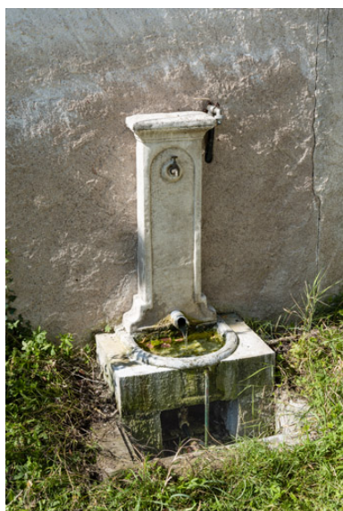
Fontaine de la source, état actuel.