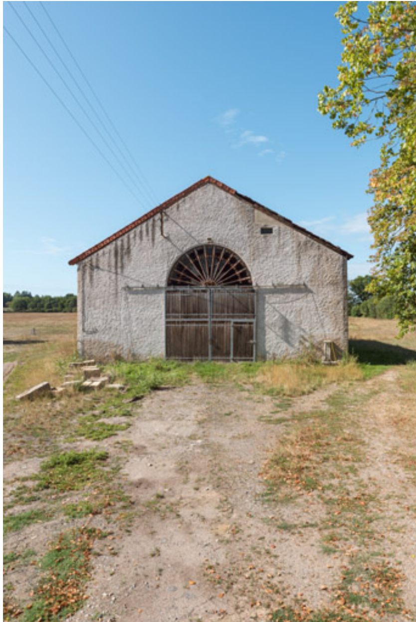
Vue de face (vue rapprochée).