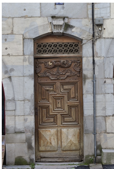
Logis principal : détail de la porte d'entrée. IVR43_20102500932NUC2A