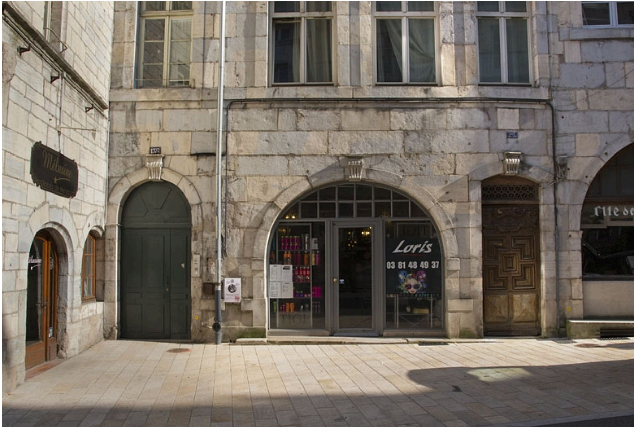
Façade antérieure : détail du rez-de-chaussée.