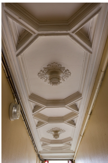
Logis principal : détail du plafond du couloir d'entrée. IVR43_20102500933NUC2A