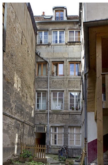
Logis principal, façade sur cour : vue d'ensemble. IVR43_20102500936NUC2A