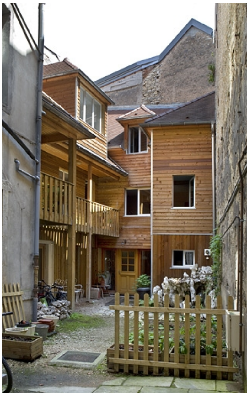
Logis secondaire : vue d'ensemble.