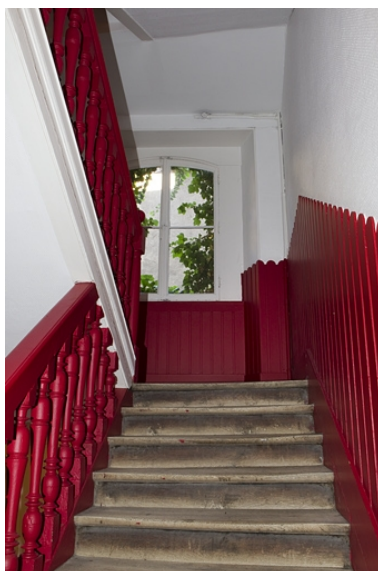
Logis principal : détail de l'escalier. IVR43_20102500934NUC2A