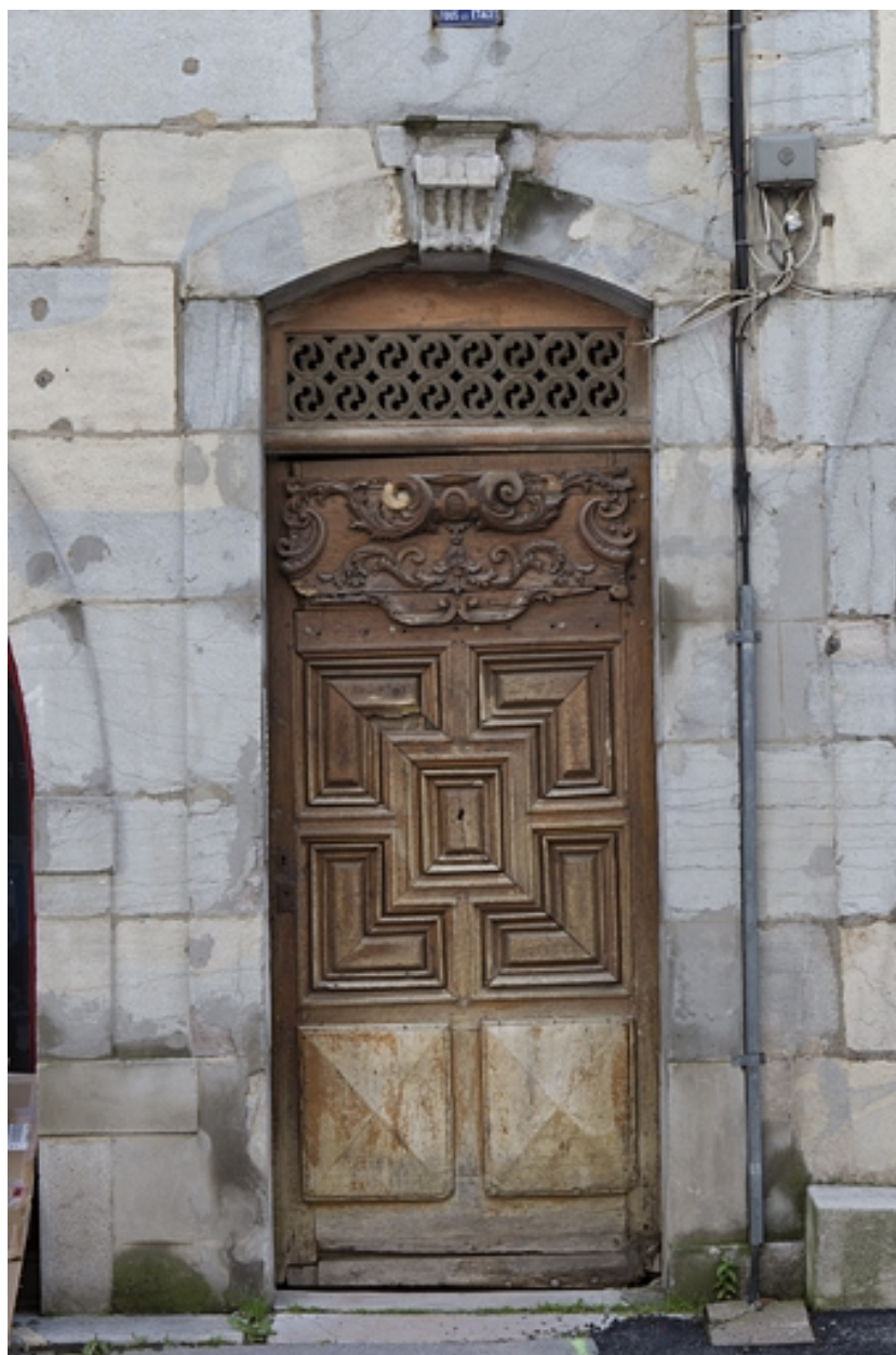
Logis principal : détail de la porte d'entrée.