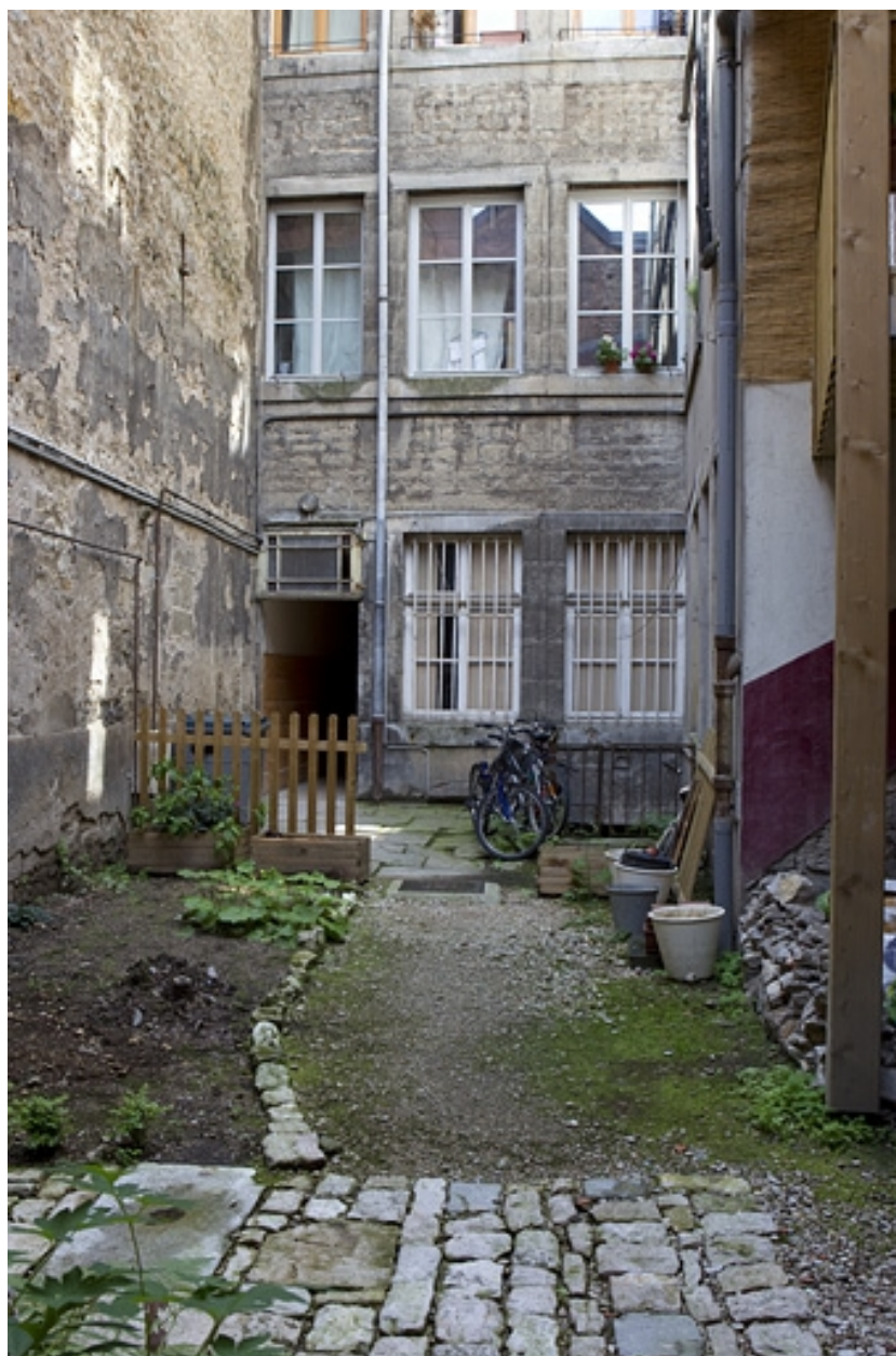
Logis principal, façade sur cour : détail du rez-de-chaussée et du premier étage.