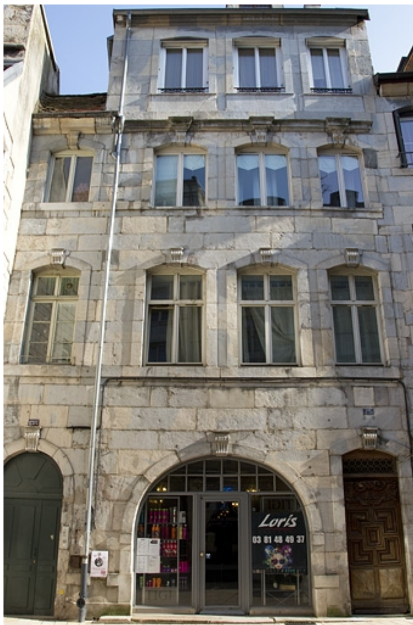
Vue d'ensemble de la façade antérieure.