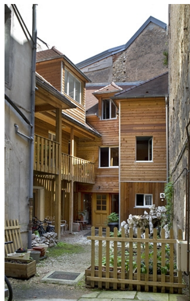
Logis secondaire : vue d'ensemble.