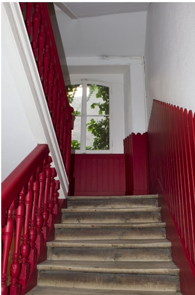
Logis principal : détail de l'escalier.