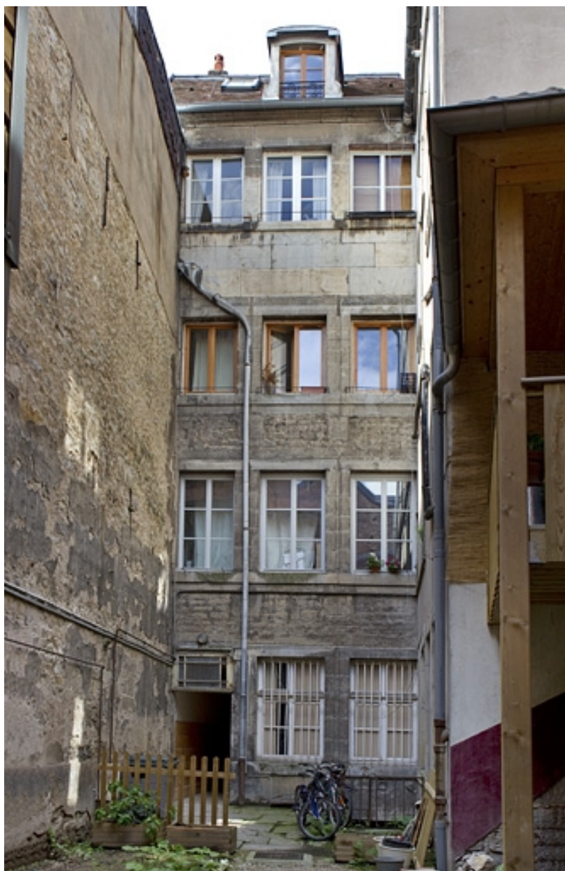
Logis principal, façade sur cour : vue d'ensemble.