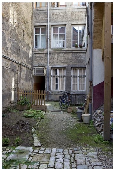
Logis principal, façade sur cour : détail du rez-de- chaussée et du premier étage. IVR43_20102500935NUC2A