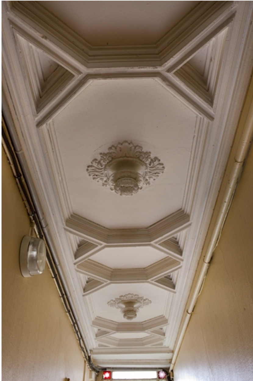
Logis principal : détail du plafond du couloir d'entrée.