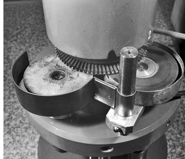
Meules et supports des saphirs (dops). IVR43_20013900042X