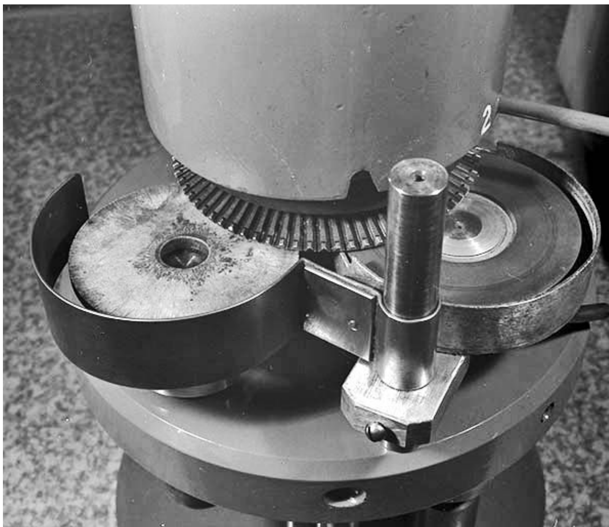
Meules et supports des saphirs (dops).