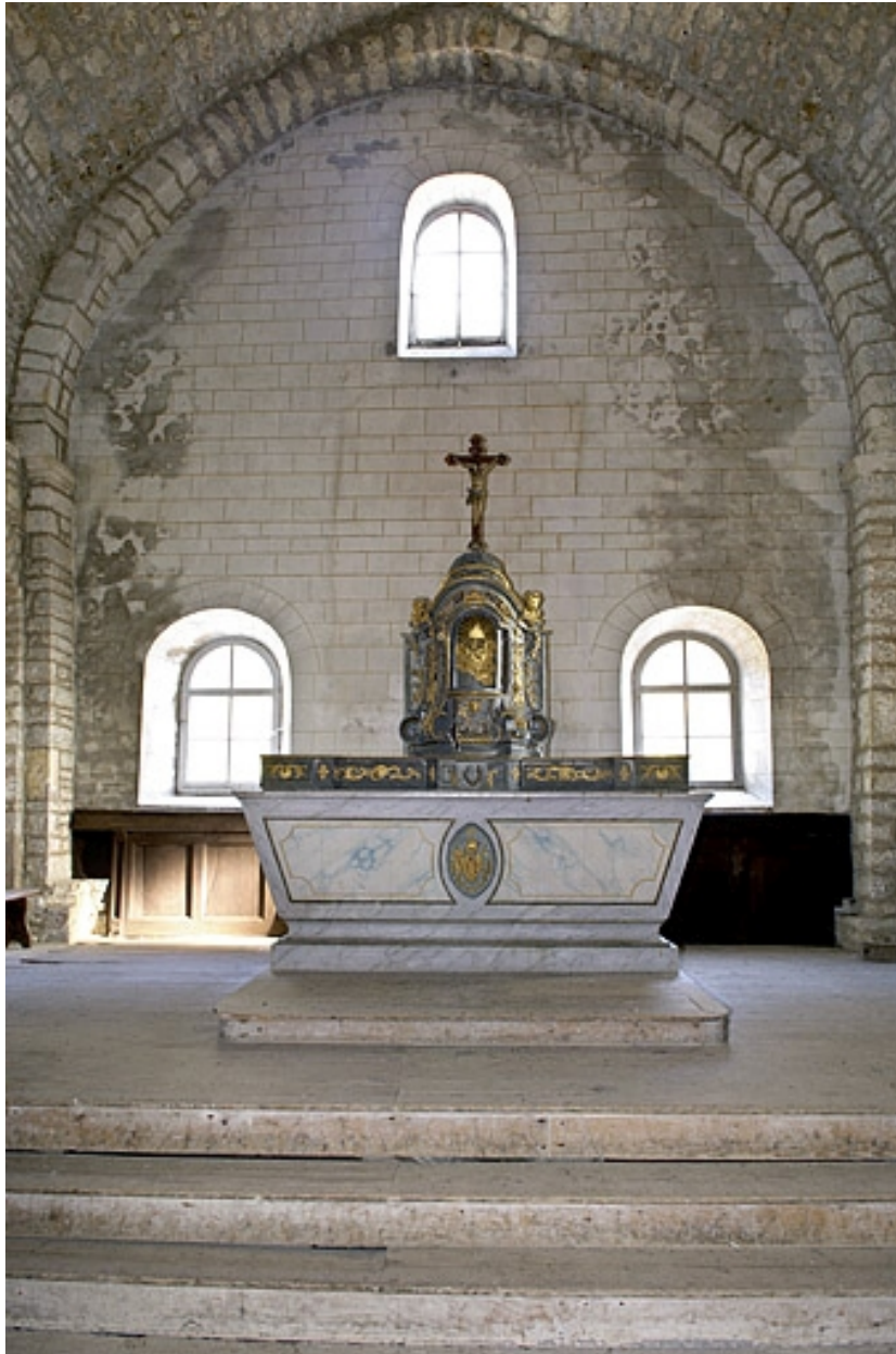
Vue générale de face.