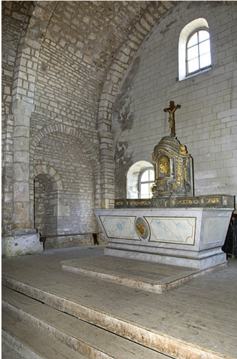
Vue générale de trois quarts gauche.