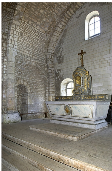
Vue générale de trois quarts gauche.