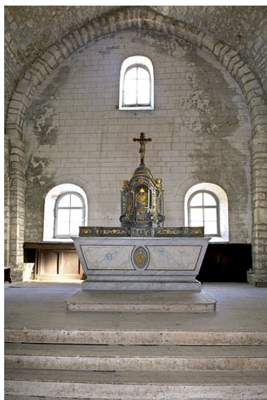
Vue générale de face. IVR43_20052500093NUCA