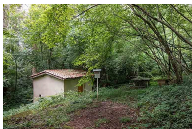
Vue d'ensemble. IVR26_20217100104NUC2A