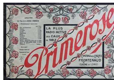
Étiquette de bouteille. IVR26_20217100109NUC2A