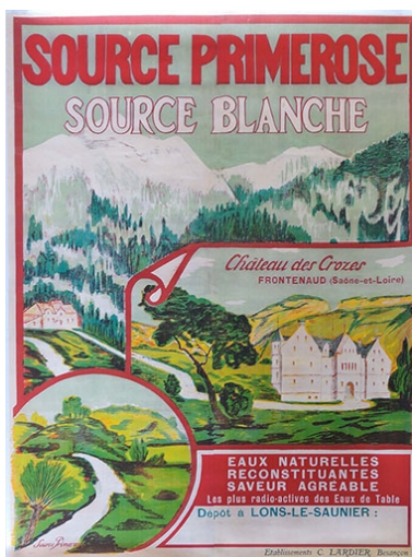
Affiche publicitaire. IVR26_20217100108NUC2A