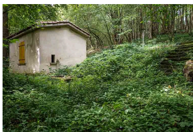
Bâtiment principal. IVR26_20217100106NUC2A