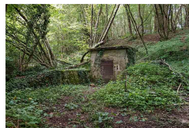
Bâtiment secondaire.