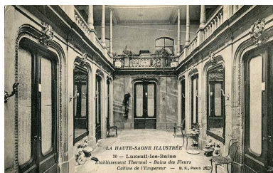
Vue intérieure du Bain des Fleurs détruit à la fin des années 1930.