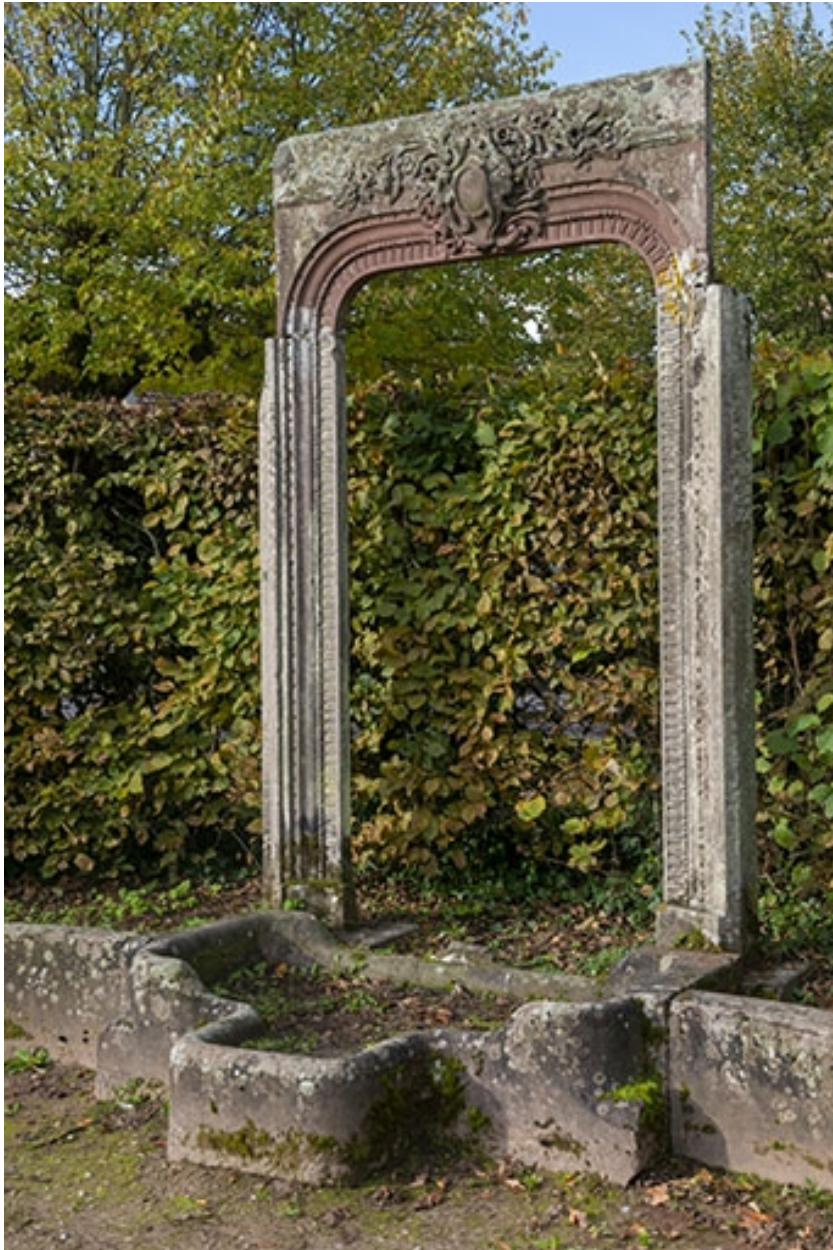
Encadrement de porte, vue de trois quarts.