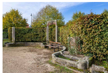
Vestiges (encadrement de porte, trumeaux et bassins) disposés en exèdre.