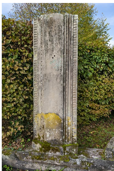
Trumeau.