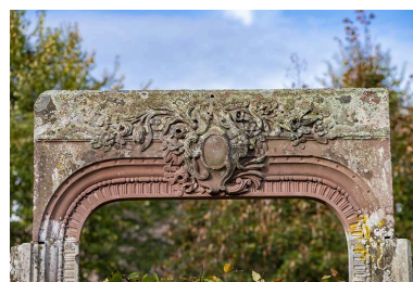
Encadrement de porte, détail du décor sculpté.