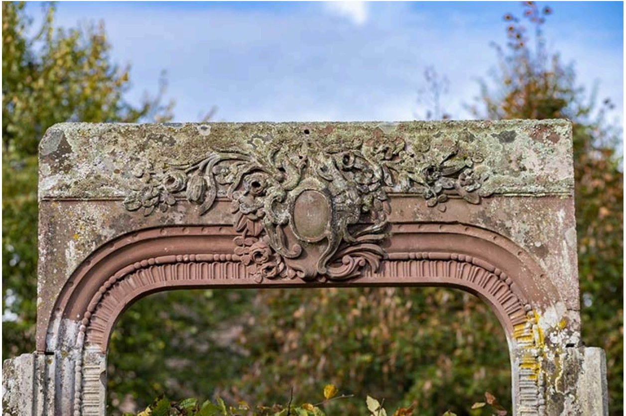
Encadrement de porte, détail du décor sculpté.