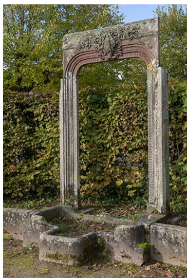
Encadrement de porte, vue de trois quarts. IVR43_20207000715NUC4A