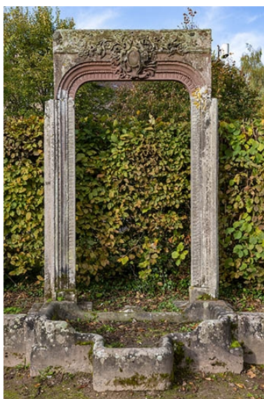
Encadrement de porte, vue de face. IVR43_20207000714NUC4A