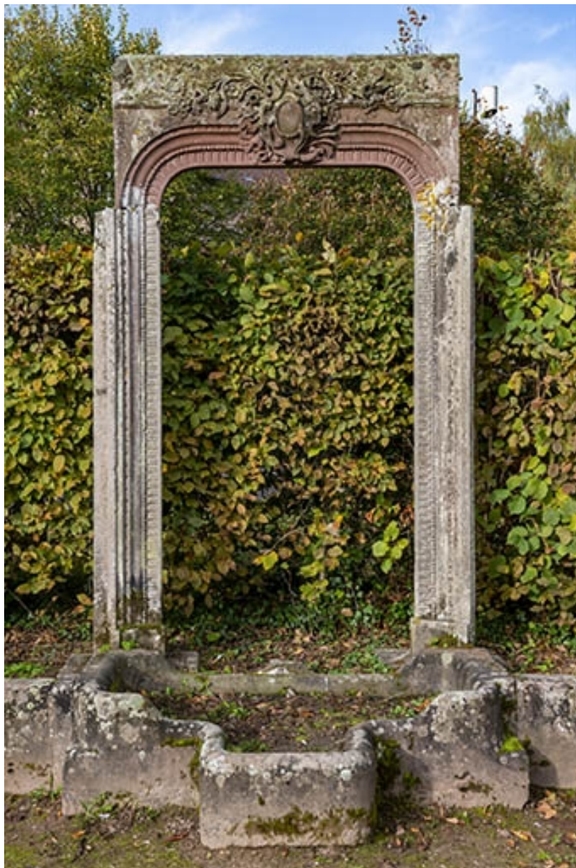
Encadrement de porte, vue de face.