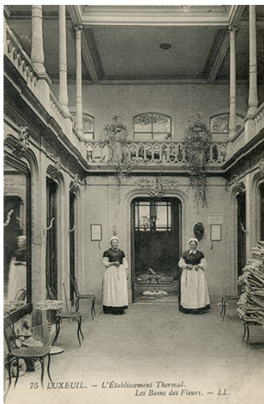
Vue intérieure du Bain des Fleurs détruit à la fin des années 1930.