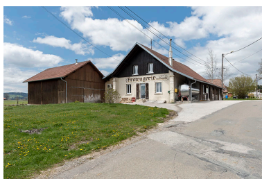
Vue d'ensemble, depuis le sud-est (avec la pièce d'affinage récente à gauche). IVR43_20192500329NUC4A