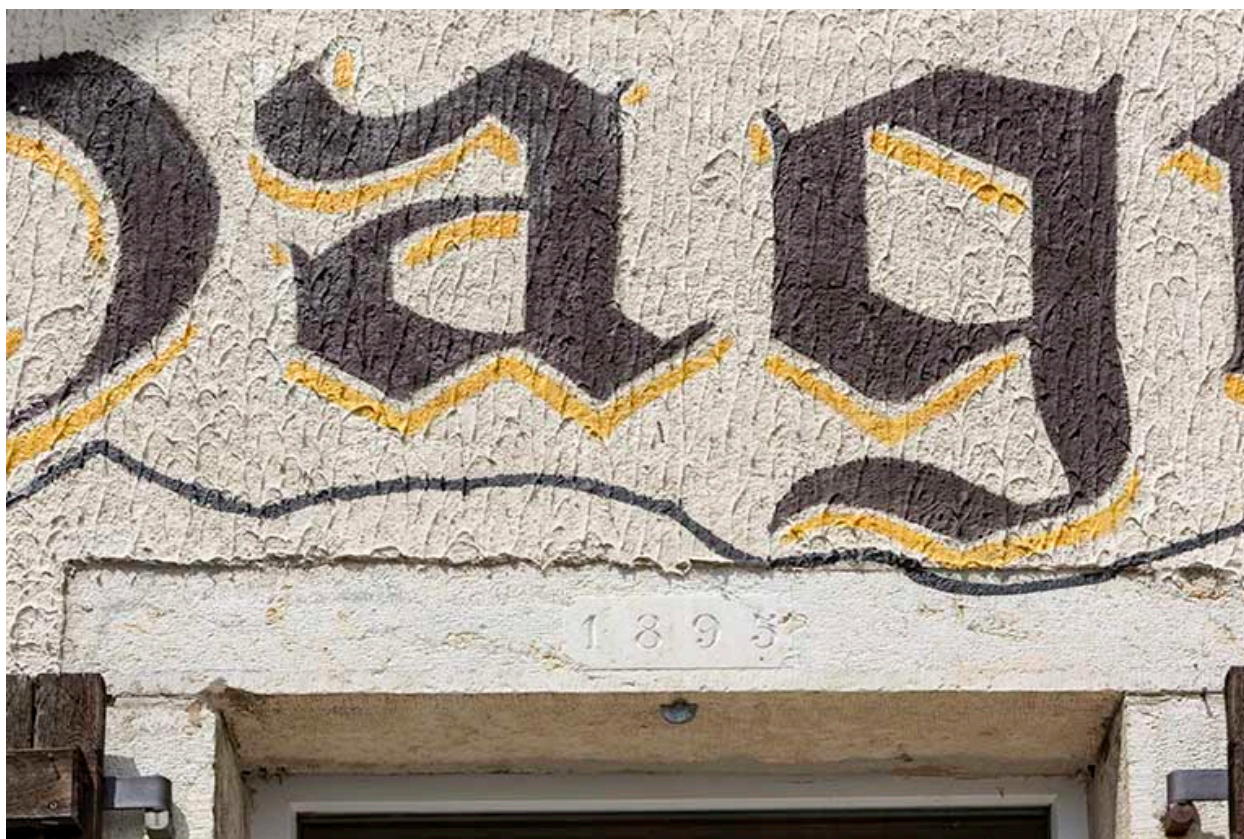
Façade antérieure : linteau daté 1895.