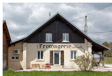
Façade antérieure. IVR43_20192500330NUC4A