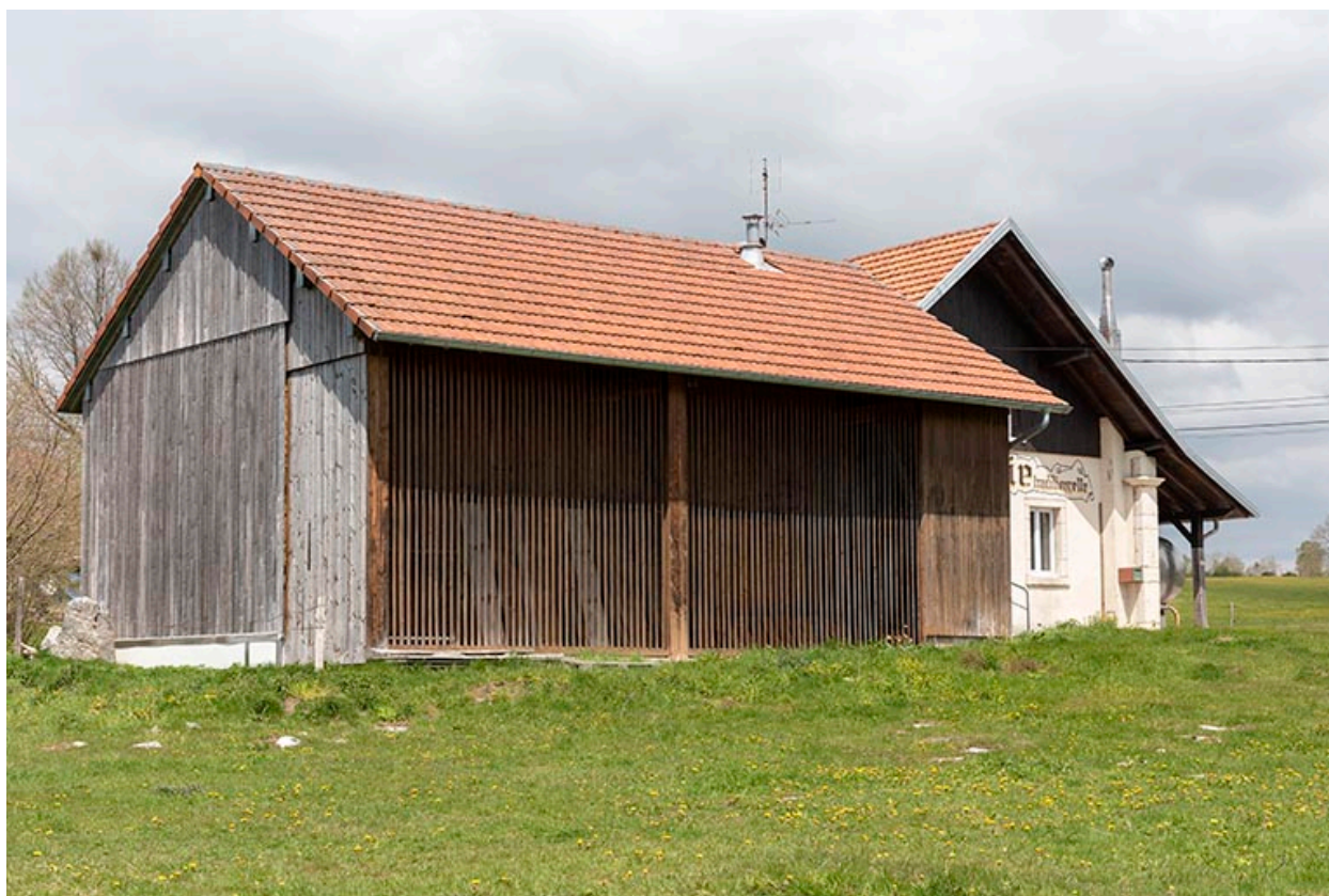
Pièce d'affinage récente, depuis le sud-ouest.