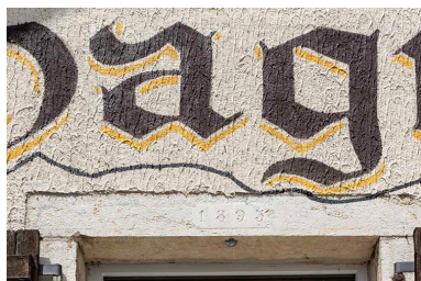
Façade antérieure : linteau daté 1895. IVR43_20192500331NUC4A