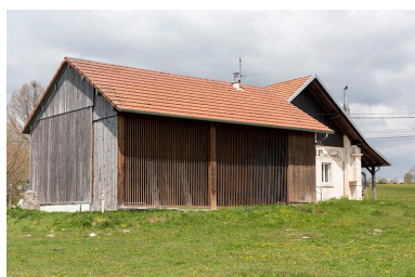
Pièce d'affinage récente, depuis le sud-ouest. IVR43_20192500332NUC4A