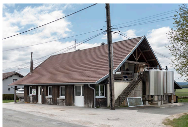
Façades postérieure et latérale droite. IVR43_20192500333NUC4A