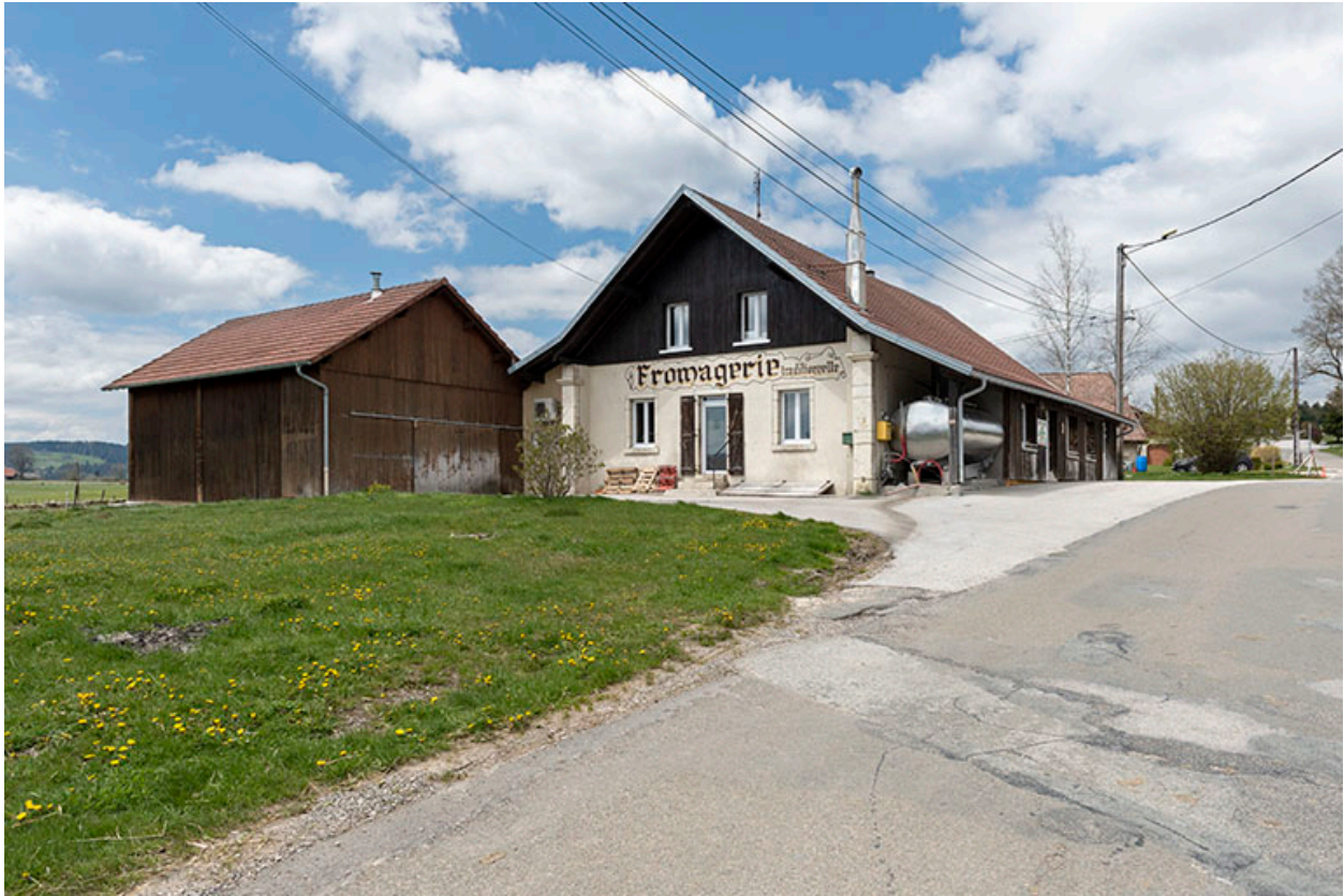
Vue d'ensemble, depuis le sud-est (avec la pièce d'affinage récente à gauche).