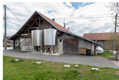
Façade postérieure. IVR43_20192500334NUC4A