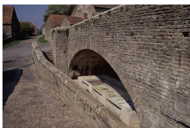
Vue extérieure. IVR26_19987100725ZA