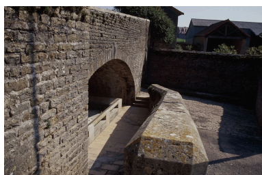
Vue extérieure. IVR26_19987100726ZA