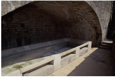
Vue intérieure. IVR26_19987100727ZA