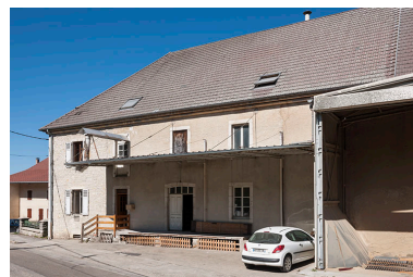
Façade sud-est de la minoterie. IVR43_20162501161NUC4A