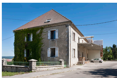
Extrémité sud du bâtiment : bureaux et logements. IVR43_20162501160NUC4A