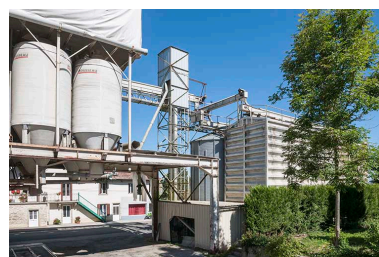
Silos et installations de chargement/déchargement. IVR43_20162501162NUC4A