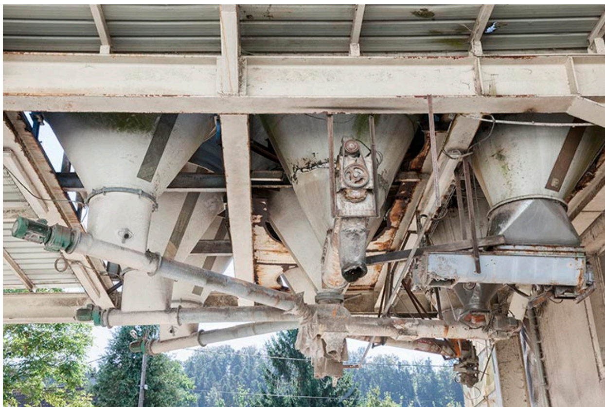
Trémies de chargement.