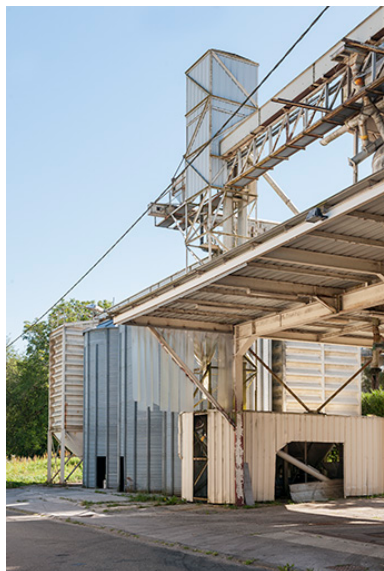
Installations de chargement/déchargement.