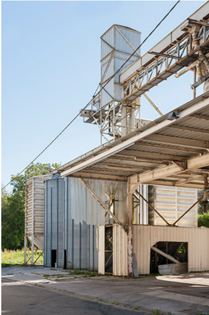
Installations de chargement/déchargement.