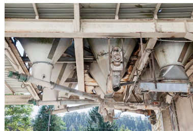
Trémiés de chargement. IVR43_20162501157NUC4A