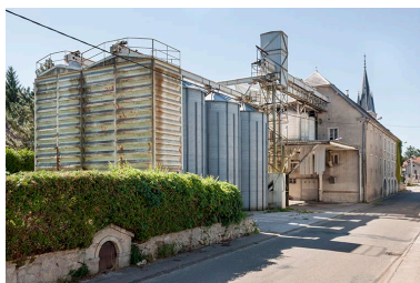
Vue d'ensemble depuis la route du Val.