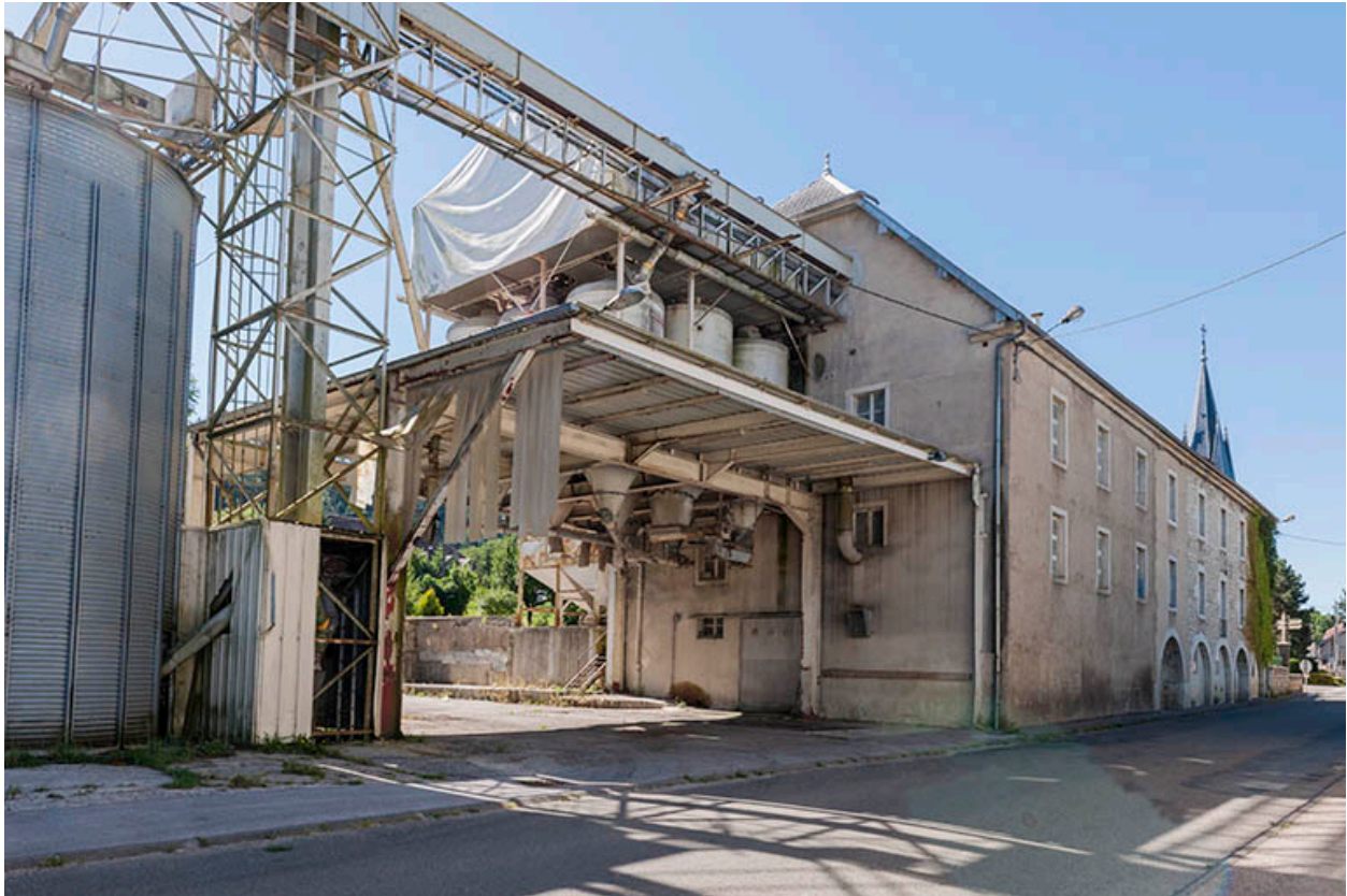
Vue de trois quarts arrière.