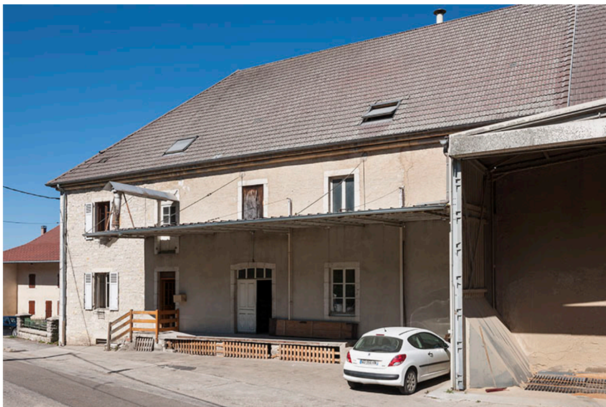
Façade sud-est de la minoterie.