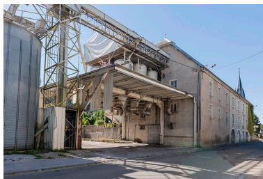
Vue de trois quarts arrière. IVR43_20162501158NUC4A