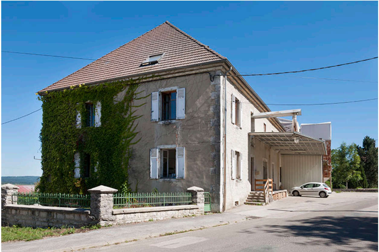
Extrémité sud du bâtiment : bureaux et logements.