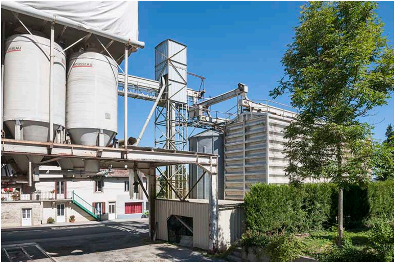
Silos et installations de chargement/déchargement.