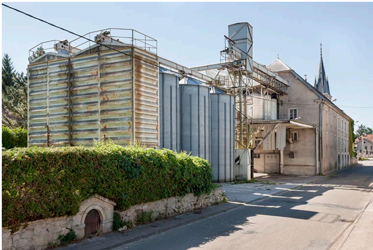
Vue d'ensemble depuis la route du Val.