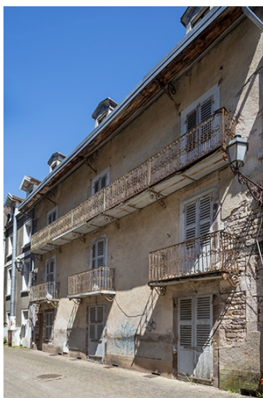
Façade sur l'allée des Romains, vue de trois quarts depuis le sud. IVR43_20207000560NUC4A