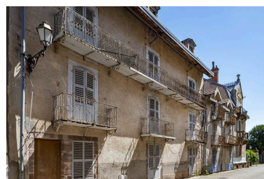
Façade sur l'allée des Romains, vue de trois quarts depuis le nord.