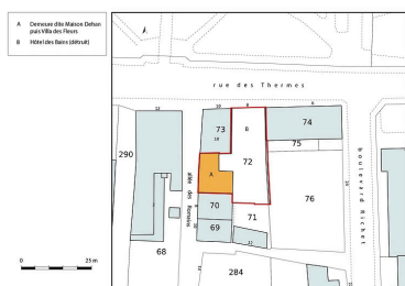
Plan-masse et de situation, extrait du plan cadastral (2021). IVR43_20217000183NUDA