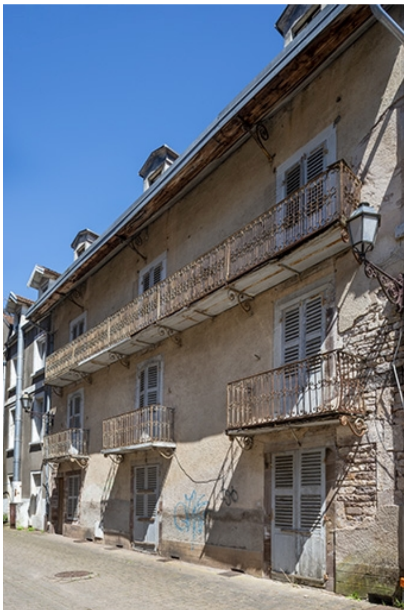
Façade sur l'allée des Romains, vue de trois quarts depuis le sud.