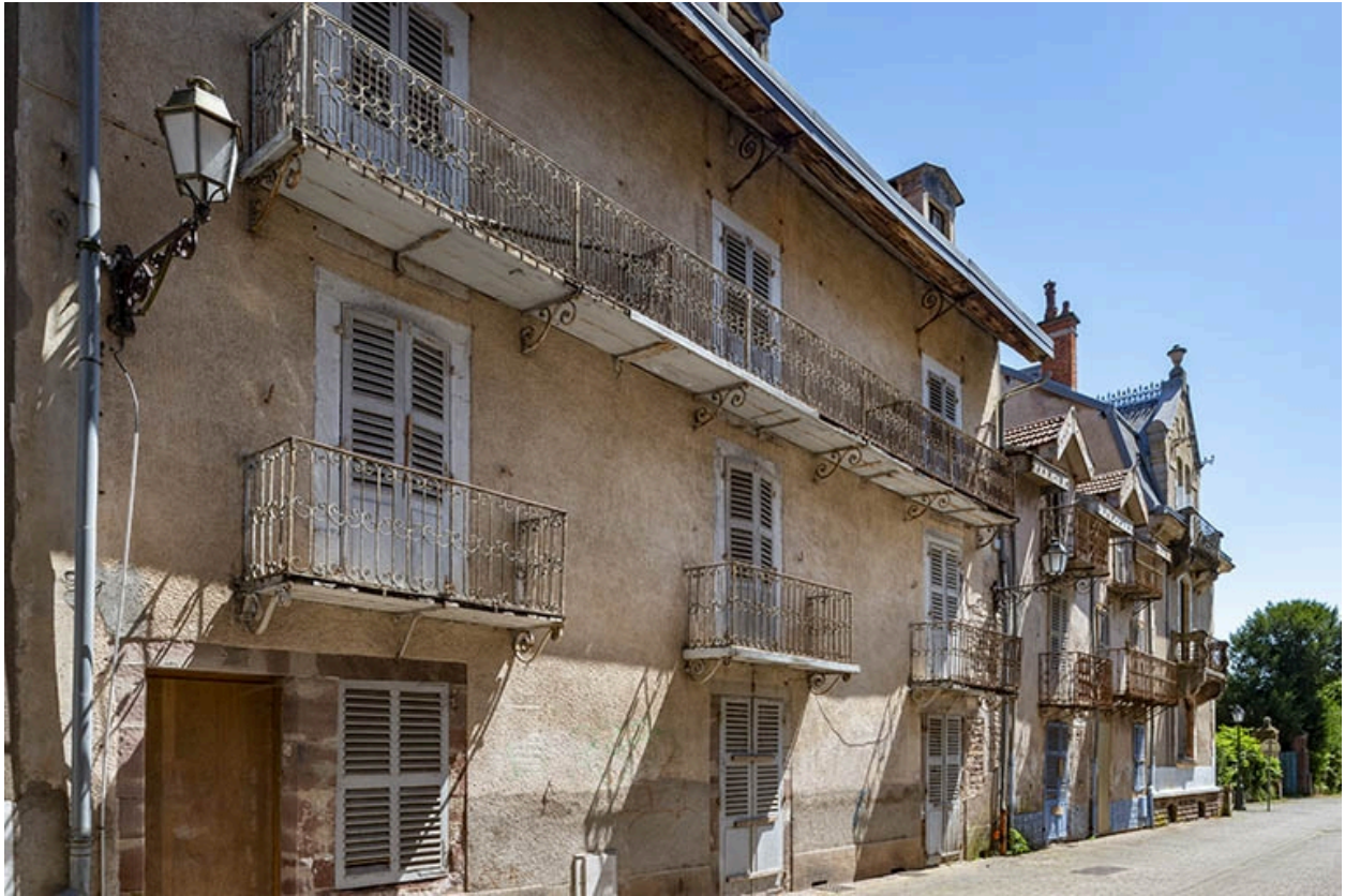
Façade sur l'allée des Romains, vue de trois quarts depuis le nord.