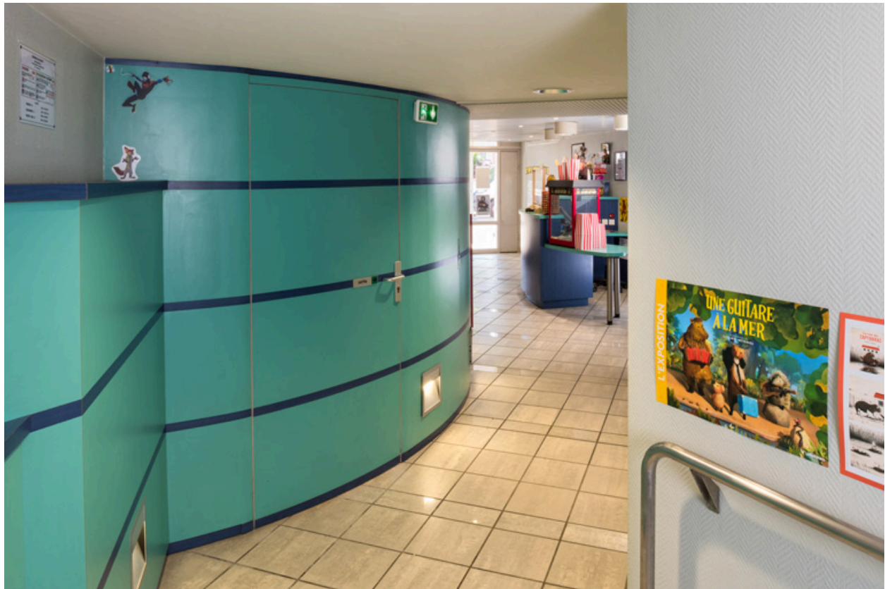
Vestibule, depuis le fond.