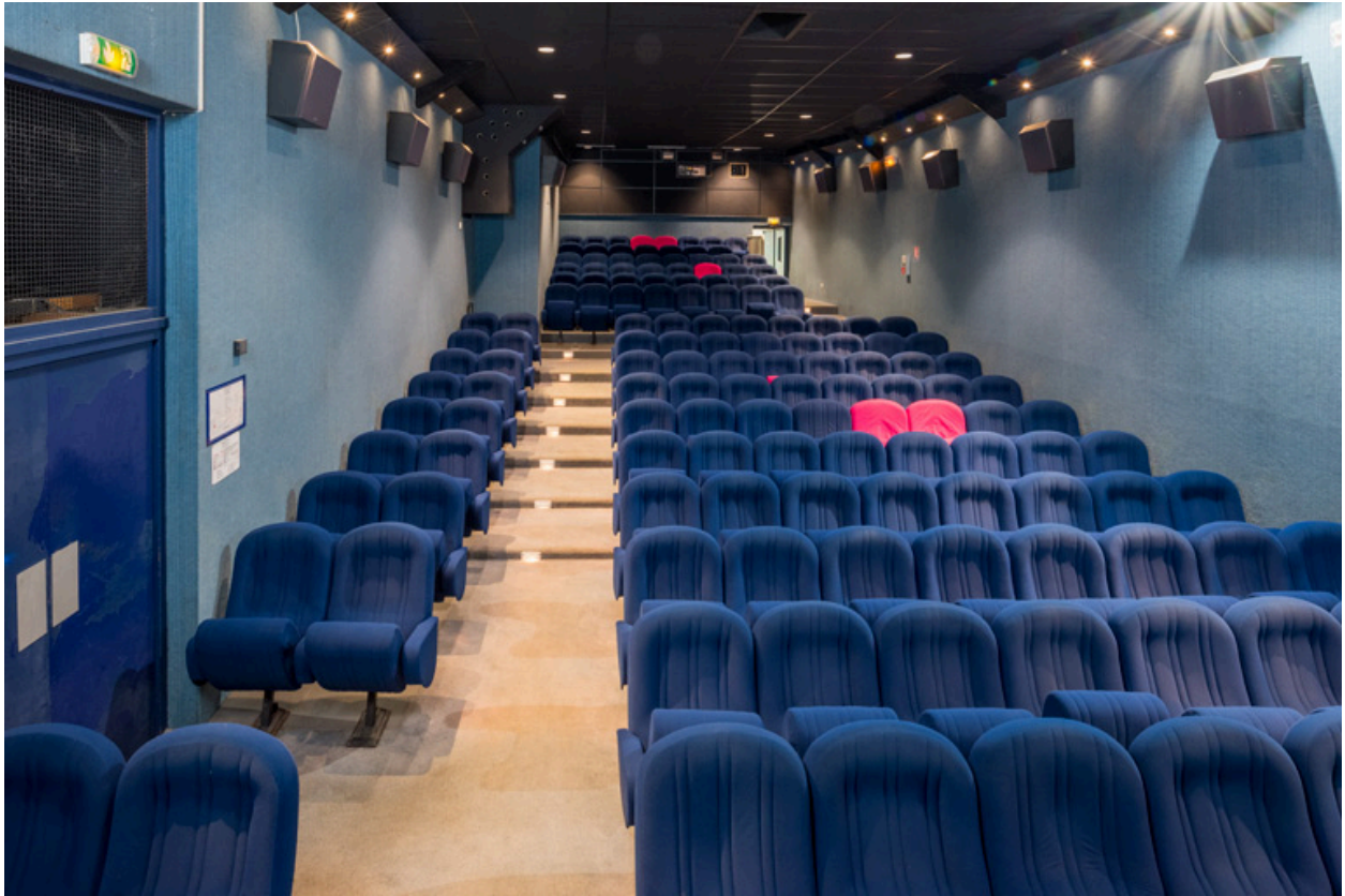
La salle, vue depuis l'écran