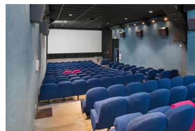
La salle, vue vers l'écran depuis l'entrée. IVR26_20257100736NUC4A