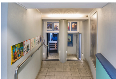
Couloir desservant la salle, vu depuis le vestibule. IVR26_20257100735NUC4A