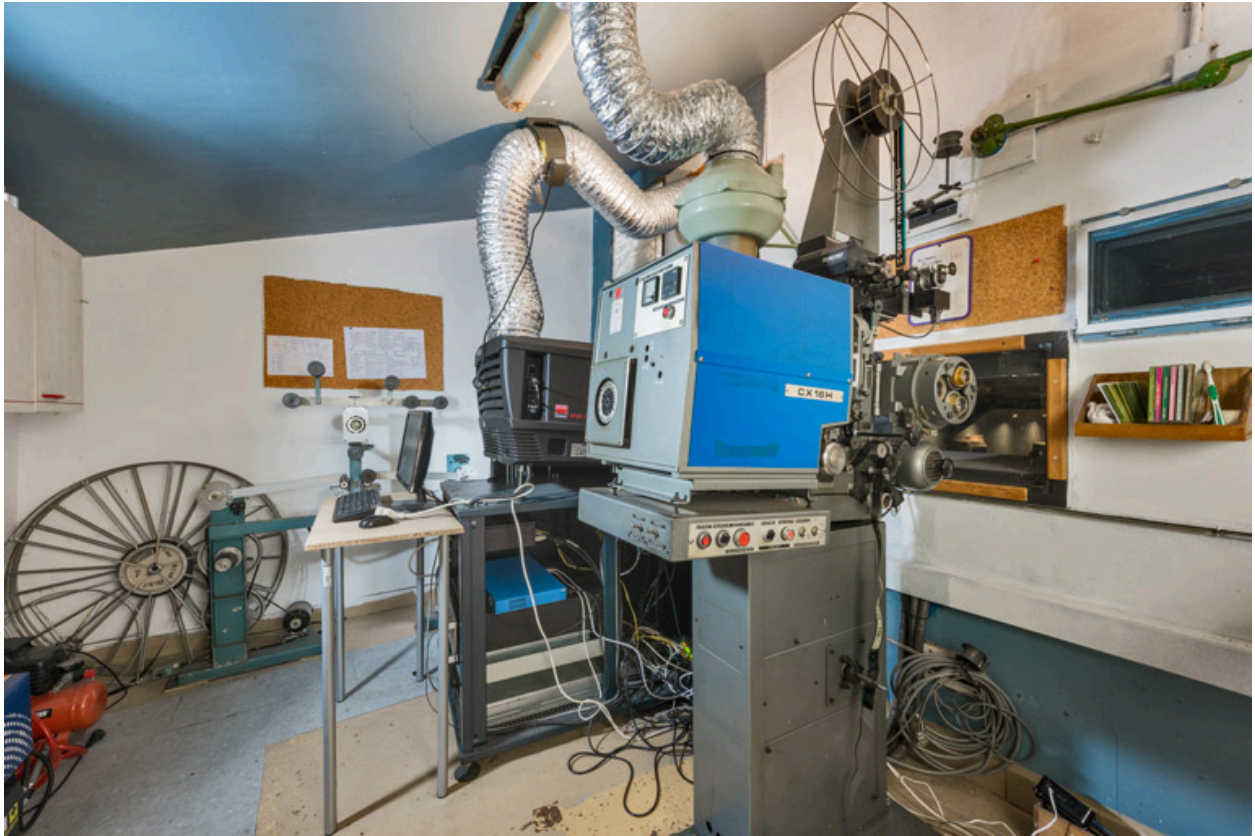
La cabine de projection.