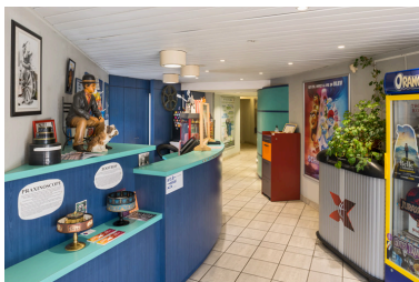
Vestibule, depuis l'entrée. Accueil à gauche, accès à la salle au fond au centre.