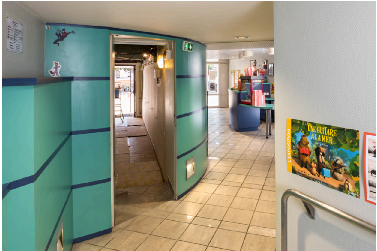
Vestibule, depuis le fond. A droite, l'ancien couloir d'accès au cinéma (avant 2001-2002).