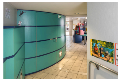
Vestibule, depuis le fond. IVR26_20257100734NUC4A

Façade antérieure. L'ancienne entrée se trouve entre la nouvelle et le bar. IVR26_20257100730NUC4A