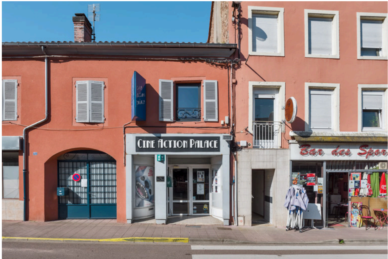
Façade antérieure. L'ancienne entrée se trouve entre la nouvelle et le bar.