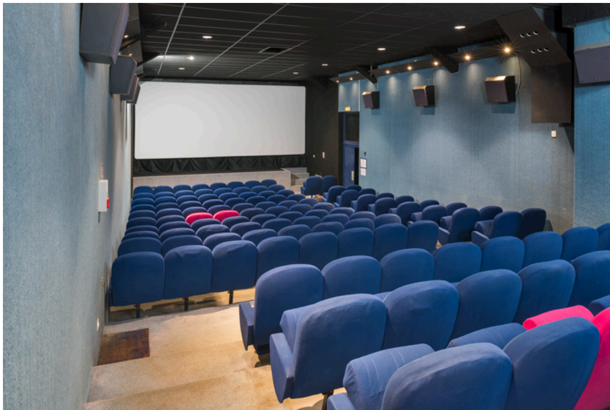
La salle, vue vers l'écran depuis l'entrée.