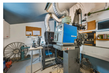
La cabine de projection.