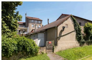
Façade postérieure, de trois quarts gauche. IVR26_20257100743NUC4A

Plan-masse et de situation. Extrait du plan cadastral de la Direction Générale des Finances Publiques (DGFIP), 2022, section AH, 1/1 000 agrandi à 1/750. IVR26_20267100179NUDA