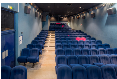
La salle, vue depuis l'écran IVR26_20257100738NUC4A