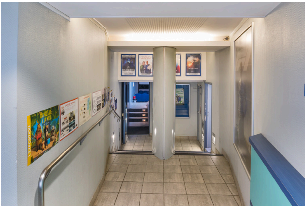
Couloir desservant la salle, vu depuis le vestibule.