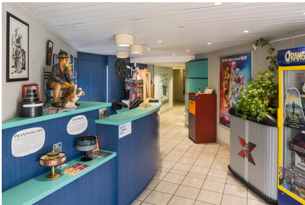
Vestibule, depuis l'entrée. Accueil à gauche, accès à la salle au fond au centre.