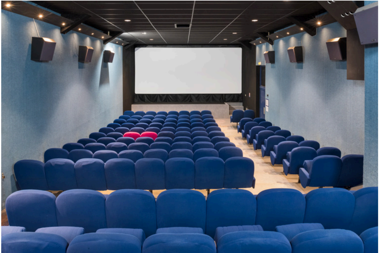
La salle, vue vers l'écran.