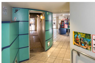
Vestibule, depuis le fond. A droite, l'ancien couloir d'accès au cinéma (avant 2001-2002). IVR26_20257100733NUC4A