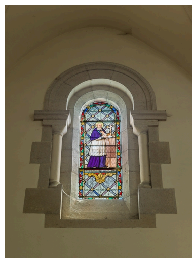
Verrière de saint François de Sales.

IVR26_20162100312NUC2A