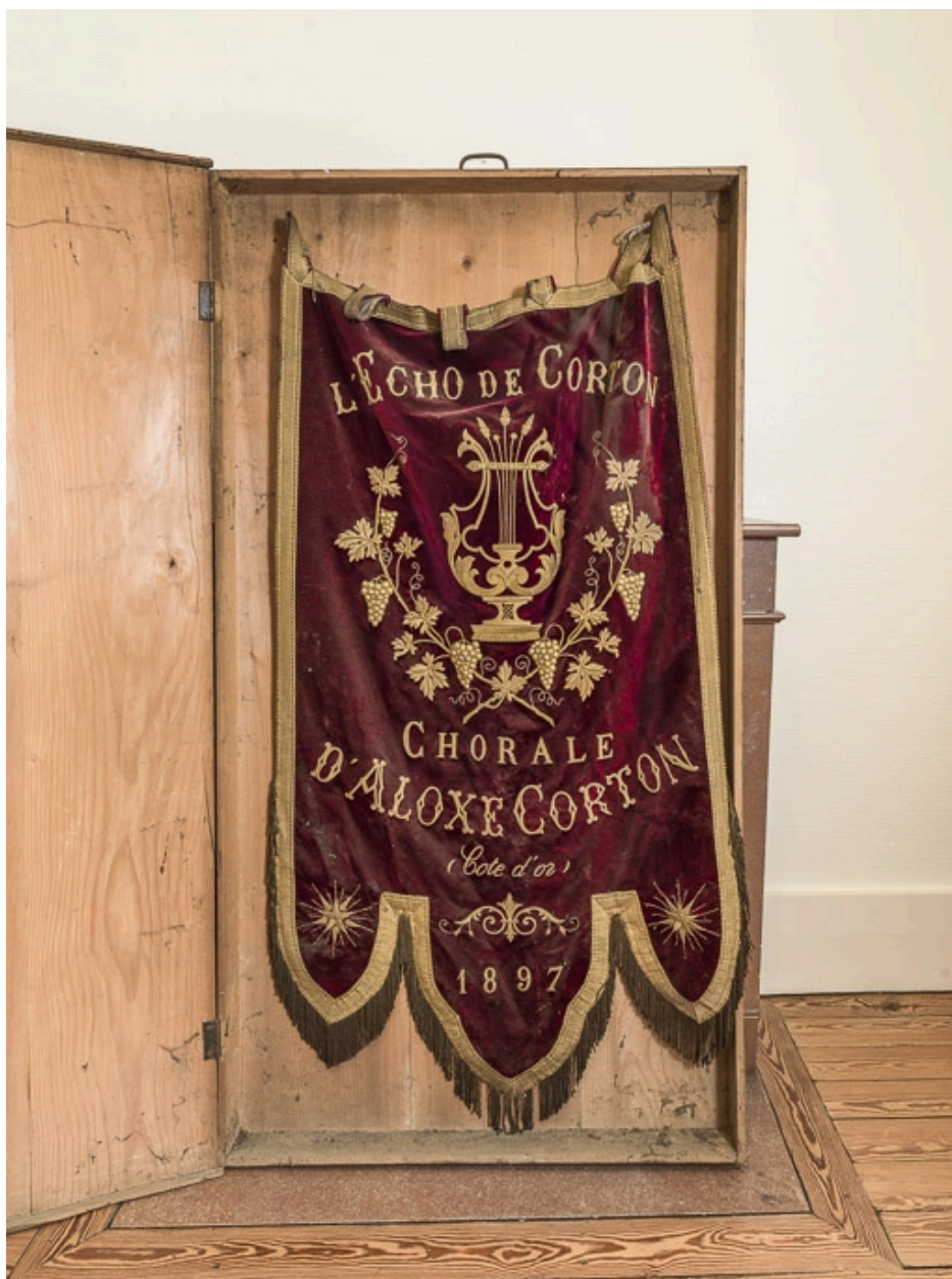
Bannière de la chorale d'Aloxe-Corton, conservée à la mairie.