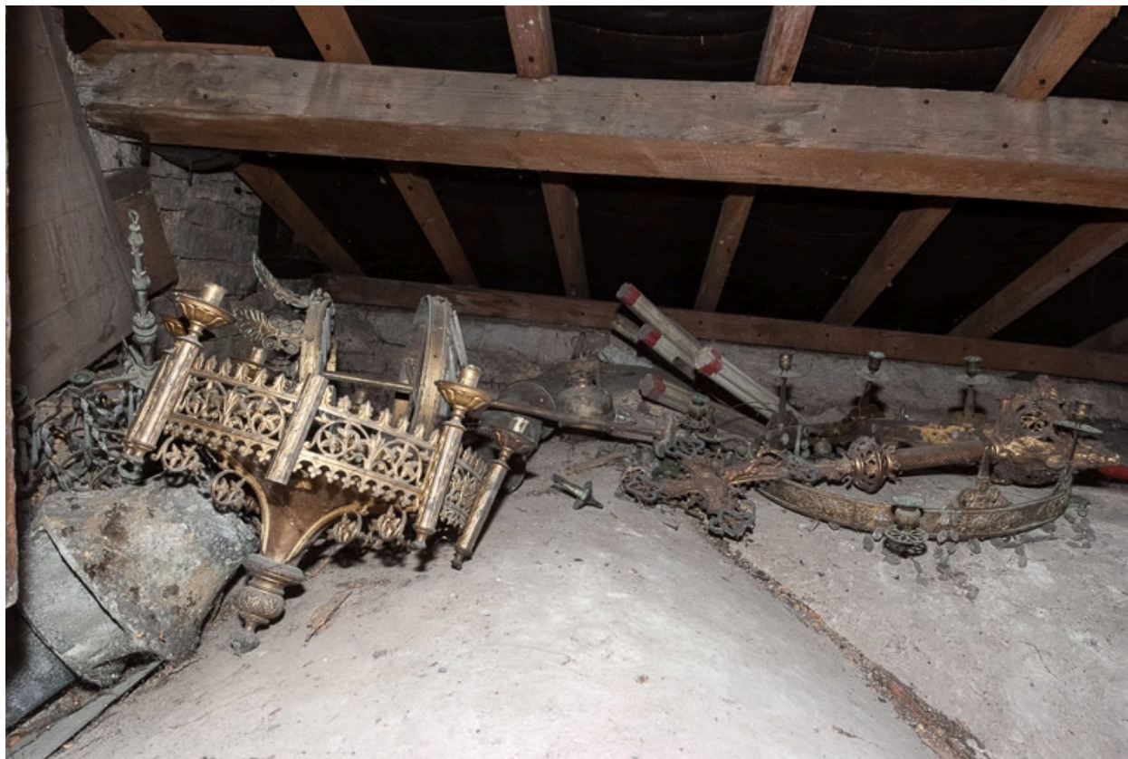
Objets mobiliers déposés dans les combles.