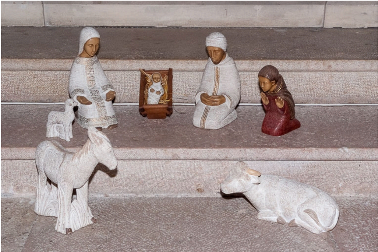
Figures de crèche.