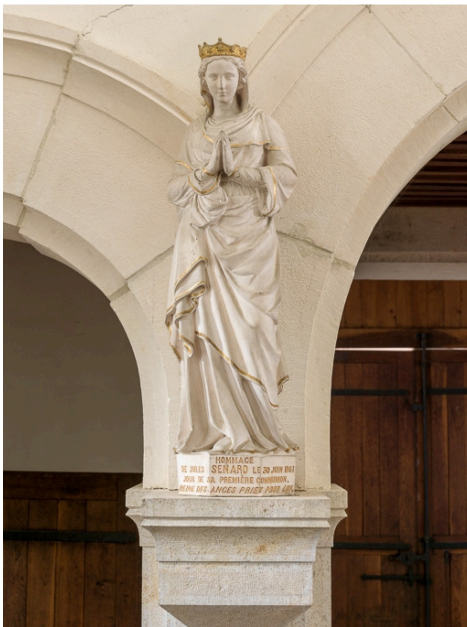
Statue portant l'inscription "REINE DES ANGES PRIEZ POUR LUI".