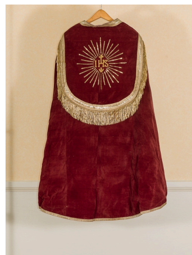
Chape rouge. IVR26_20162100361NUC2A