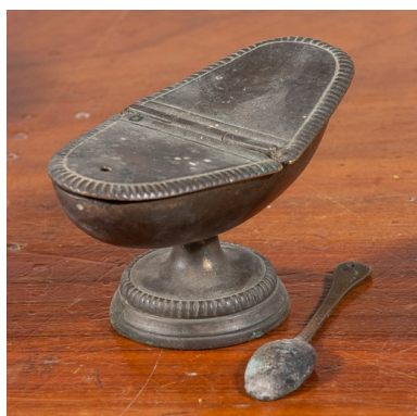
Navette.