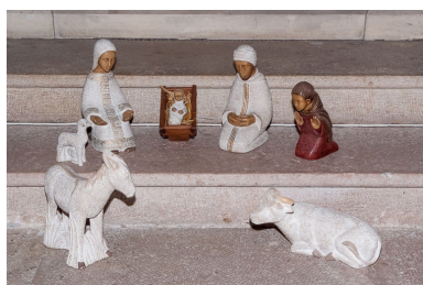
Figures de crèche.

Phot. Pierre-Marie Barbe-Richaud IVR26_20162100357NUC2A