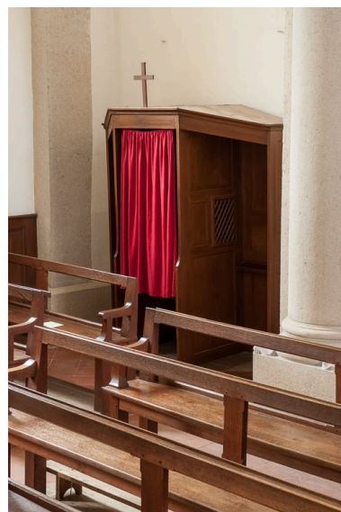
Confessionnal. IVR26_20162100364NUC2A