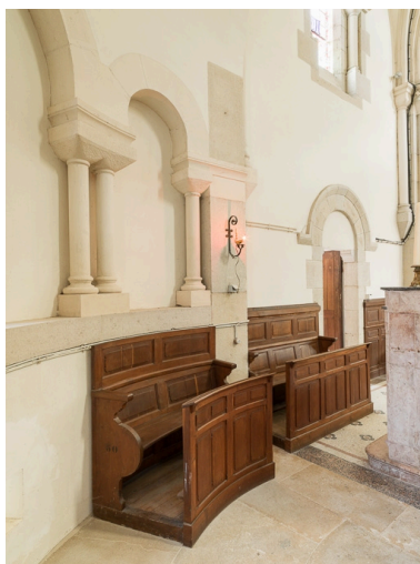
Stalles du chœur. IVR26_20162100356NUC2A