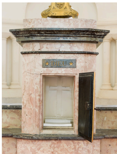
Tabernacle du maître-autel. IVR26_20162100355NUC2A