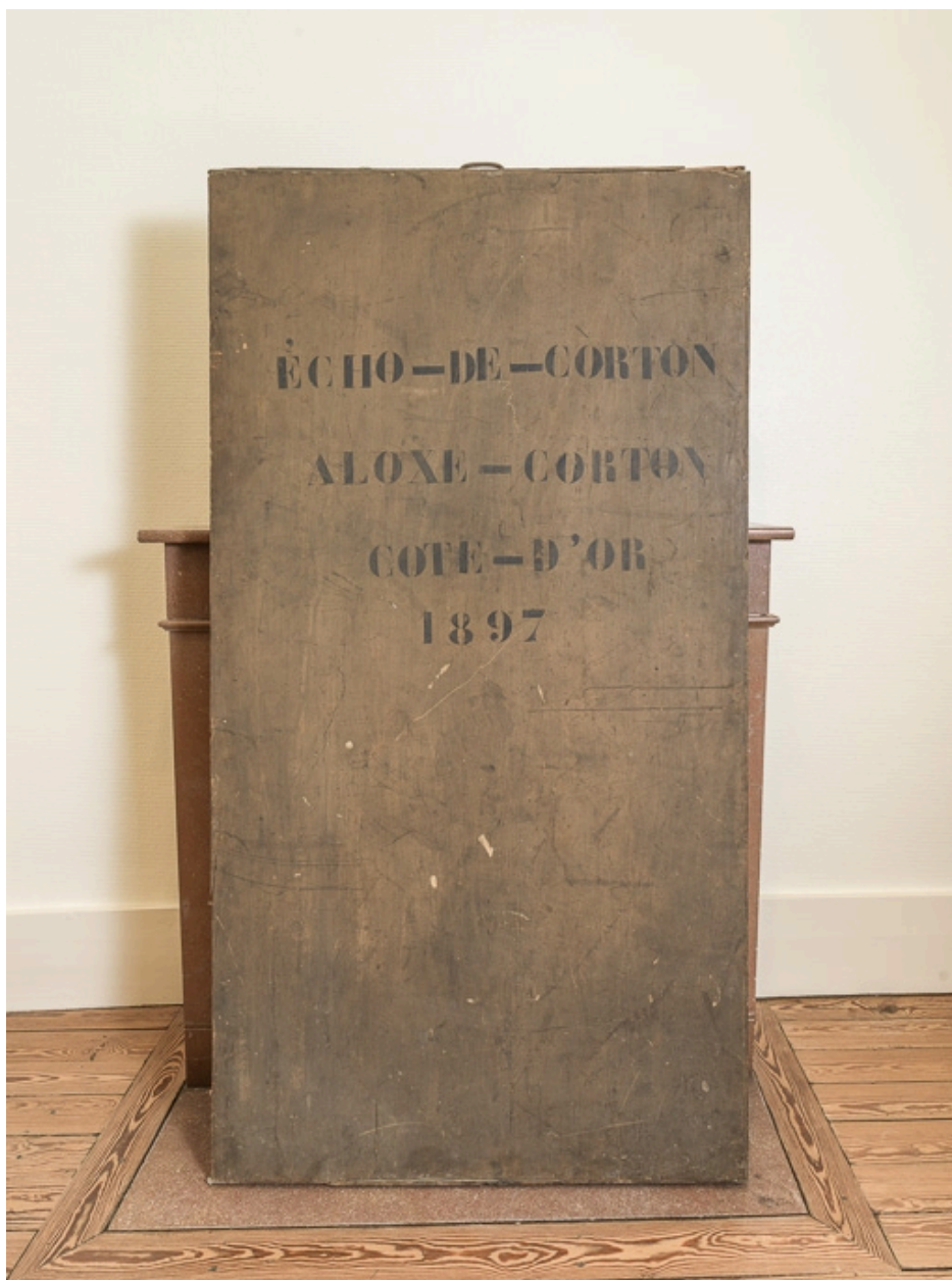
Bannière de la chorale d'Aloxe-Corton, conservée à la mairie.