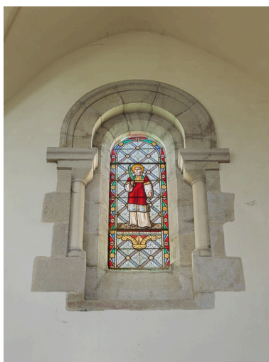
Verrière de saint Vincent.

IVR26_20162100369NUC2A