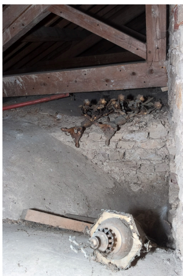
Objets mobiliers déposés dans les combles.