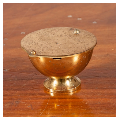
Navette. IVR26_20162100344NUC2A