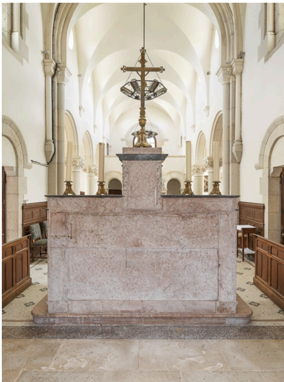
Autel, vue depuis le chœur.