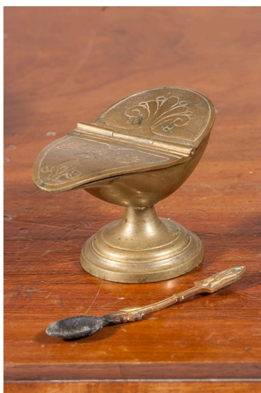
Navette. IVR26_20162100343NUC2A