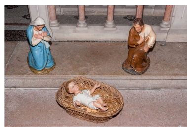
Personnages de crèche : Jésus, Marie et Joseph.