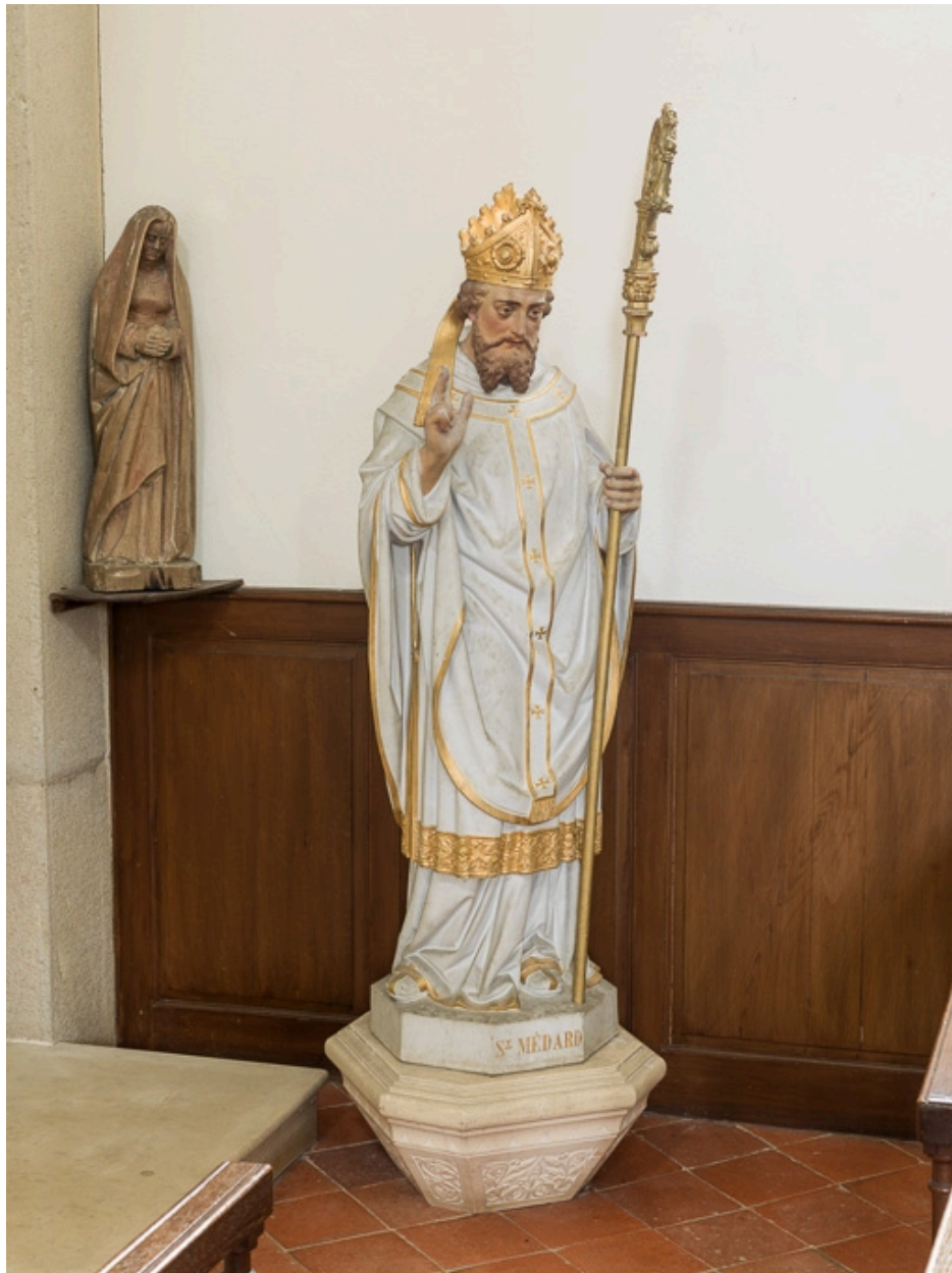
Statue de saint Médard.