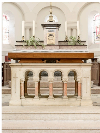
Autel et chœur. IVR26_20162100352NUC2A