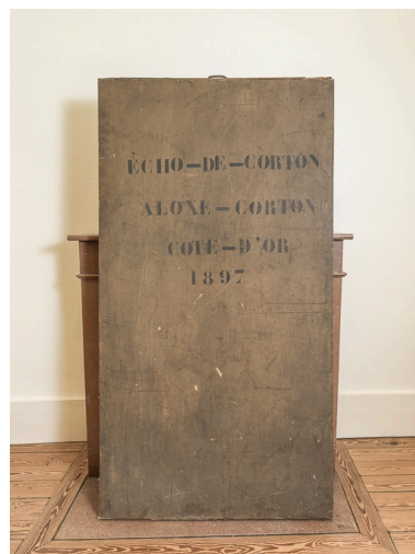
Bannière de la chorale d'Aloxe-Corton, conservée à la mairie.

Phot. Pierre-Marie Barbe-Richaud IVR26_20162100371NUC2A