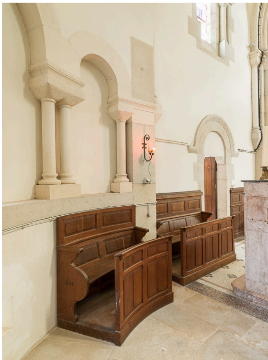
Stalles du choeur.