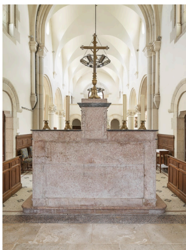
Autel, vue depuis le chœur.