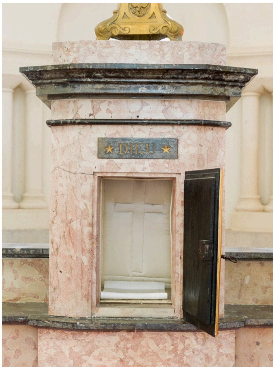
Tabernacle du maître-autel.