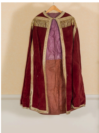
Chape rouge.