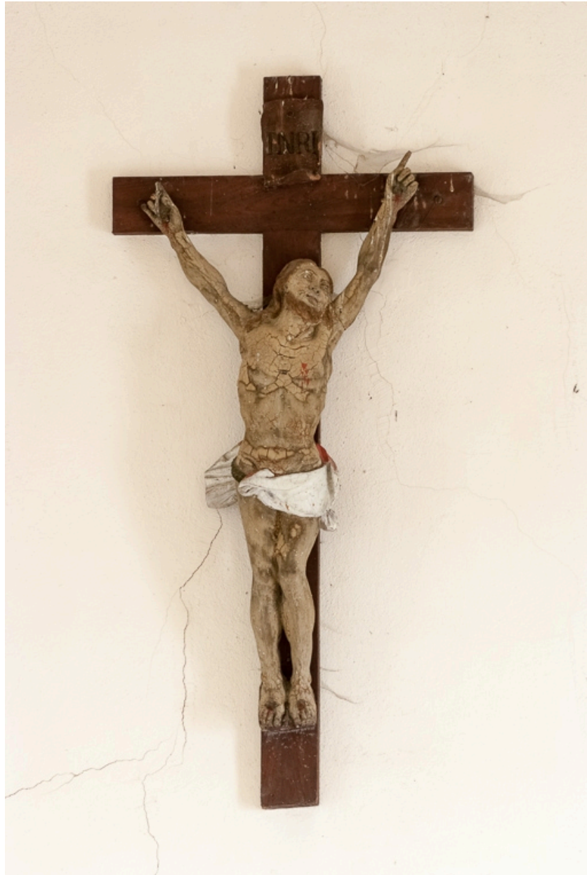
Vue d'ensemble : Christ en croix.