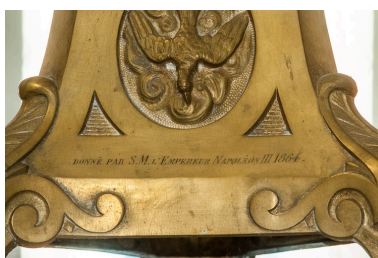
Détail de l'inscription du don de Naopléon III sur la croix d'autel. IVR26_20162100345NUC2A