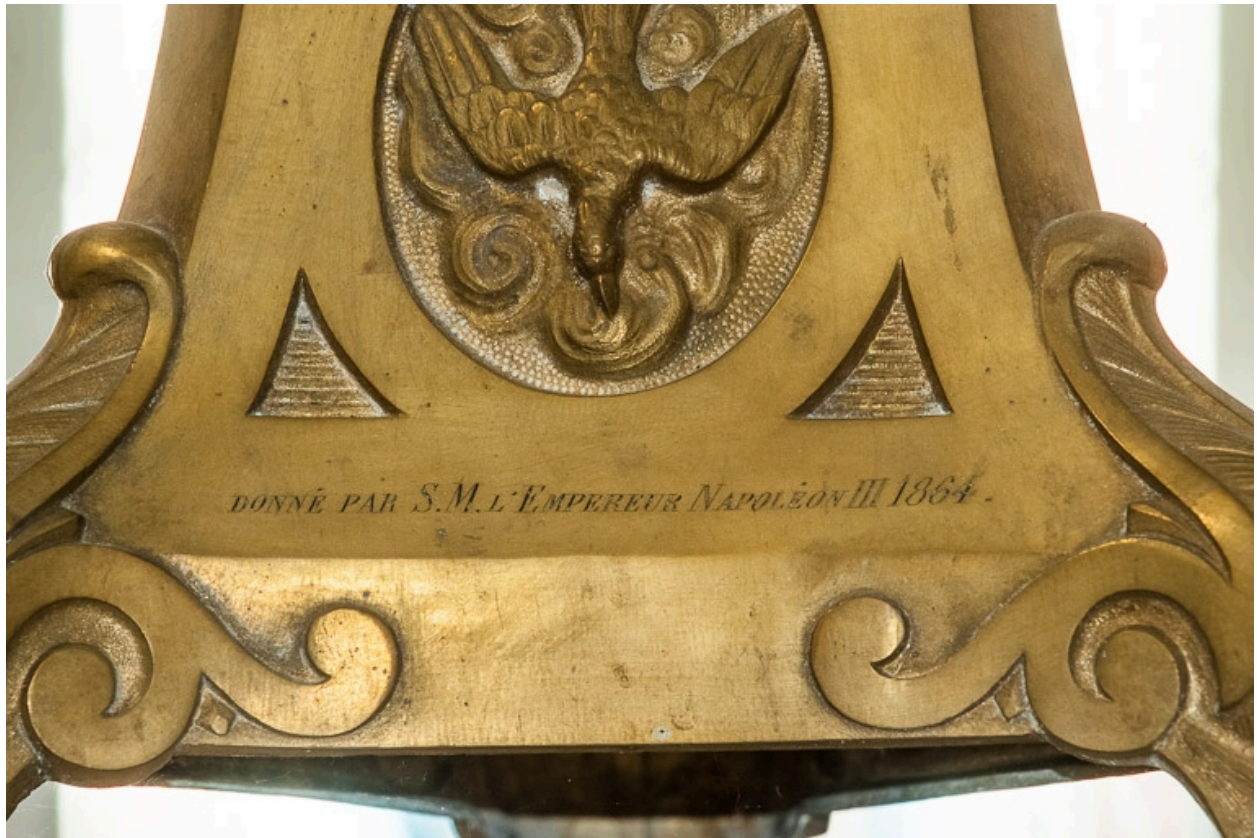
Détail de l'inscription du don de Naopléon III sur la croix d'autel.