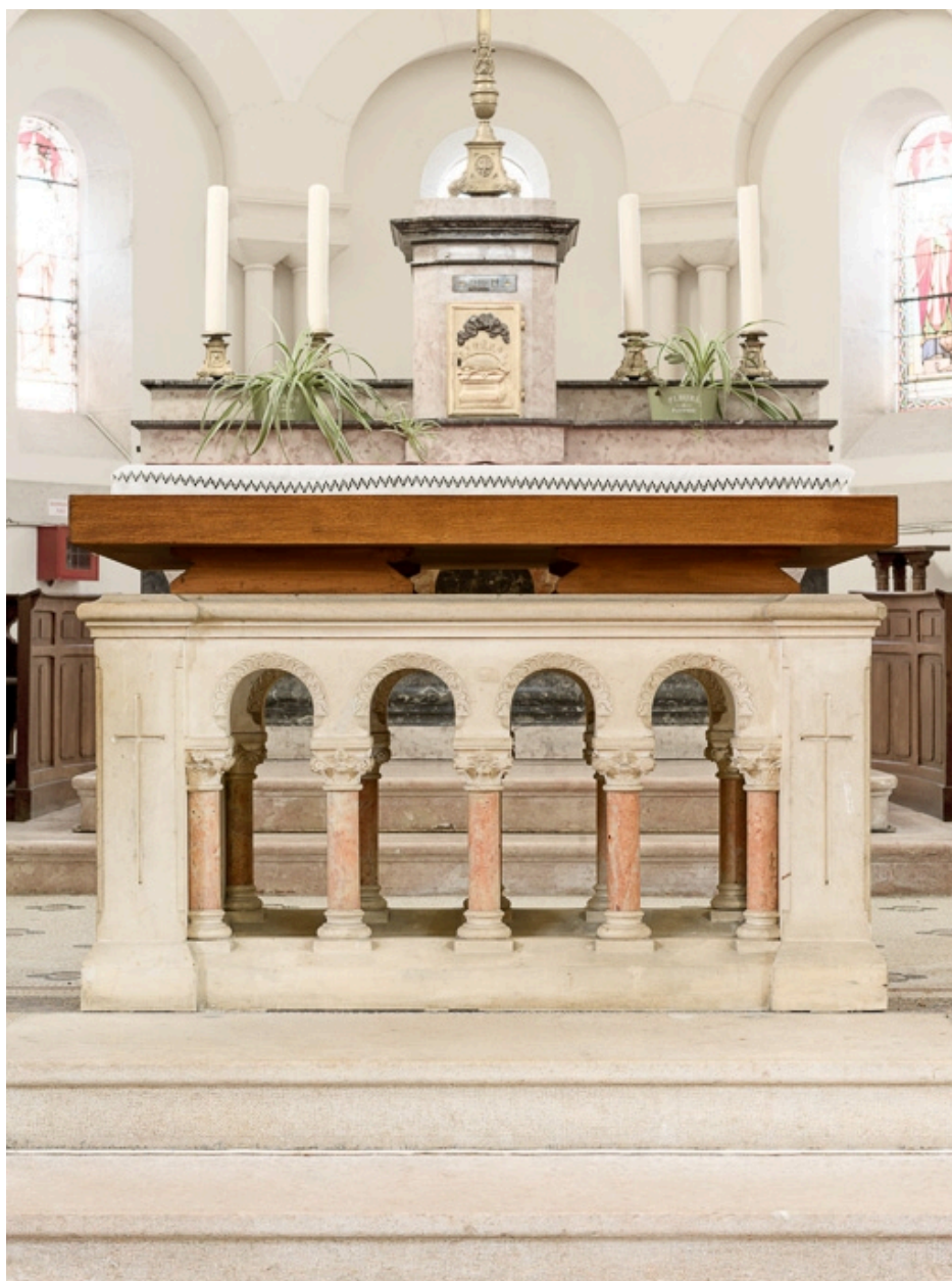
Autel et chœur.