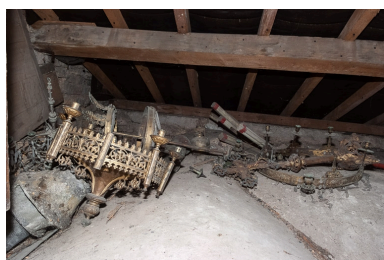
Objets mobiliers déposés dans les combles.