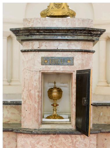
Tabernacle du maître-autel. IVR26_20162100354NUC2A