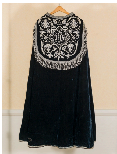
Chape noire. IVR26_20162100359NUC2A