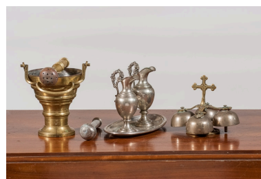
Seau à eau bénite, plateau et burettes et sonnette d'autel. IVR26_20162100341NUC2A