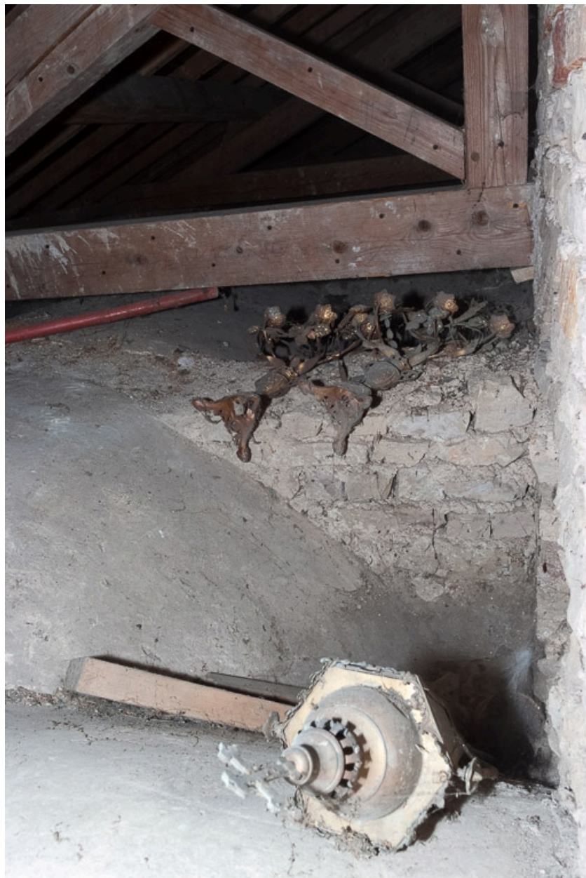
Objets mobiliers déposés dans les combles.