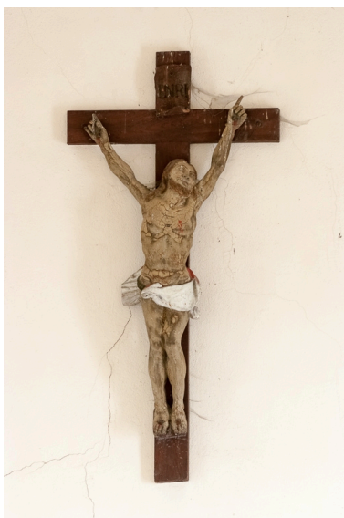
Vue d'ensemble : Christ en croix. IVR26_20162100362NUC2A