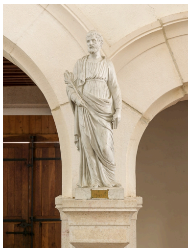
Statue. IVR26_20162100318NUC2A