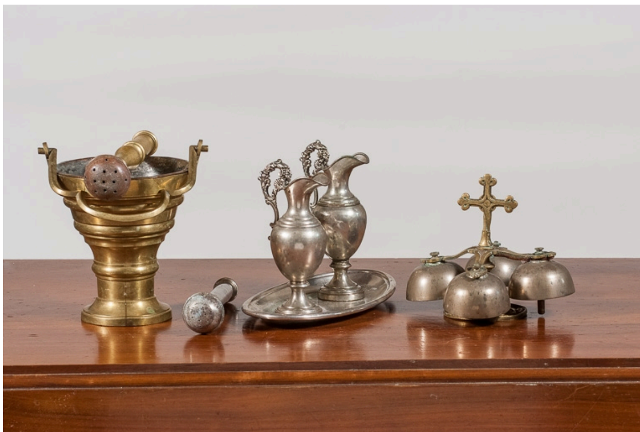
Seau à eau bénite, plateau et burettes et sonnette d'autel.