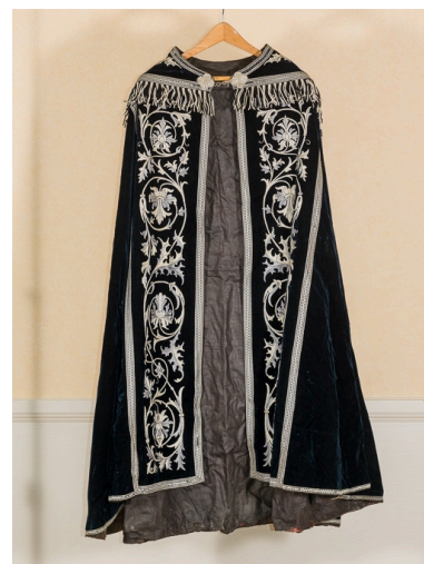
Chape noire. IVR26_20162100358NUC2A