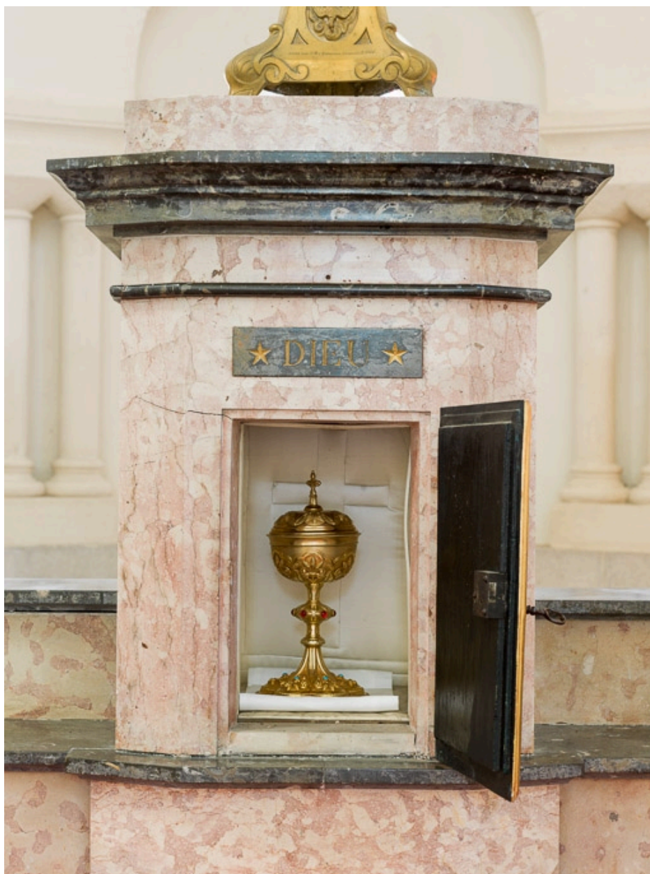
Tabernacle du maître-autel.