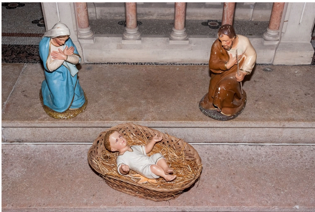
Personnages de crèche : Jésus, Marie et Joseph.