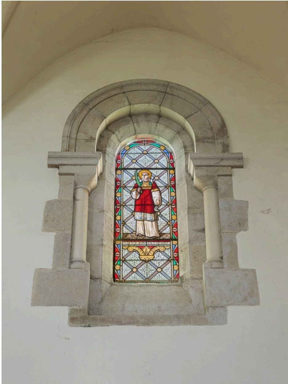
Verrière de saint Vincent.