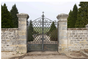
Vue du portail. IVR43_20112502931NUC4A