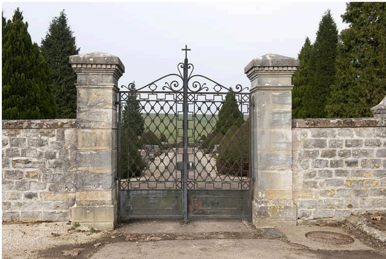
Vue du portail.