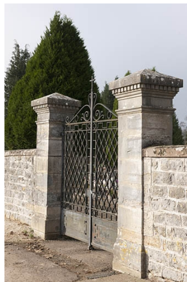
Le portail, vu de trois quarts droit. IVR43_20112502933NUC4A