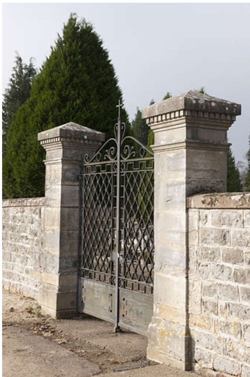
Le portail, vu de trois quarts droit.