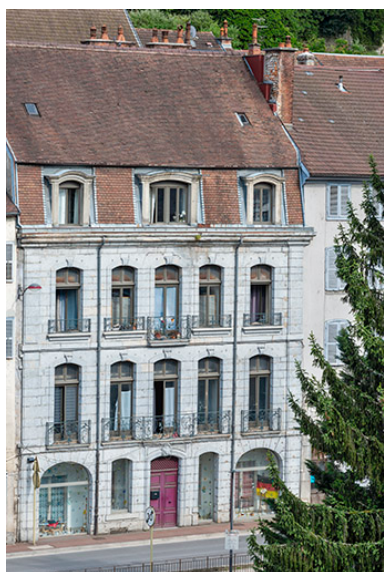
Vue d'ensemble depuis le nord-ouest. IVR43_20233900865NUC4A