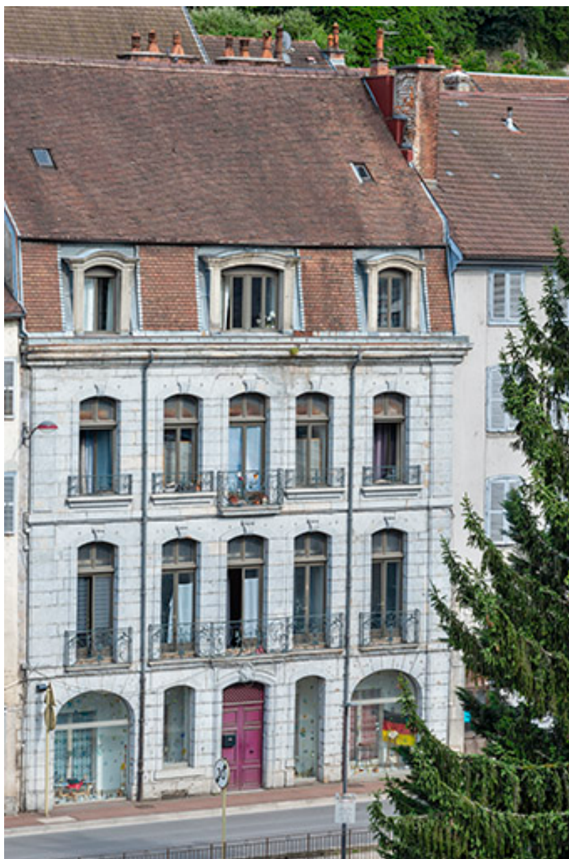
Vue d'ensemble depuis le nord-ouest.