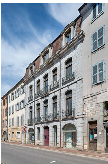
Vue de trois quarts droite. IVR43_20233900862NUC4A