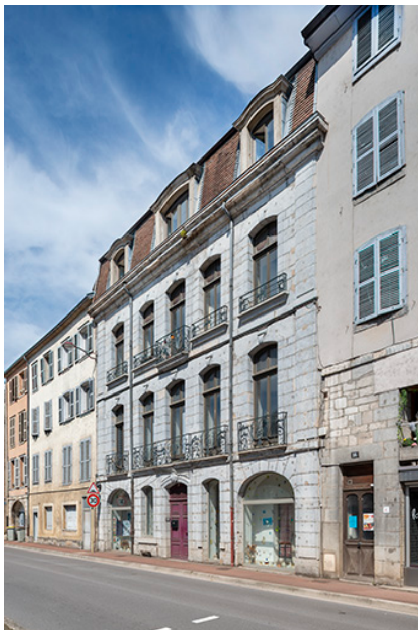
Vue de trois quarts droite.