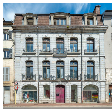
Façade antérieure. IVR43_20233900863NUC4A