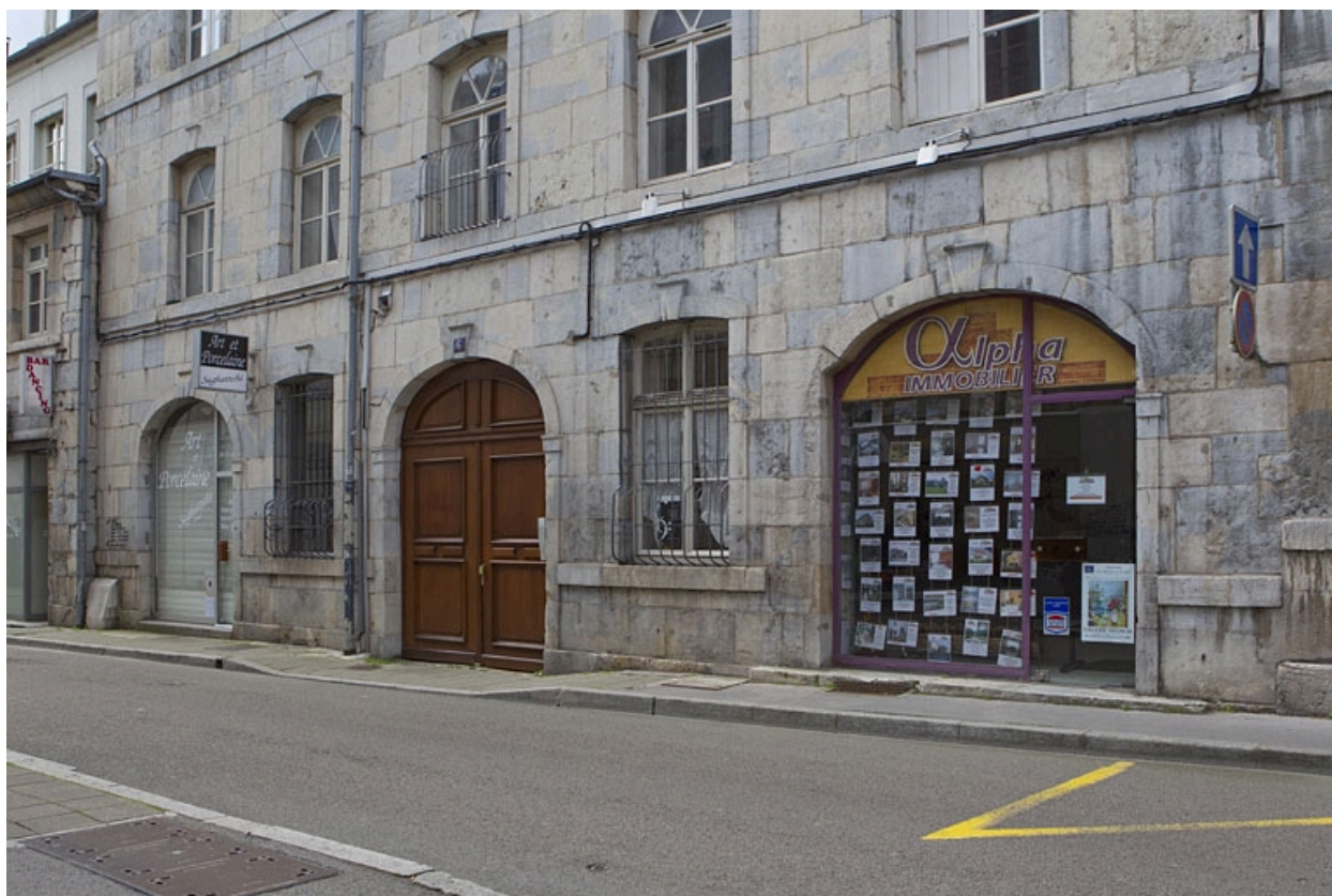
Détail du rez-de-chaussée de la façade sur rue du logis principal, de trois quarts droit.