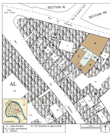
Plan masse et de situation. Extrait du plan cadastral, 1974, section AL.