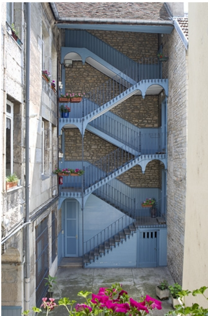
Vue d'ensemble de l'escalier à cage ouverte à gauche de la cour.