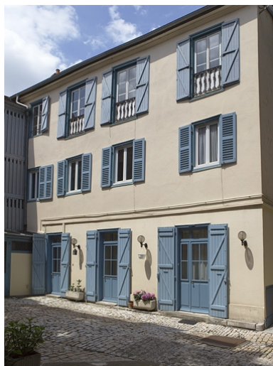
Vue d'ensemble du logis secondaire droit.

Phot. Yves Sancey IVR43_20102500759NUC2A