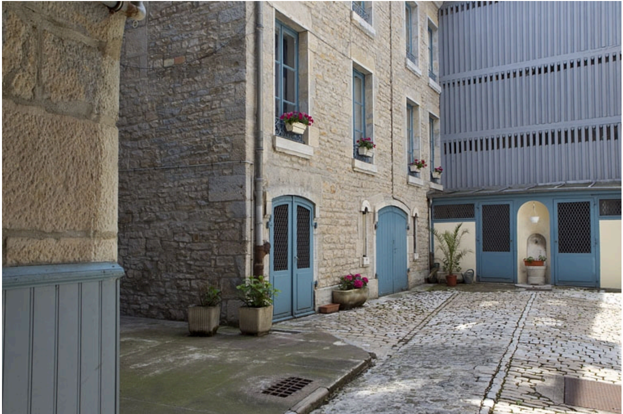
Détail du rez-de-chaussée du logis secondaire gauche.