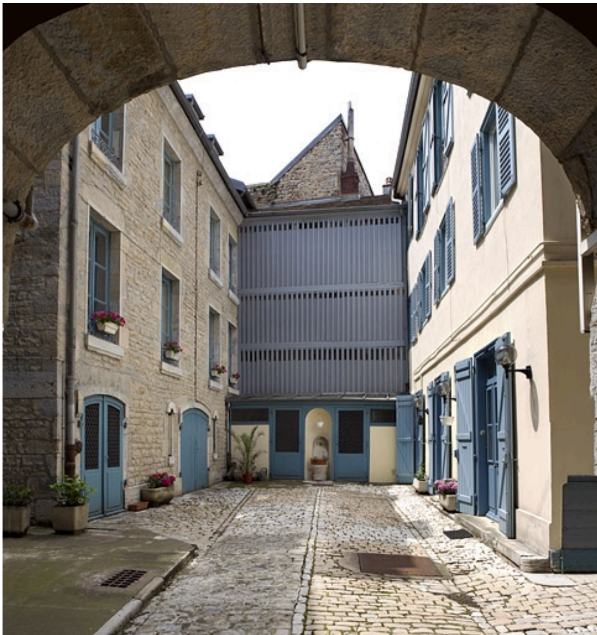
Vue d'ensemble de la cour depuis le portail d'entrée.