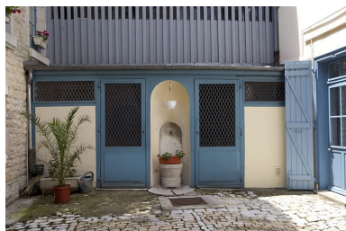
Détail de la borne fontaine et du rez-de-chaussée du séchoir. IVR43_20102500757NUC2A