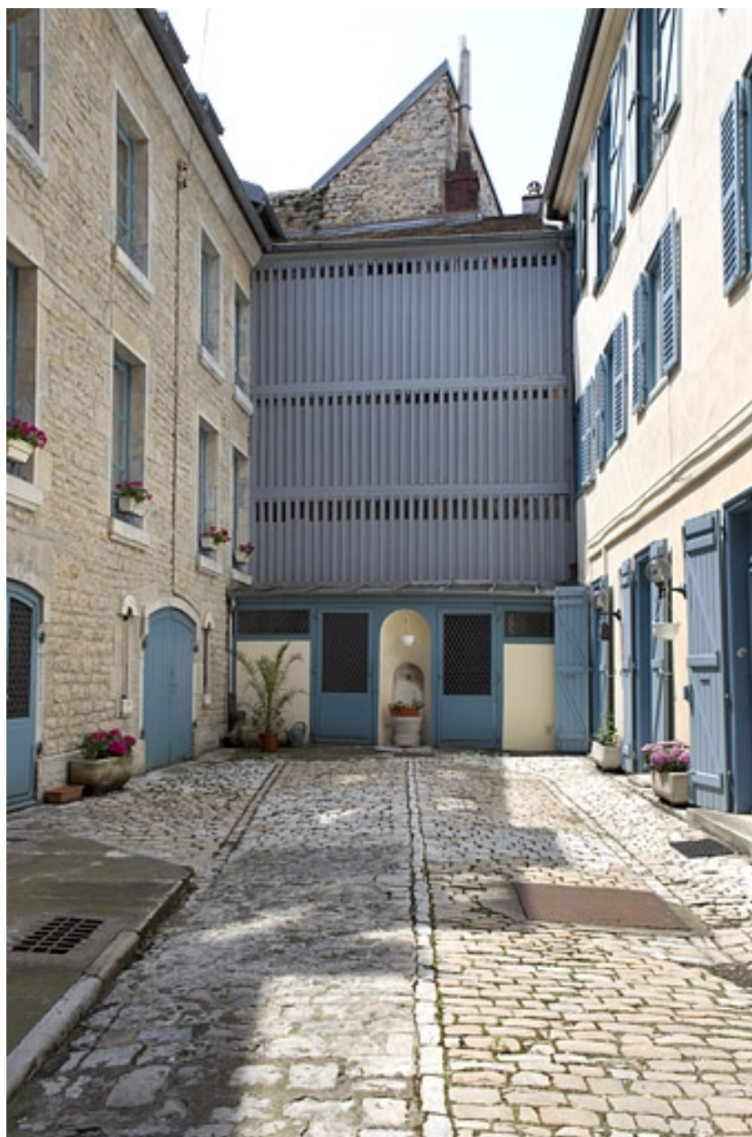
Vue d'ensemble du séchoir au fond de la cour.