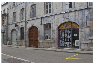
Détail du rez-de-chaussée de la façade sur rue du logis principal, de trois quarts droit.

IVR43_20102500751NUC2A