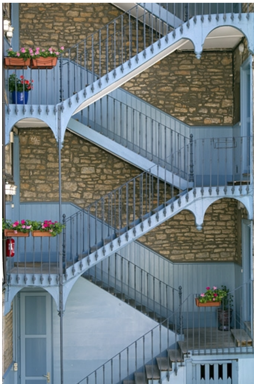
Détail de l'escalier à cage ouverte à gauche de la cour.