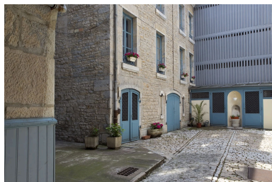
Détail du rez-de-chaussée du logis secondaire gauche. IVR43_20102500758NUC2A