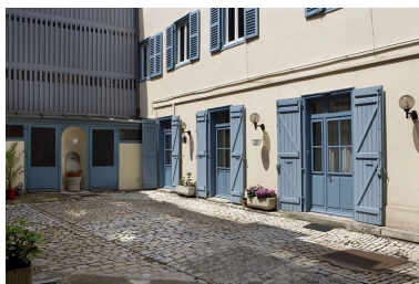
Détail du rez-de-chaussée du logis secondaire droit et d'une partie du séchoir.

IVR43_20102500760NUC2A