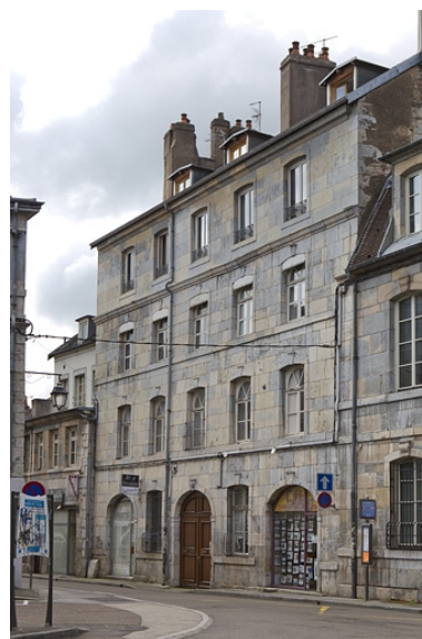
Vue d'ensemble de la façade sur rue du logis principal, de trois quarts droit.