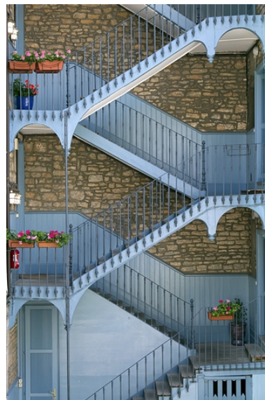
Détail de l'escalier à cage ouverte à gauche de la cour.