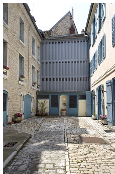
Vue d'ensemble du séchoir au fond de la cour.

IVR43_20102500749NUC2A