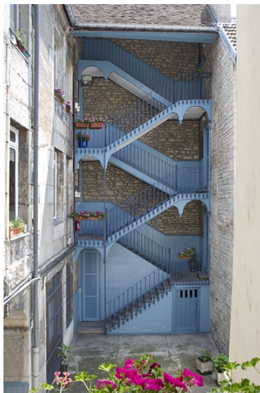
Vue d'ensemble de l'escalier à cage ouverte à gauche de la cour. IVR43_20102500756NUC2A