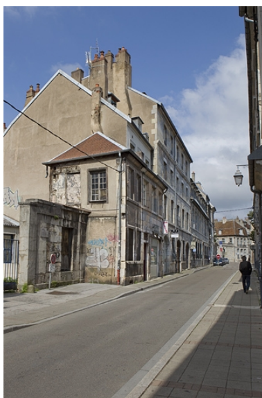
Vue d'ensemble éloignée du logis principal dans l'alignement de la rue, de trois quarts gauche.