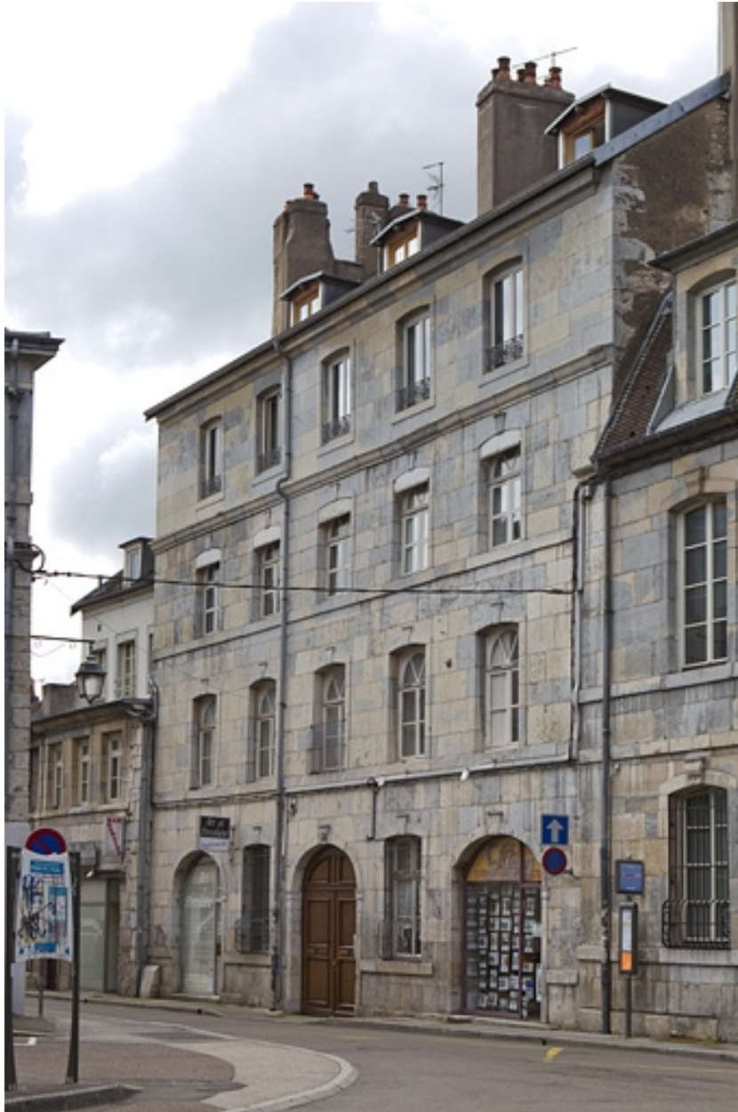
Vue d'ensemble de la façade sur rue du logis principal, de trois quarts droit.