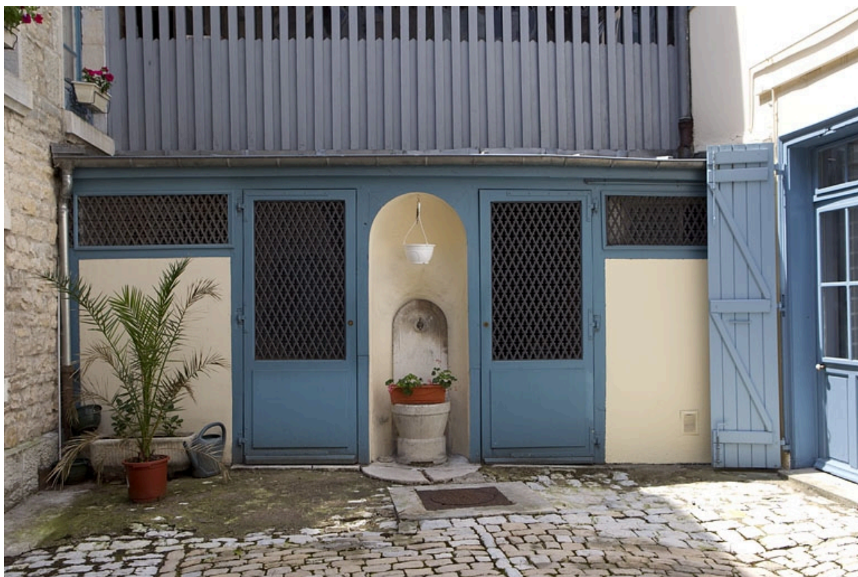
Détail de la borne fontaine et du rez-de-chaussée du séchoir.