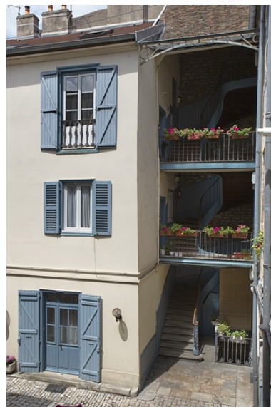
Vue d'ensemble de l'escalier à cage ouverte à droite de la cour.

Phot. Yves Sancey IVR43_20102500753NUC2A