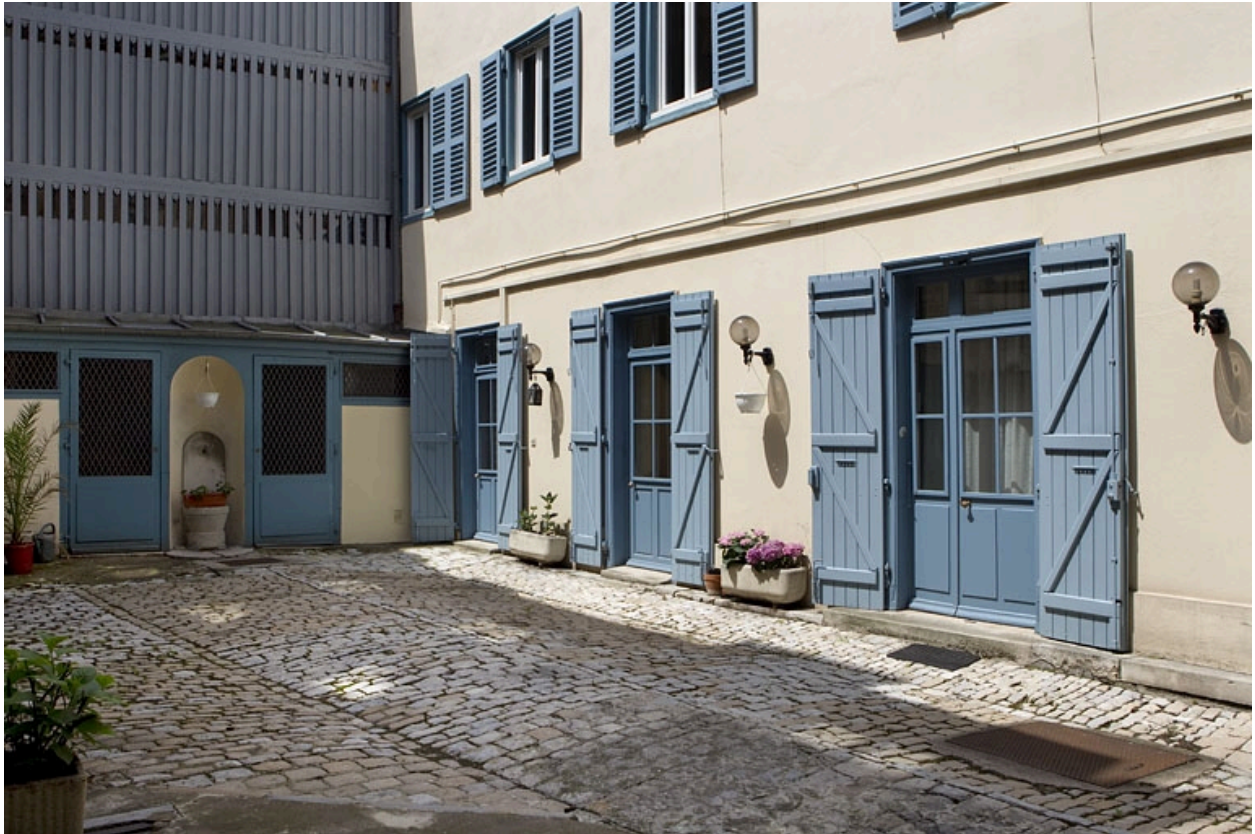
Détail du rez-de-chaussée du logis secondaire droit et d'une partie du séchoir.