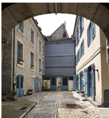
Vue d'ensemble de la cour depuis le portail d'entrée.

Phot. Yves Sancey IVR43_20102500751NUC2A