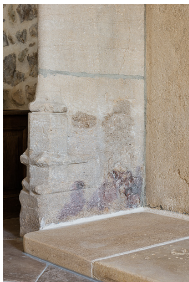
Détail de la cheminée : piédroit avec bases à moulures prismatiques