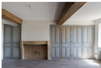
Une des chambres de l'étage avec sa cheminée (XVIII e siècle) et une série de placards, aménagée au début du XX e siècle IVR26_20197100262NUC4A