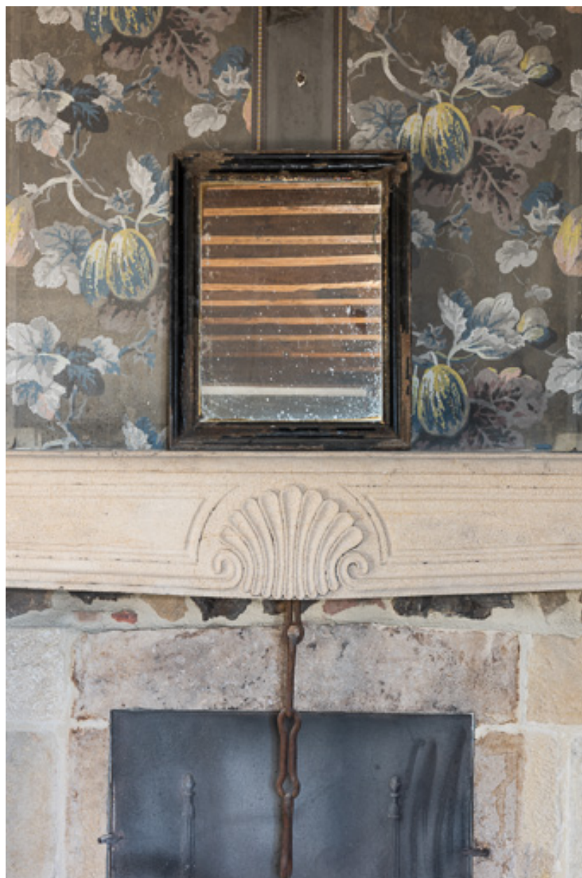
Détail du linteau de la cheminée du salon avec un décor de coquille