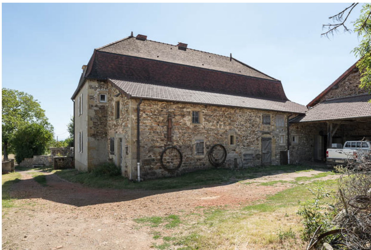
Vue de la façade postérieure de la demeure, avec son appentis