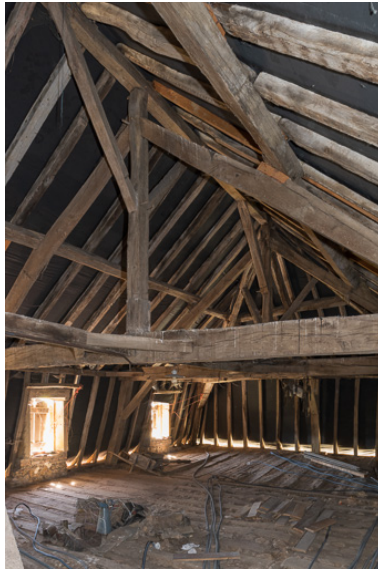
Vue de la charpente de toit brisé de la demeure