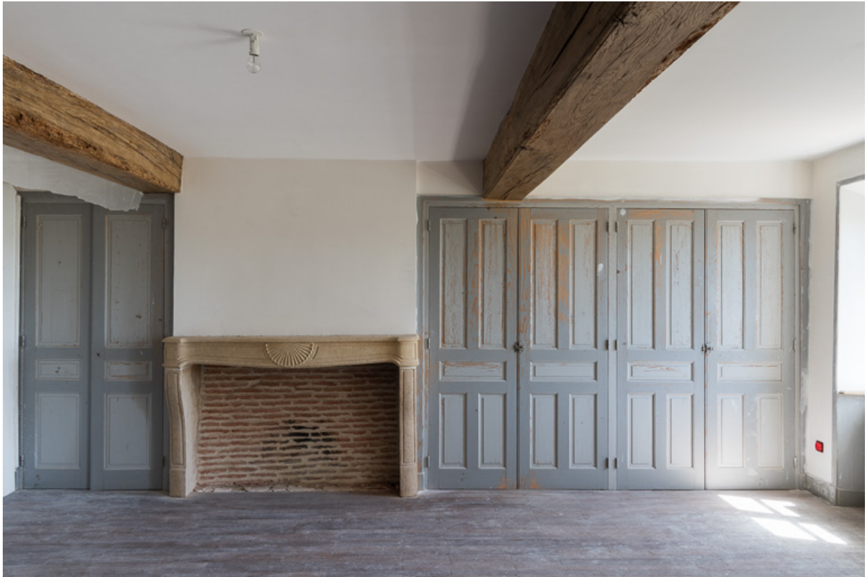
Une des chambres de l'étage avec sa cheminée (XVIII e siècle) et une série de placards, aménagée au début du XX e siècle