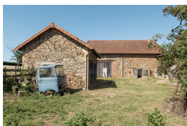
Vue des dépendances composées d'une petite remise, au premier plan, et d'une grange, à l'arrière.