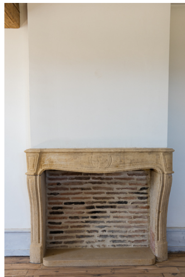
Cheminée d'une des chambres à l'étage IVR26_20197100260NUC4A