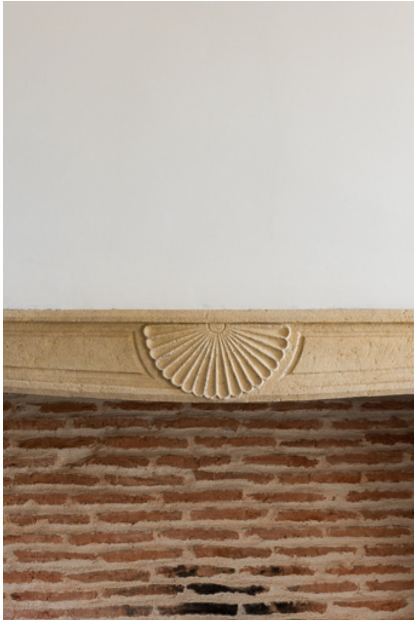
Linteau de la cheminée avec un décor de coquille