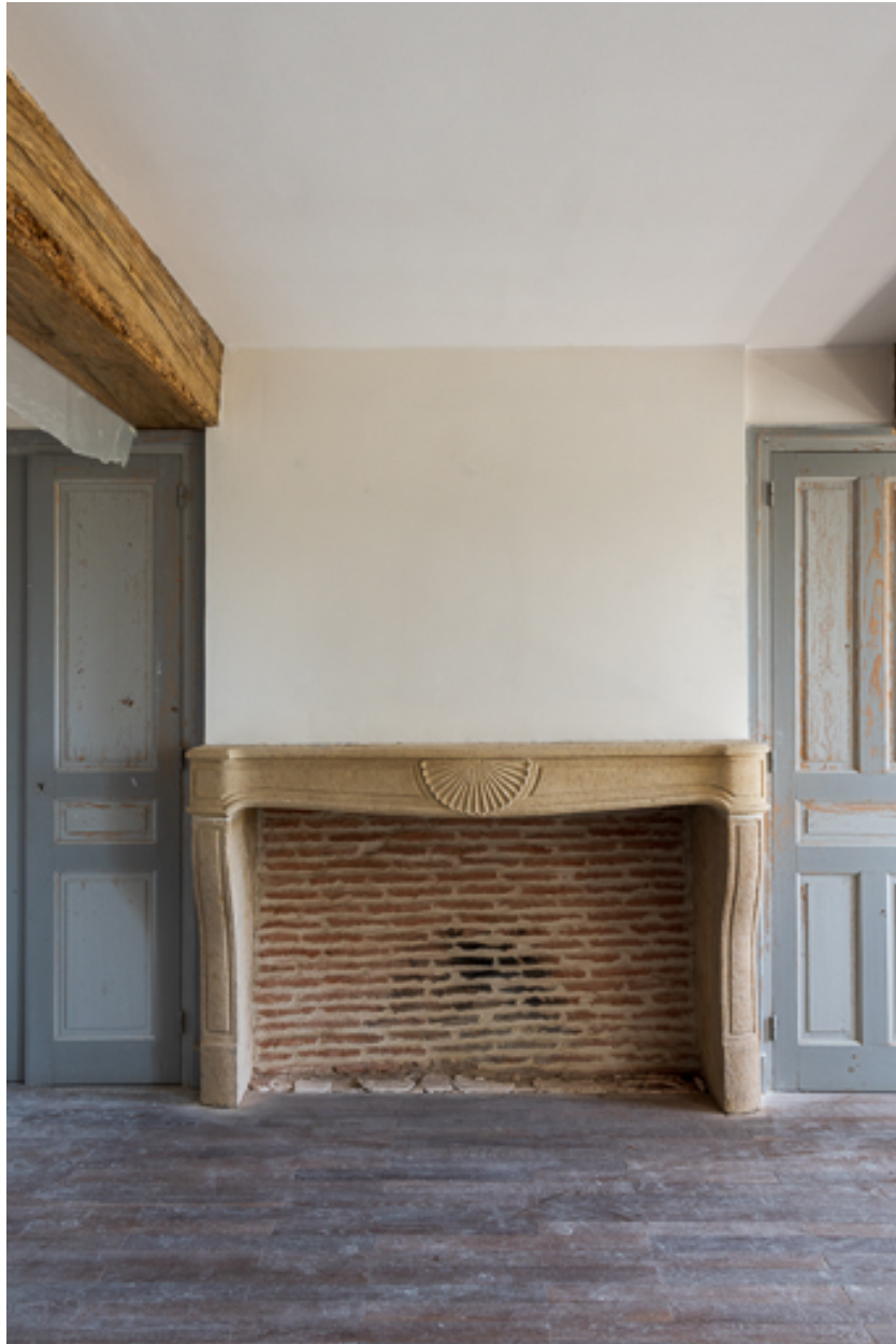
Cheminée de cette chambre