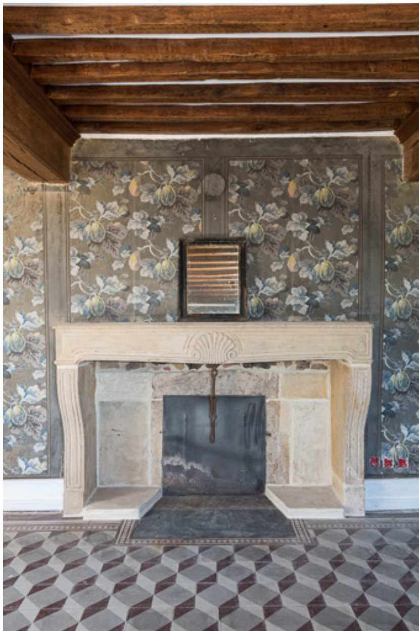
Cheminée du salon, à droite de l'escalier