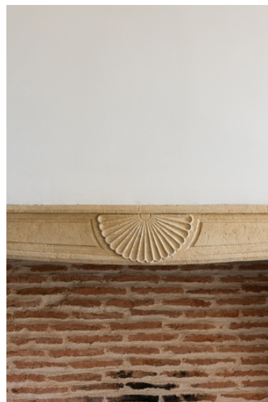
Linteau de la cheminée avec un décor de coquille IVR26_20197100264NUC4A