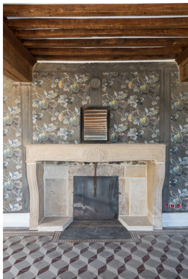
Cheminée du salon, à droite de l'escalier IVR26_20197100265NUC4A