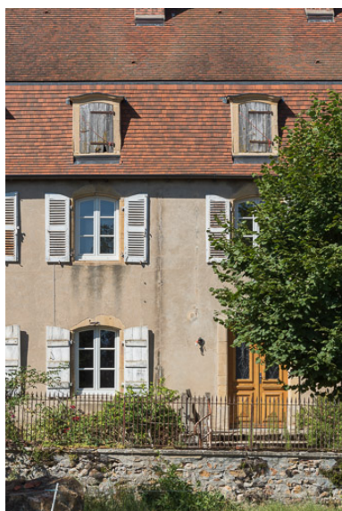
Détail de la façade antérieure de la demeure : baies en arc fragmentaire, orné d'une agrafe, et lucarnes