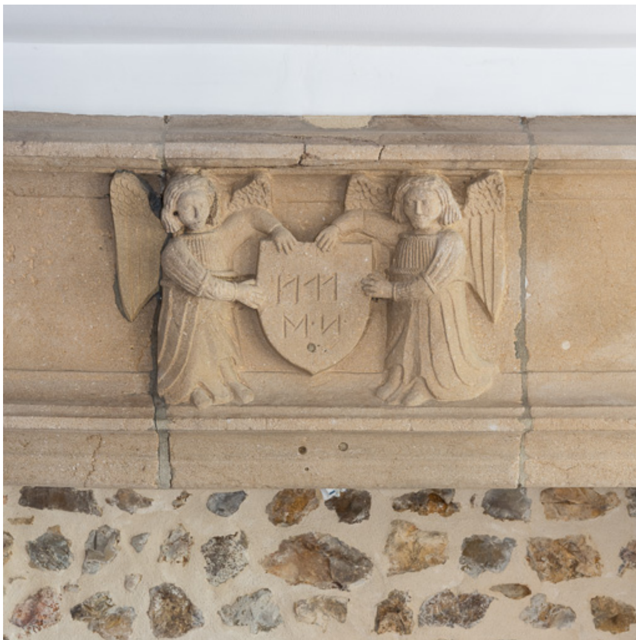
Détail de la cheminée, blason porté par deux anges