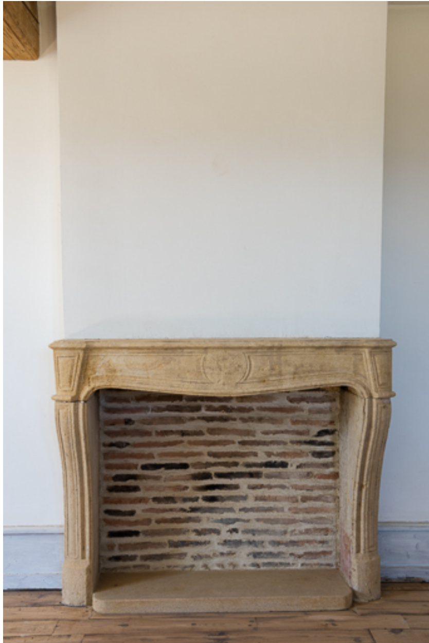
Cheminée d'une des chambres à l'étage