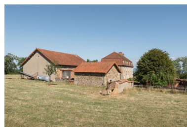
Vue d'ensemble des bâtiments du domaine IVR26_20197100280NUC4A