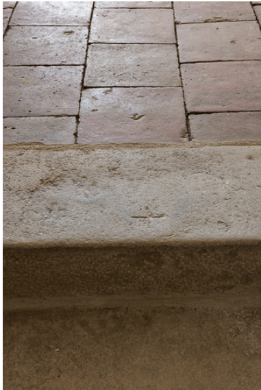
Détail de l'escalier : Marche et palier couvert de carreaux de carrelage en terre cuite IVR26_20197100261NUC4A