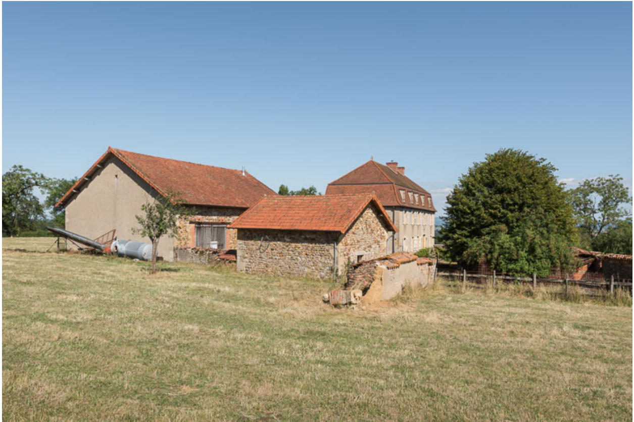
Vue d'ensemble des bâtiments du domaine