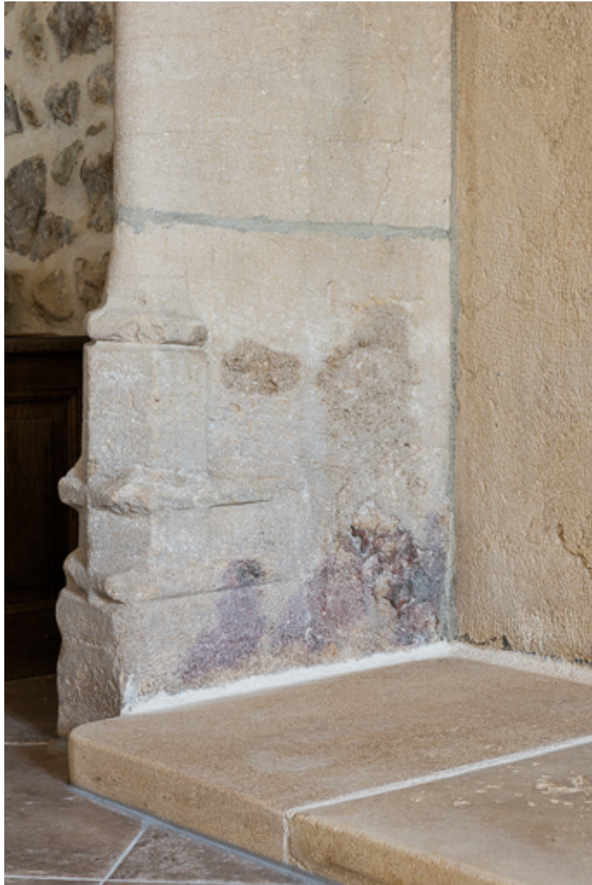
Détail de la cheminée : piédroit avec bases à moulures prismatiques