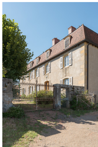
Vue de la façade antérieure de la demeure au sud IVR26_20197100278NUC4A