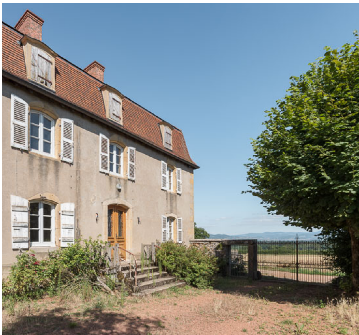
Vue d'une partie de la façade antérieure de la demeure à l'ouest