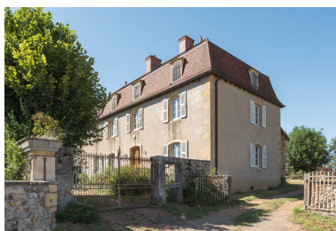
Vue de la demeure des Sertines IVR26_20197100279NUC4A