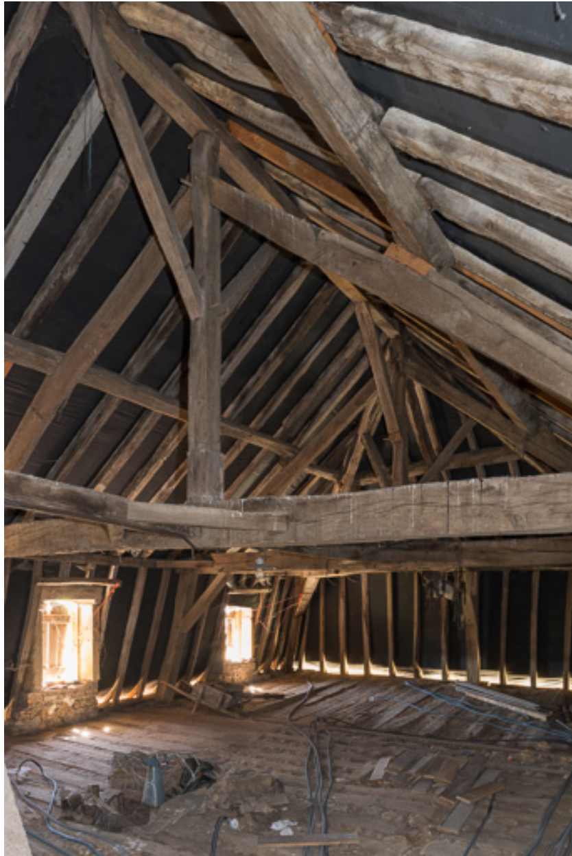
Vue de la charpente de toit brisé de la demeure