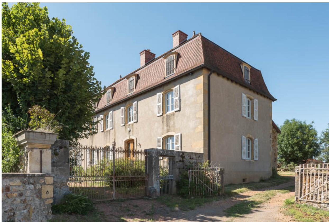
Vue de la demeure des Sertines