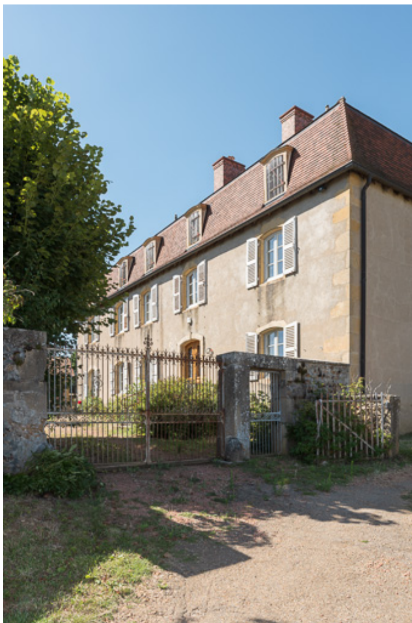
Vue de la façade antérieure de la demeure au sud