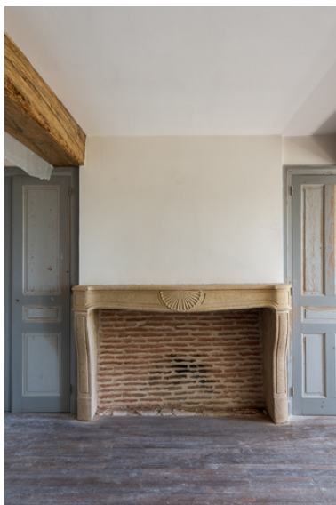
Cheminée de cette chambre IVR26_20197100263NUC4A