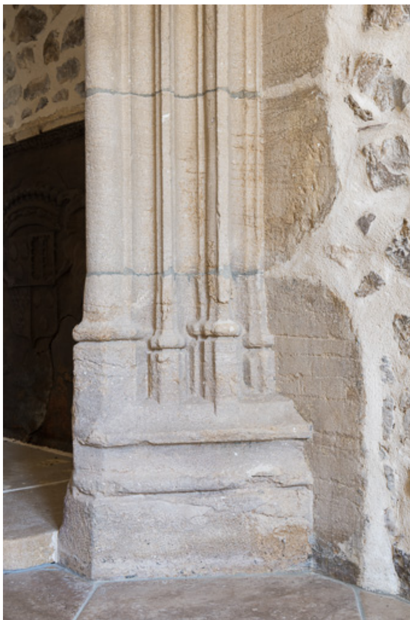
Détail de la cheminée : piédroit avec bases à moulures prismatiques