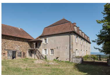
Vue de la demeure et d'une partie de la grange, depuis l'ouest. Les deux bâtiments sont partiellement accolés, au niveau de