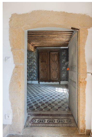
Porte en arc fragmentaire, donnant accès à un salon, à droite de l'escalier de la demeure IVR26_20197100267NUC4A