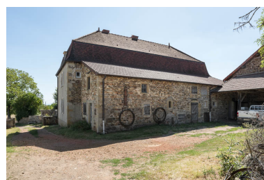
Vue de la façade postérieure de la demeure, avec son appentis IVR26_20197100274NUC4A