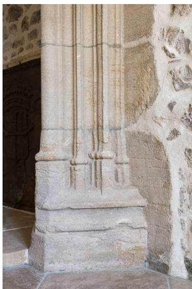
Détail de la cheminée : piédroit avec bases à moulures prismatiques IVR26_20197100272NUC4A