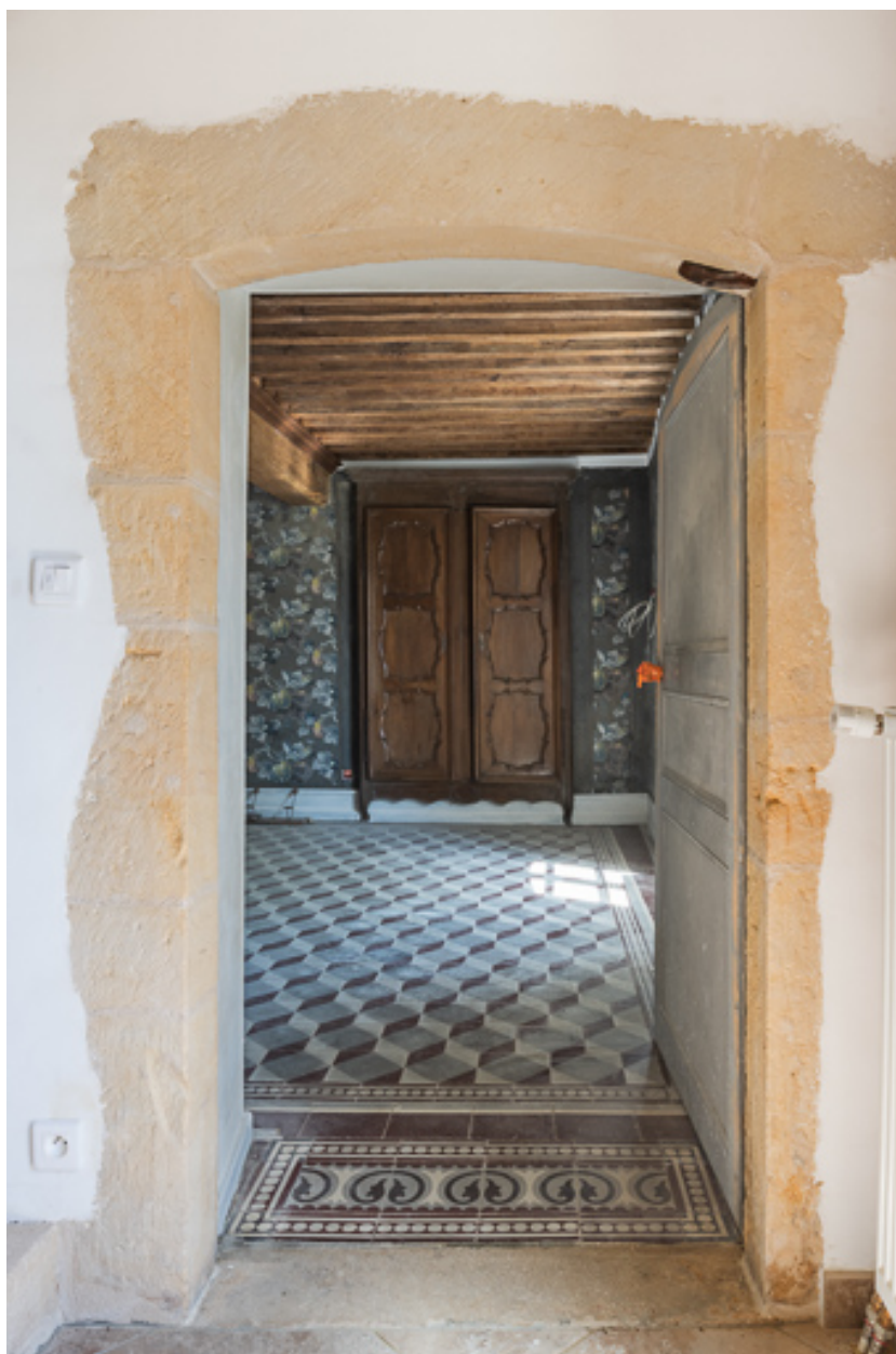
Porte en arc fragmentaire, donnant accès à un salon, à droite de l'escalier de la demeure