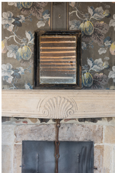
Détail du linteau de la cheminée du salon avec un décor de coquille