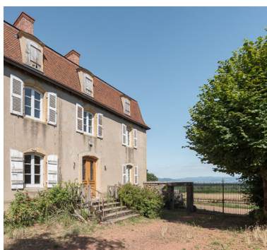
Vue d'une partie de la façade antérieure de la demeure à l'ouest IVR26_20197100277NUC4A