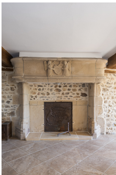
Cheminée de la salle principale de la demeure. Cette cheminée, caractéristique du XVe siècle, est un remploi et provient vraisemblablement de l'ancien château de l'Etoile. IVR26_20197100269NUC4A