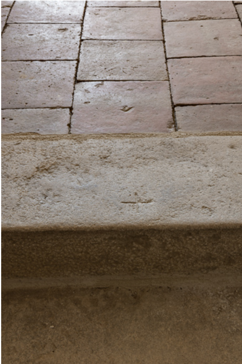
Détail de l'escalier : Marche et palier couvert de carreaux de carrelage en terre cuite