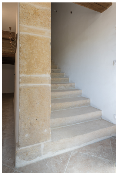
Vue de l'escalier rampe sur rampe de la demeure IVR26_20197100268NUC4A

l'angle sud-est de la grange et de l'appentis, à l'arrière de la maison. IVR26_20197100275NUC4A