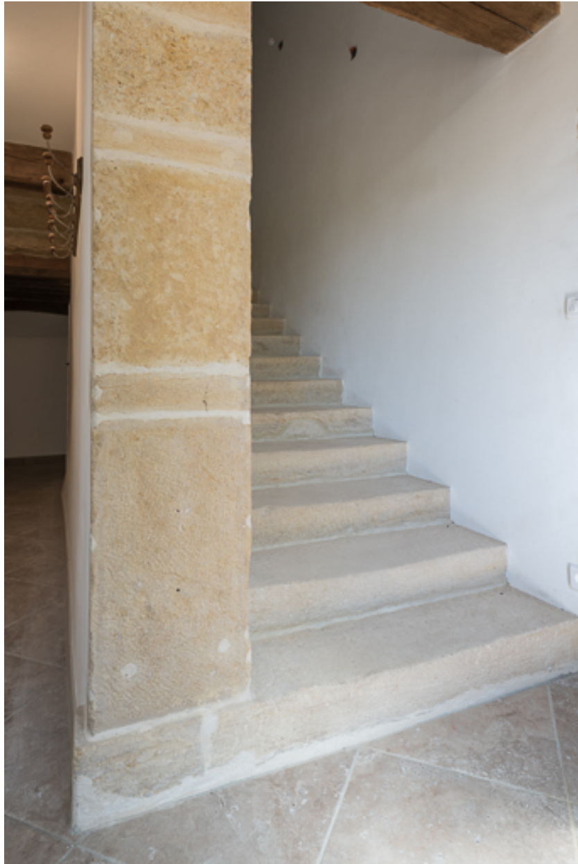
Vue de l'escalier rampe sur rampe de la demeure