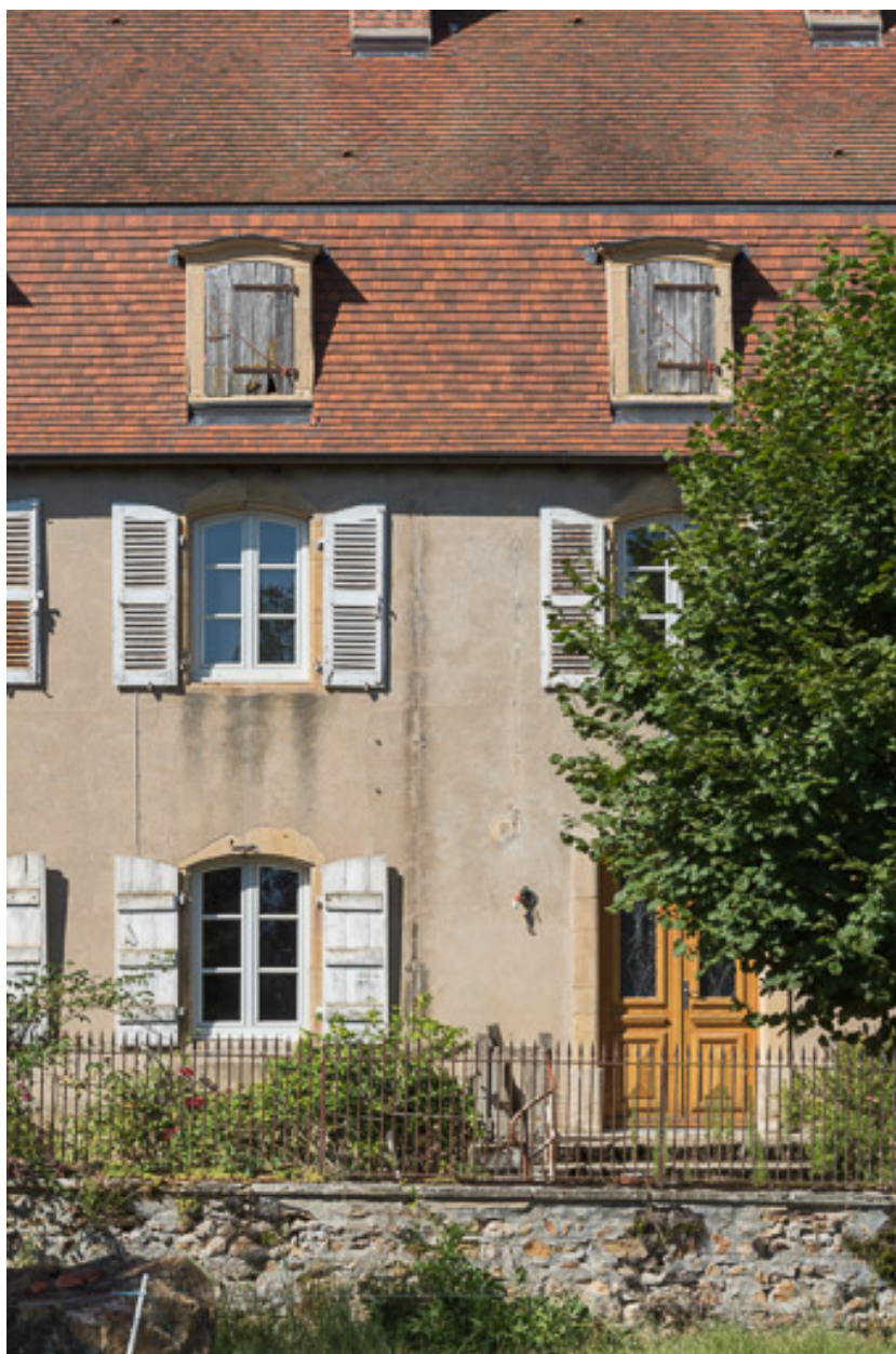
Détail de la façade antérieure de la demeure : baies en arc fragmentaire, orné d'une agrafe, et lucarnes