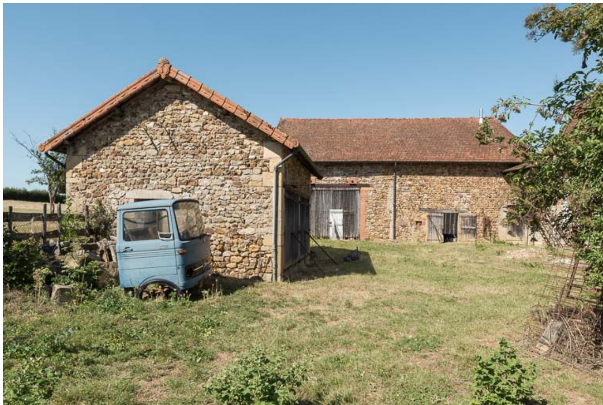
Vue des dépendances composées d'une petite remise, au premier plan, et d'une grange, à l'arrière.