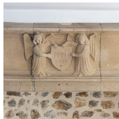
Détail de la cheminée, blason porté par deux anges IVR26_20197100271NUC4A