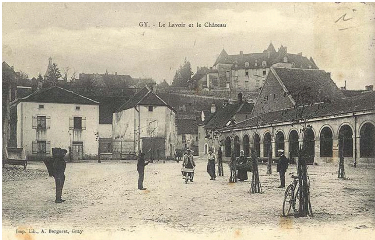
La Place de la République et le lavoir sur une carte postale ancienne