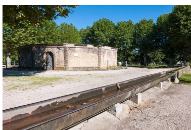
Le lavoir de la place du Lavoir