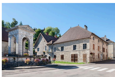
La fontaine