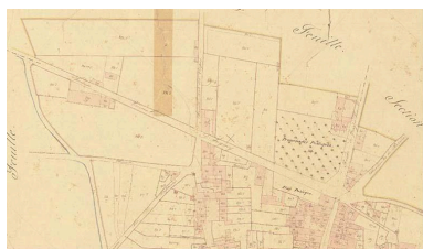
Emplacement de l'hôtel de ville sur le cadastre napoléonien (1837) IVR43_20137000880NUC2A