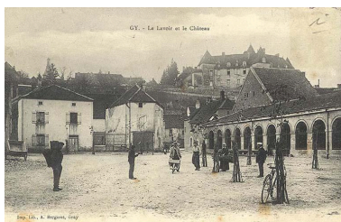
La Place de la République et le lavoir sur une carte postale ancienne IVR43_20137000770NUC2A