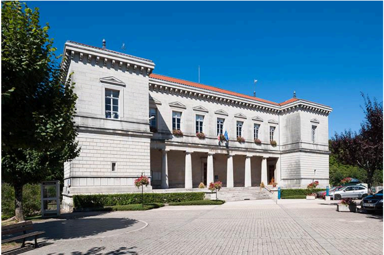
L'hôtel de ville