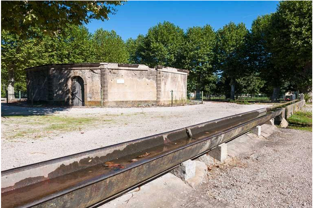
Le lavoir de la place du Lavoir