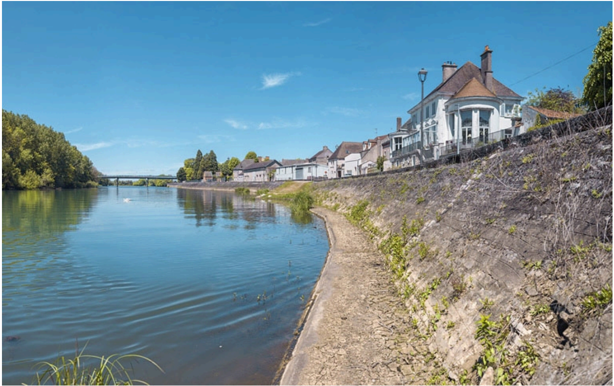
Quais en aval du pont routier.