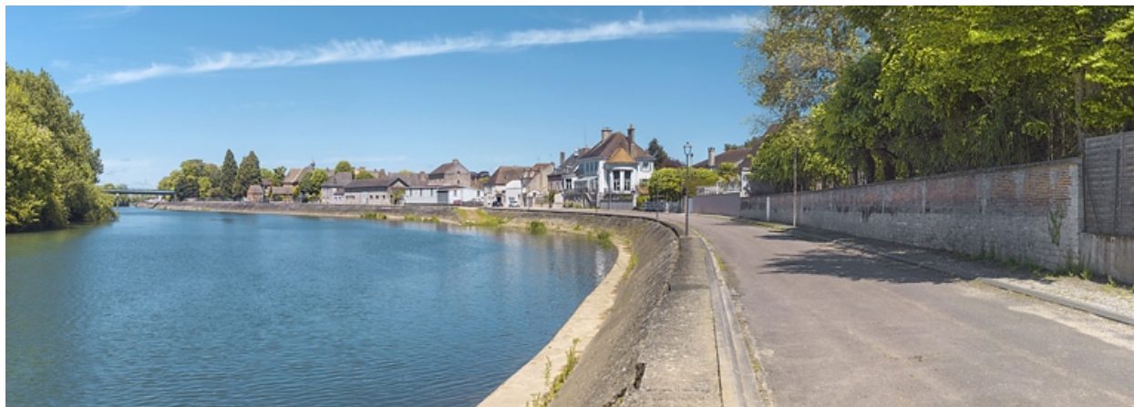
Panorama des quais en aval du pont.