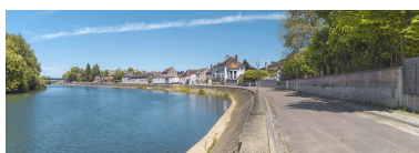
Panorama des quais en aval du pont.