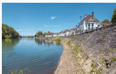
Quais en aval du pont routier. IVR26_20172100265NUC4A