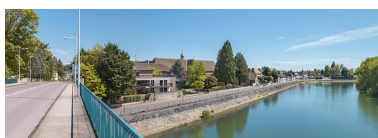
Vue des quais, en aval du pont routier de Seurre. On distingue les toits de l'hôtel-Dieu. IVR26_20172100262NUC4A