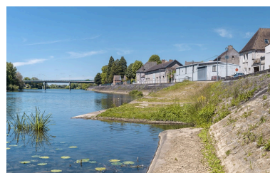
Les quais se poursuivent en aval du pont : rampe d'accès à la rivière. IVR26_20172100266NUC4A