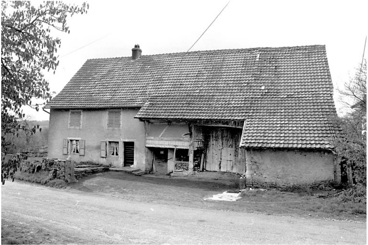
8e ferme : vue d'ensemble.