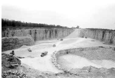
Carrière.