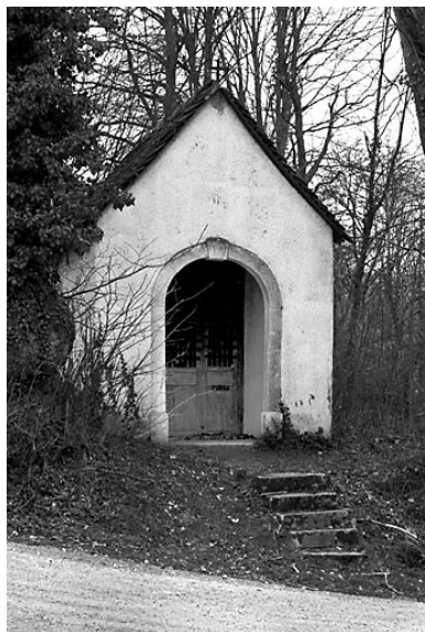
Oratoire : vue d'ensemble. IVR43_19829000319Z