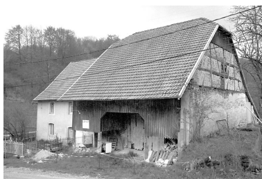
2e ferme : vue d'ensemble. IVR43_19829000313Z