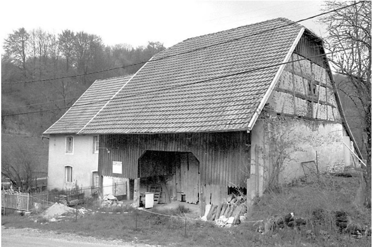
2e ferme : vue d'ensemble.