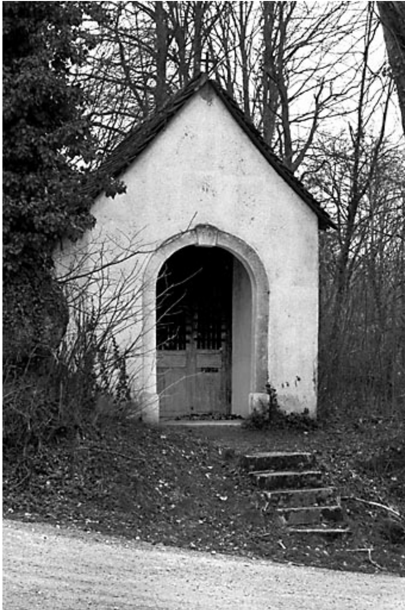
Oratoire : vue d'ensemble.