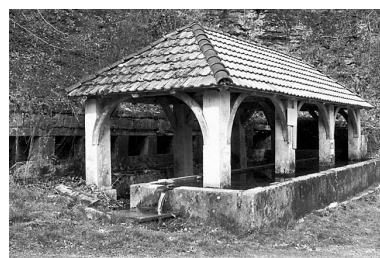
Fontaine-lavoir IVR43_19829000314Z