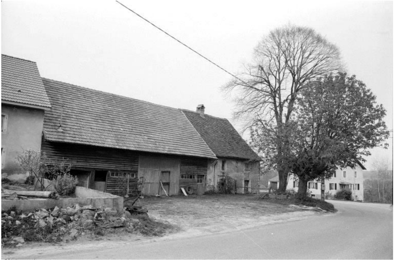
9e ferme : vue d'ensemble.