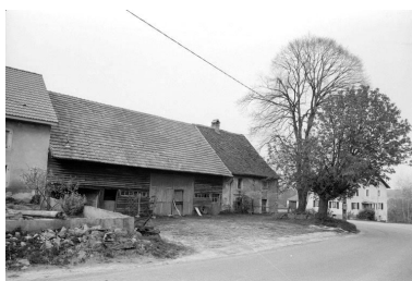
9e ferme : vue d'ensemble. IVR43_19829000307Z