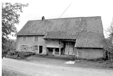
8e ferme : vue d'ensemble. IVR43_19829000304Z