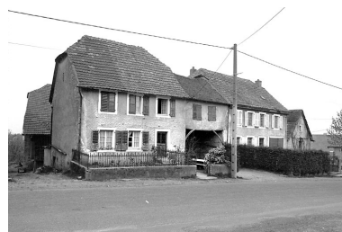
5e ferme : vue d'ensemble. IVR43_19829000300Z