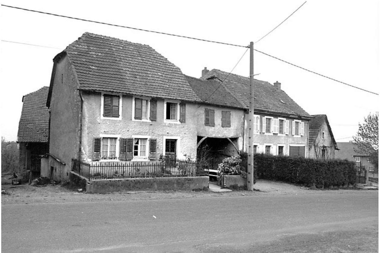
5e ferme : vue d'ensemble.