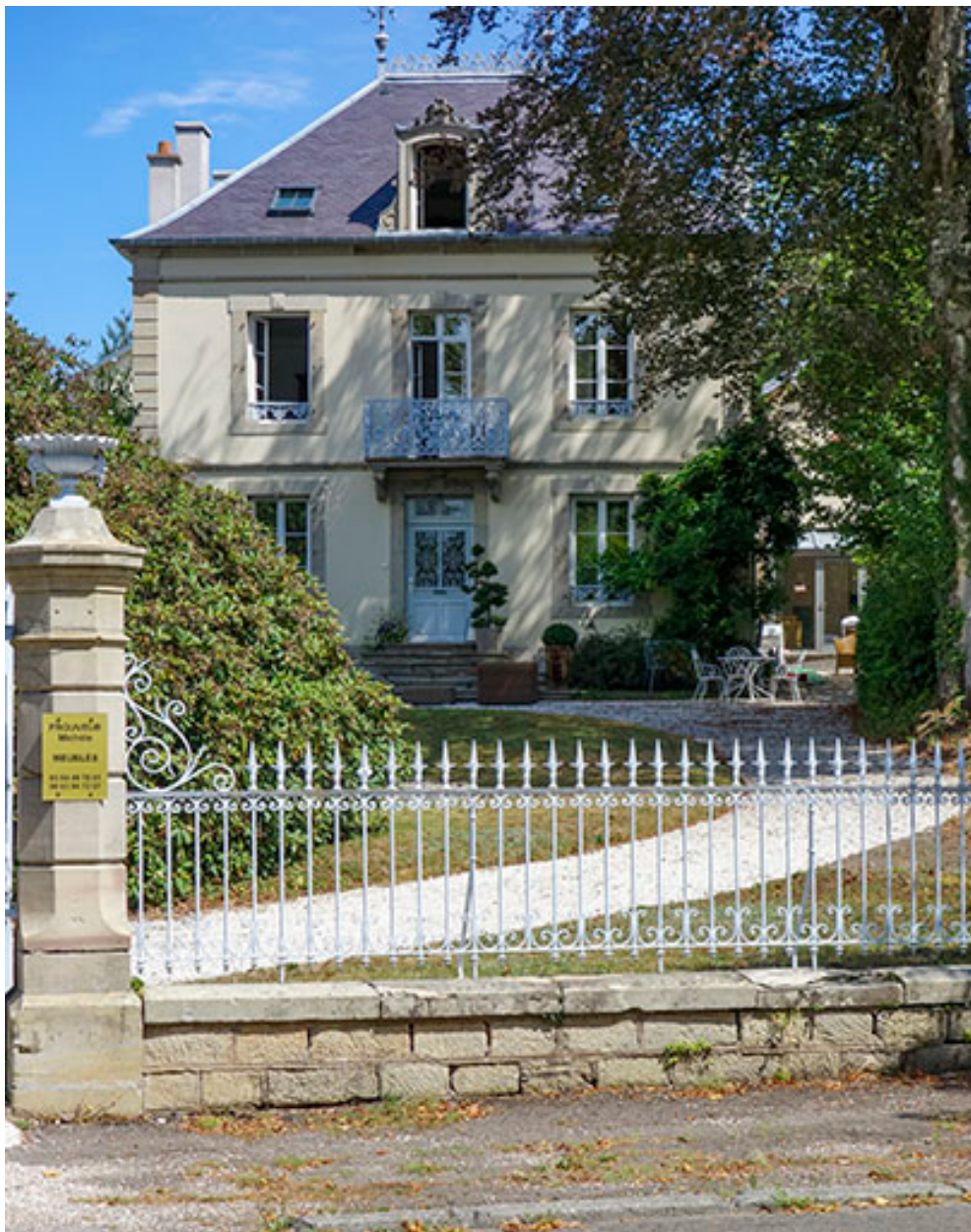
Vue depuis la rue.