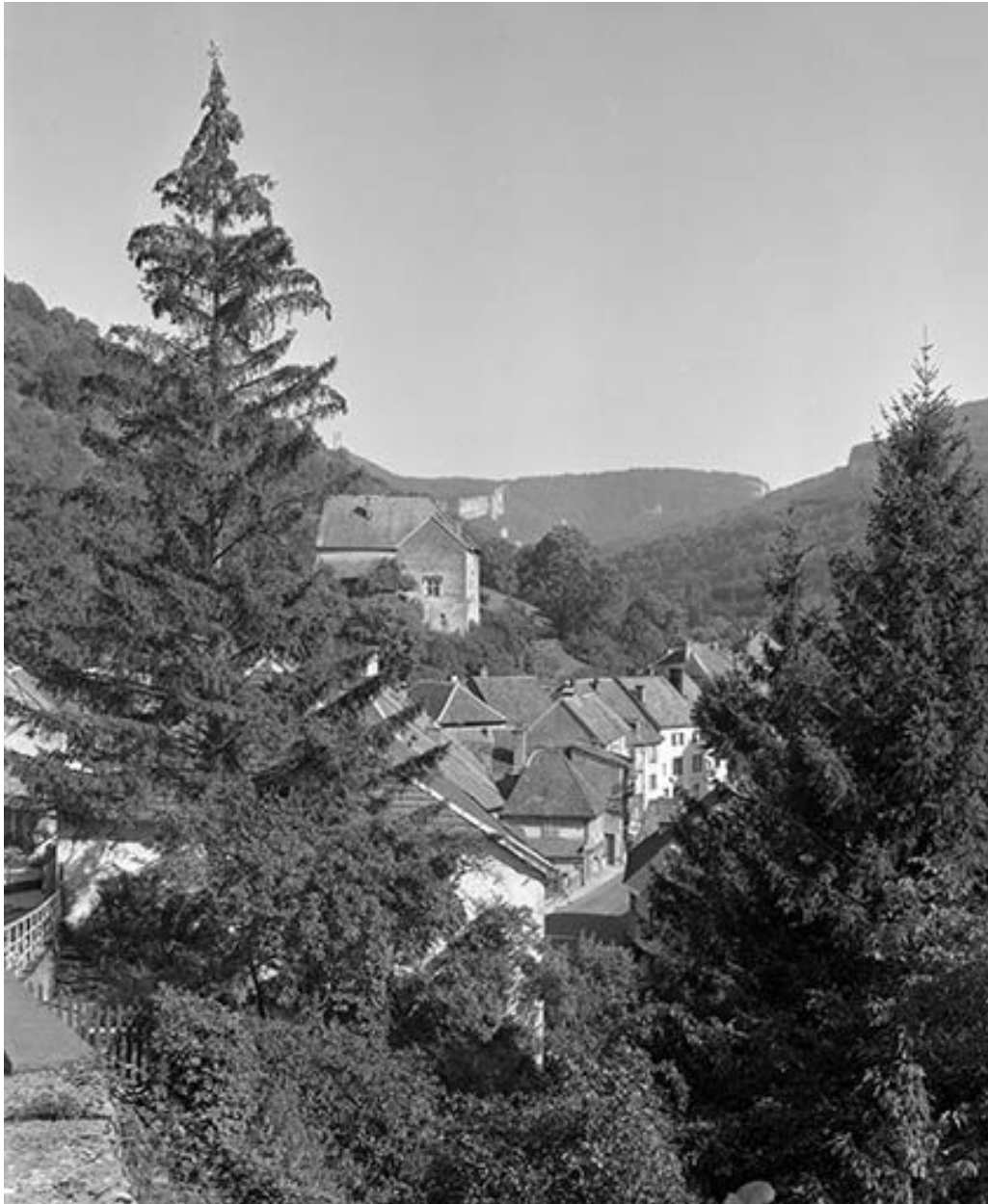
Vue générale depuis l'ouest.