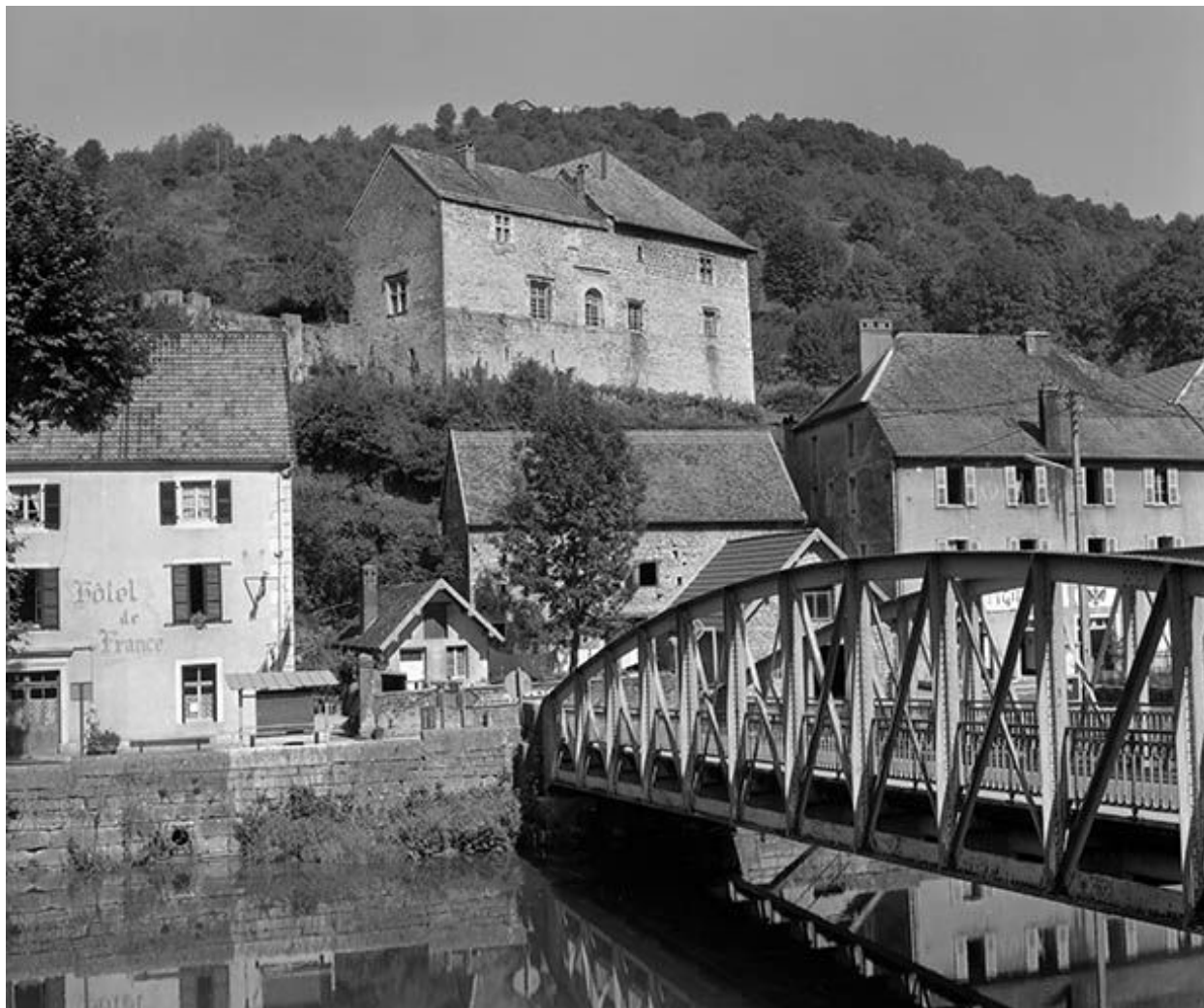
Vue générale depuis la rive gauche de la Loue.