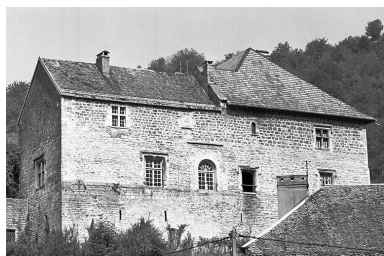
Elévation sud. IVR43_19802500977X