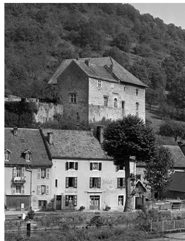
Vue générale, angle sud-ouest. IVR43_19802500978X