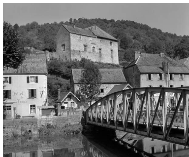
Vue générale depuis la rive gauche de la Loue.