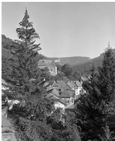
Vue générale depuis l'ouest. IVR43_19802500979X