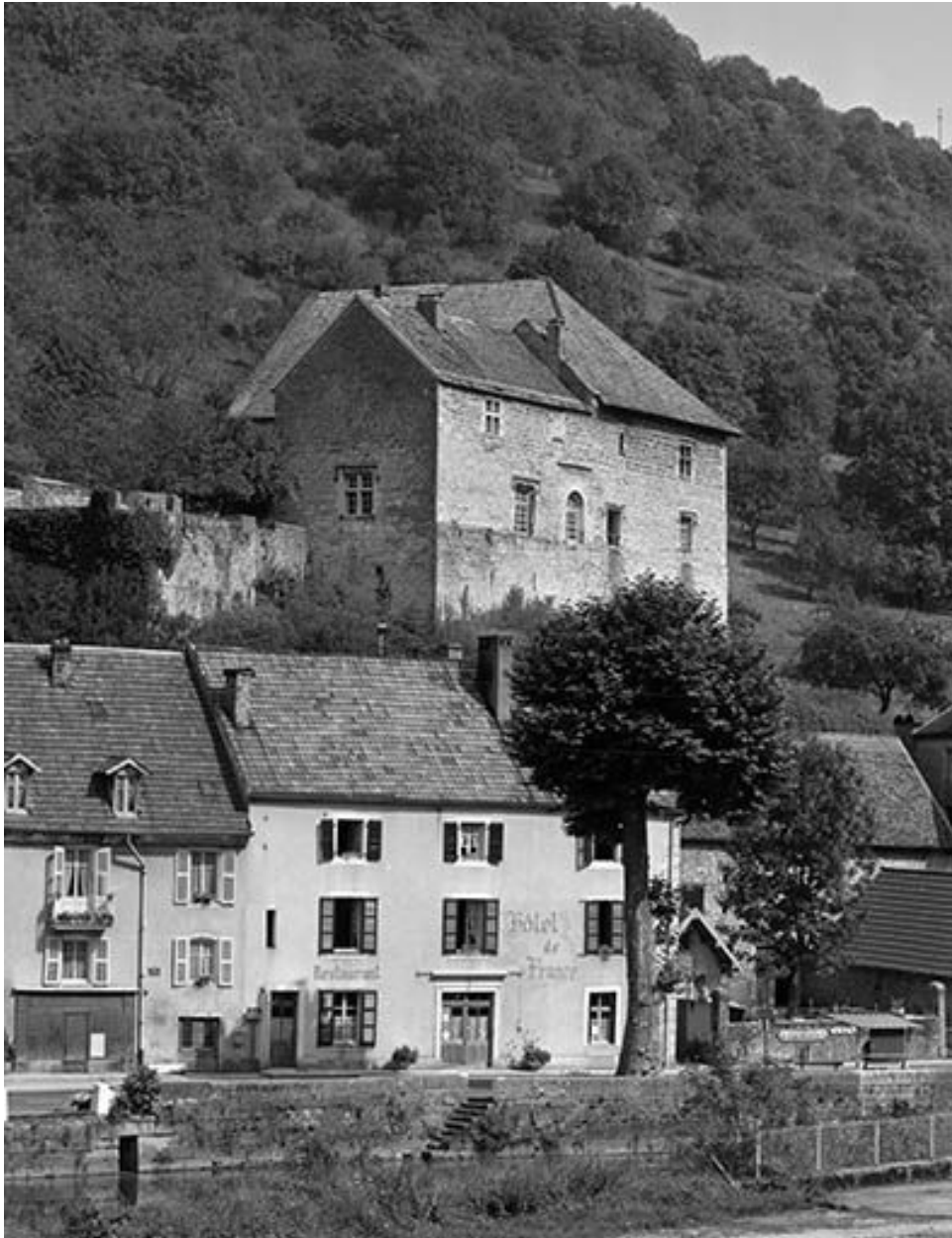
Vue générale, angle sud-ouest.