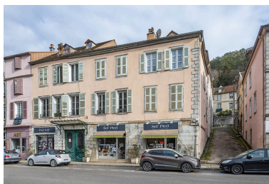
Façade sur la rue de la République. IVR43_20223900328NUC4A