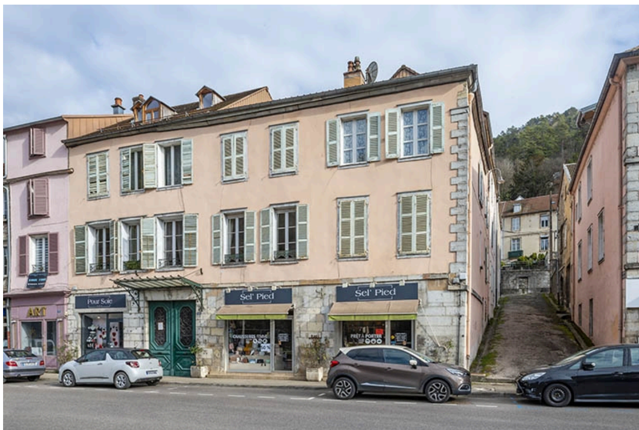
Façade sur la rue de la République.