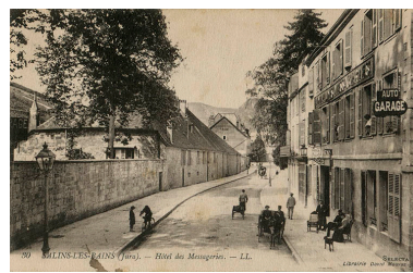
Vue ancienne (premier quart du 20e siècle).