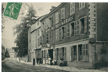
Vue ancienne (premier quart du 20e siècle). IVR43_20223900790NUC4A