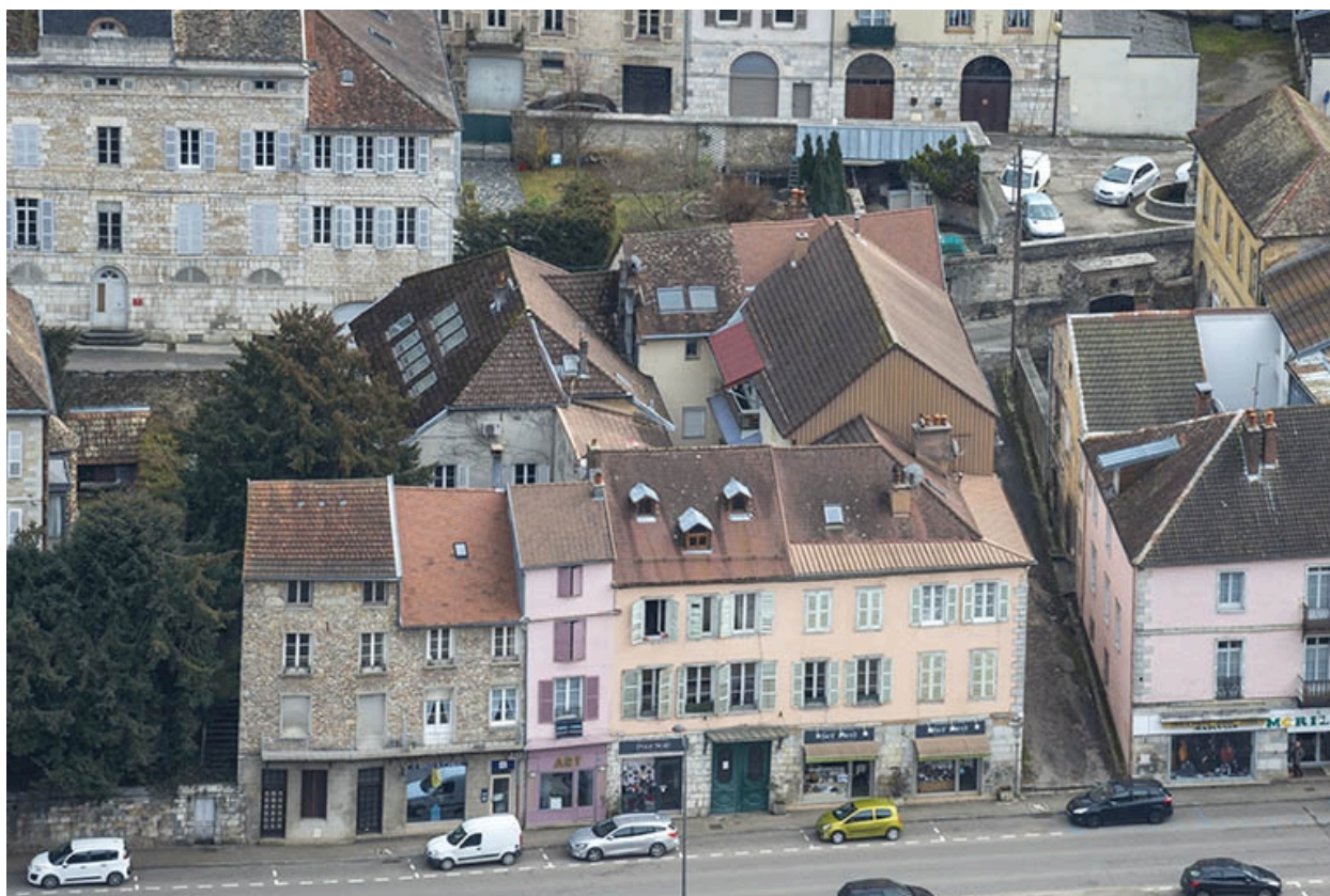
Vue depuis le mont Saint-André.