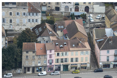
Vue depuis le mont Saint-André. IVR43_20223900327NUC4A