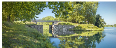
Vue d'ensemble d'amont. IVR26_20162101313NUC4A