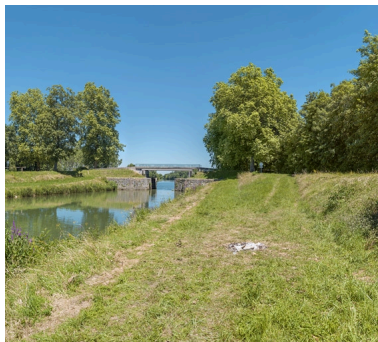
Vue d'ensemble d'aval. IVR26_20162101314NUC4A