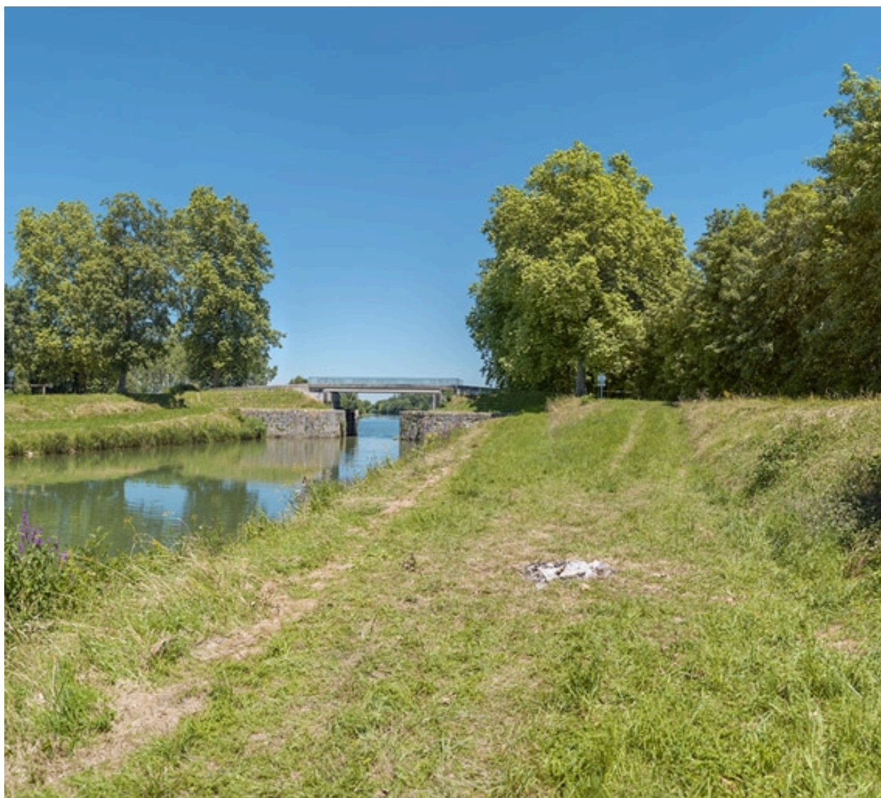
Vue d'ensemble d'aval.