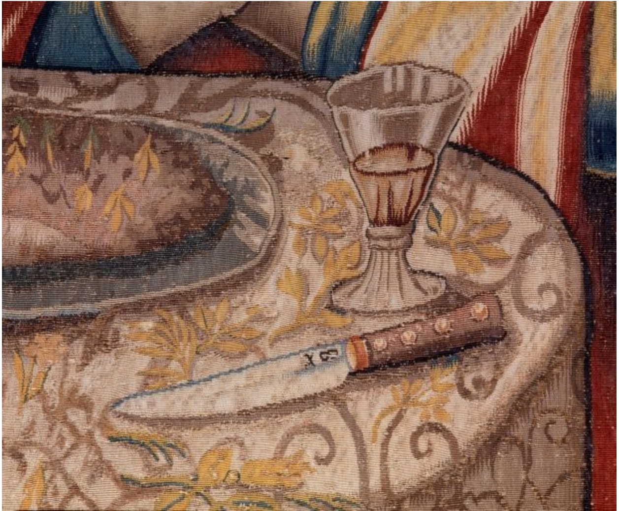
Pièce n. 2 : Bénédiction de Jacob, détail