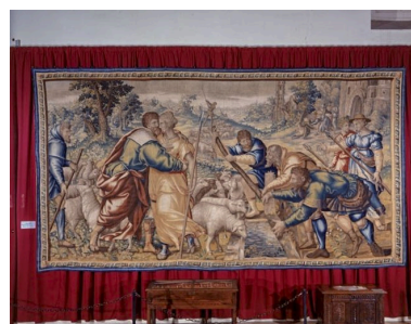
Pièce n. 4 : Rencontre de Jacob et Rachel. IVR26_19902100239VA