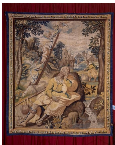
Pièce n. 3 : Songe de Jacob. IVR26_19902100314VA