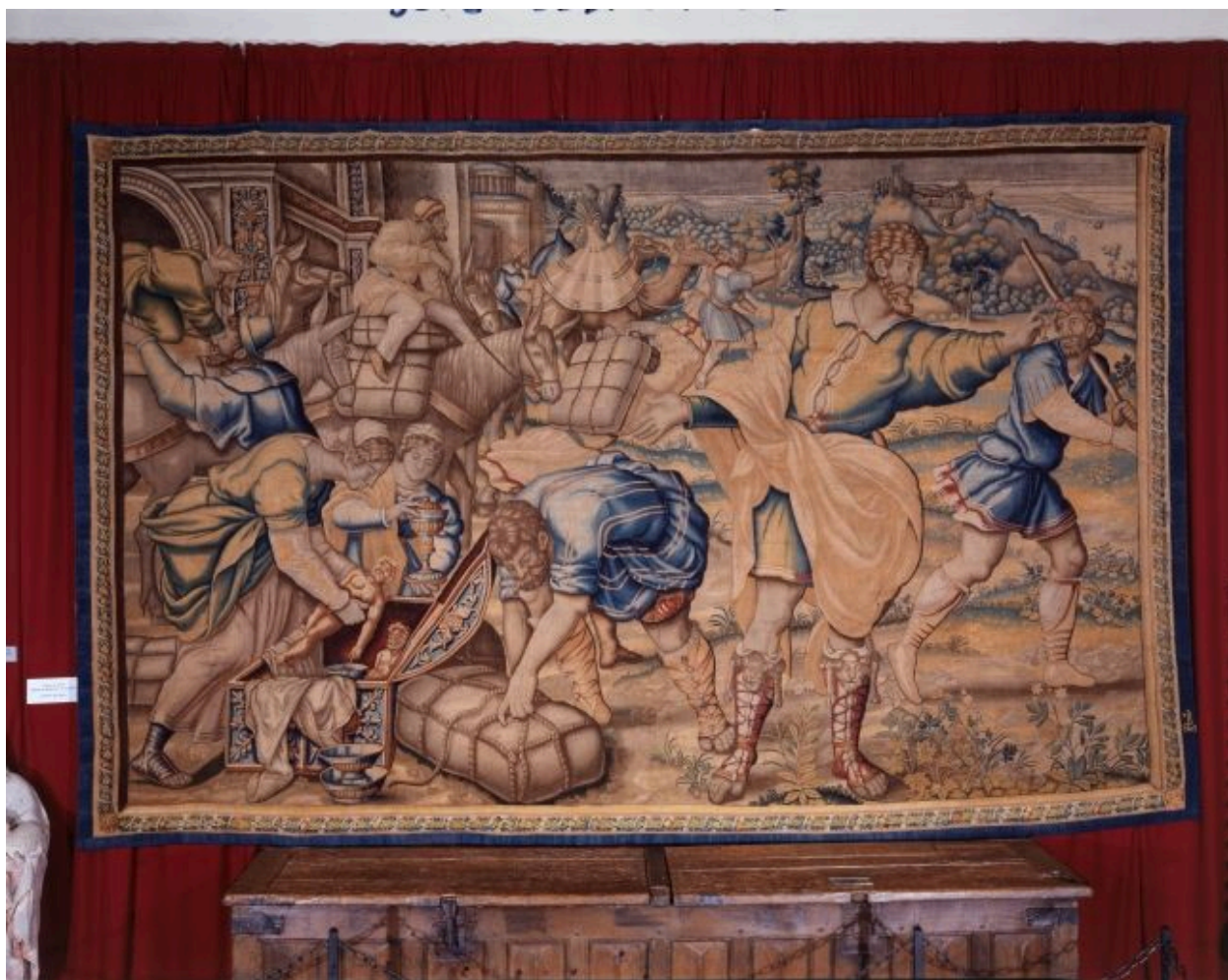
Pièce n. 5 : Départ de Jacob.