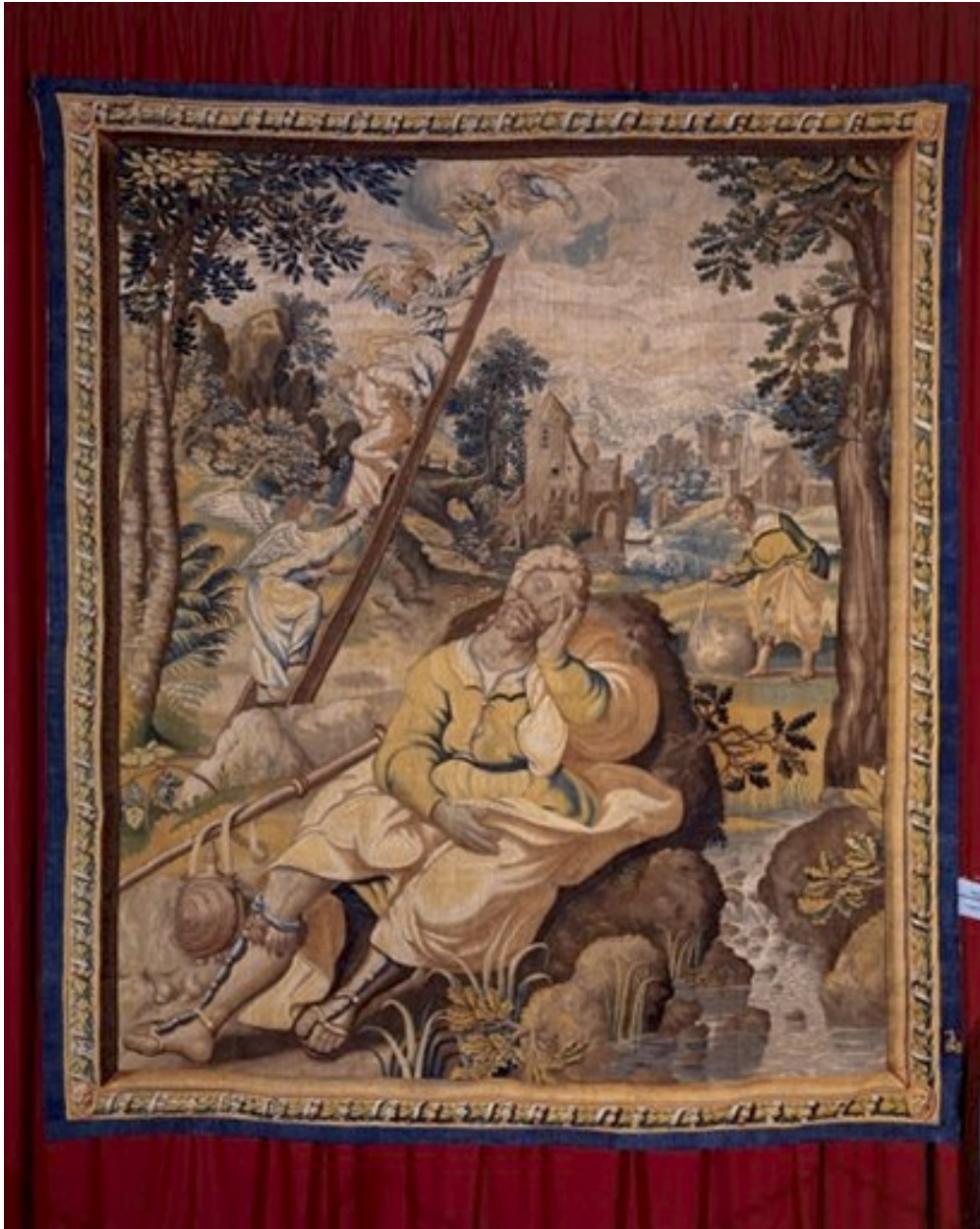
Pièce n. 3 : Songe de Jacob.