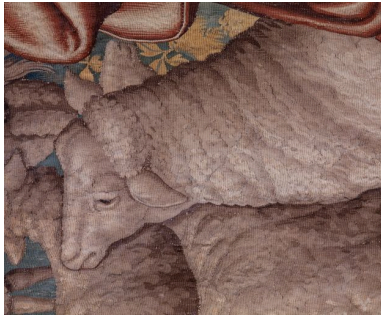
Pièce n. 4 : Rencontre de Jacob et Rachel, détail.