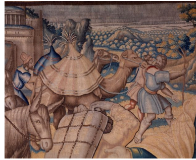
Pièce n. 5 : Départ de Jacob, détail. IVR26_19902100345XA