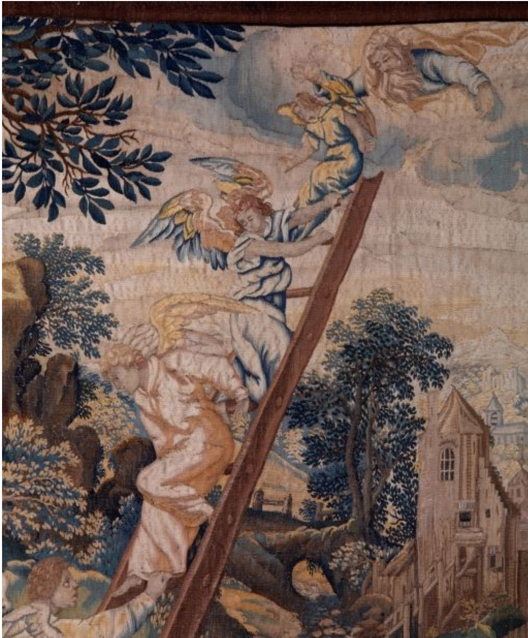
Pièce n. 3 : Songe de Jacob, détail.