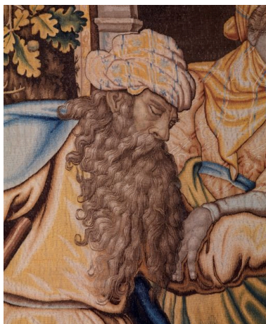
Pièce n. 1 : Départ d'Esau pour la chasse, détail. IVR26_19902100298XA