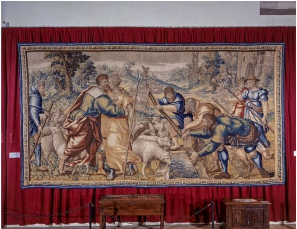
Pièce n. 4 : Rencontre de Jacob et Rachel.