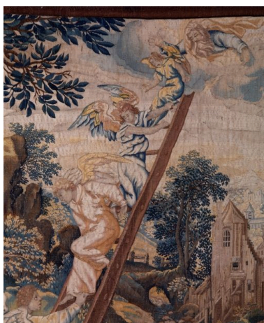
Pièce n. 3 : Songe de Jacob, détail.