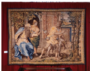
Pièce n. 1 : Départ d'Esau pour la chasse.