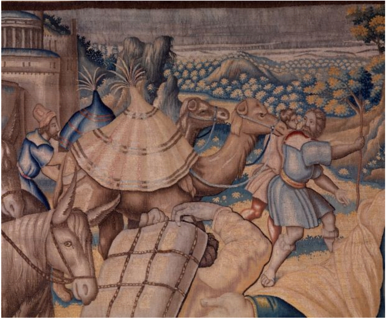
Pièce n. 5 : Départ de Jacob, détail.