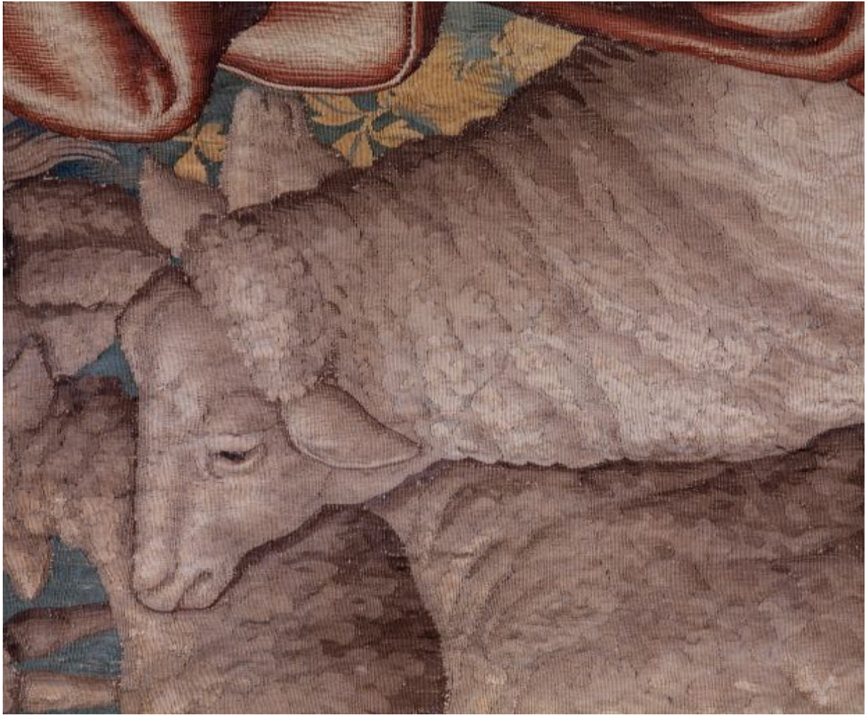
Pièce n. 4 : Rencontre de Jacob et Rachel, détail.