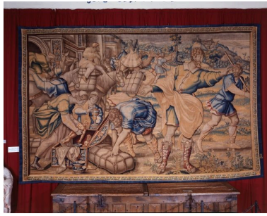
Pièce n. 5 : Départ de Jacob. IVR26_19902100333VA