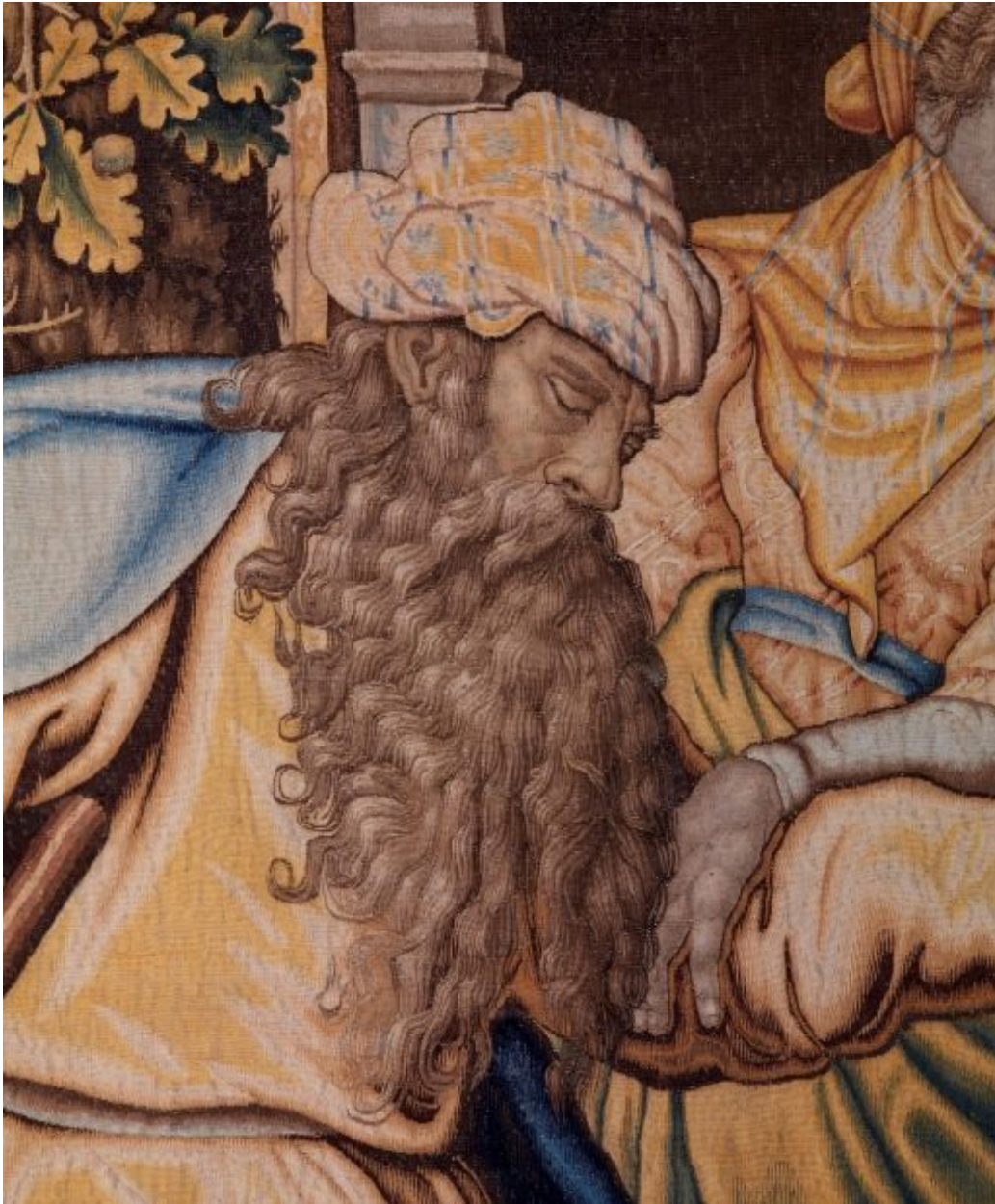
Pièce n. 1 : Départ d'Esau pour la chasse, détail.