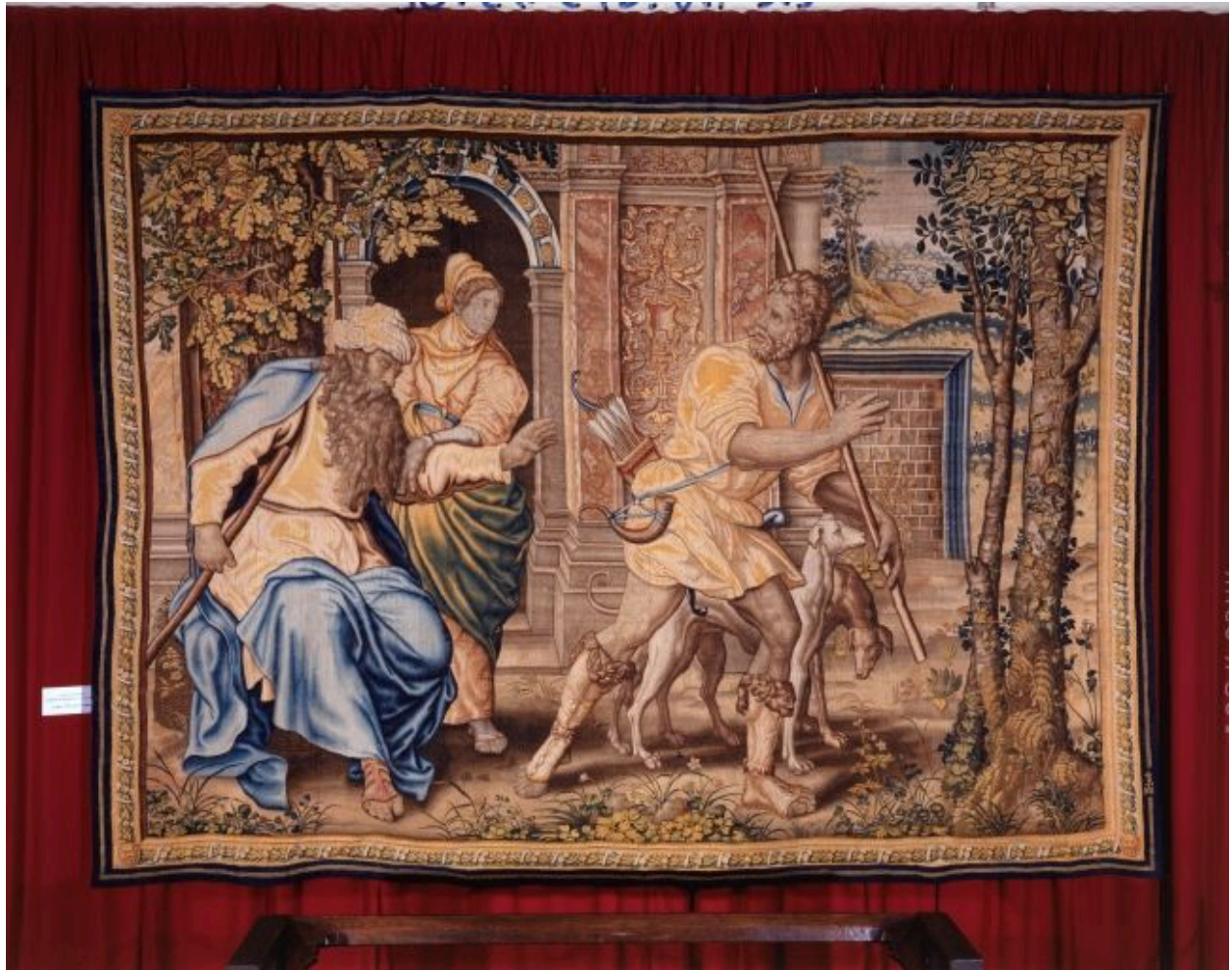
Pièce n. 1 : Départ d'Esau pour la chasse.