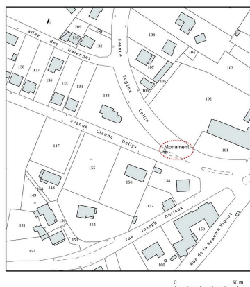
Plan de situation, extrait du plan cadastral (2020).

Dess. Pierre-Marie Barbe-Richaud IVR26_20205800670NUDA