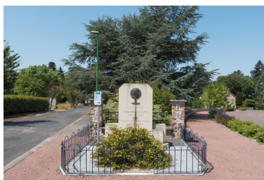
Vue au croisement de l'avenue Claude Dellys et de l'avenue Eugène Collin. IVR26_20195800564NUC4A

IVR26_20205800670NUDA