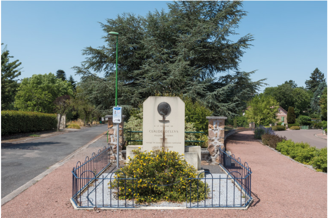
Vue au croisement de l'avenue Claude Dellys et de l'avenue Eugène Collin.