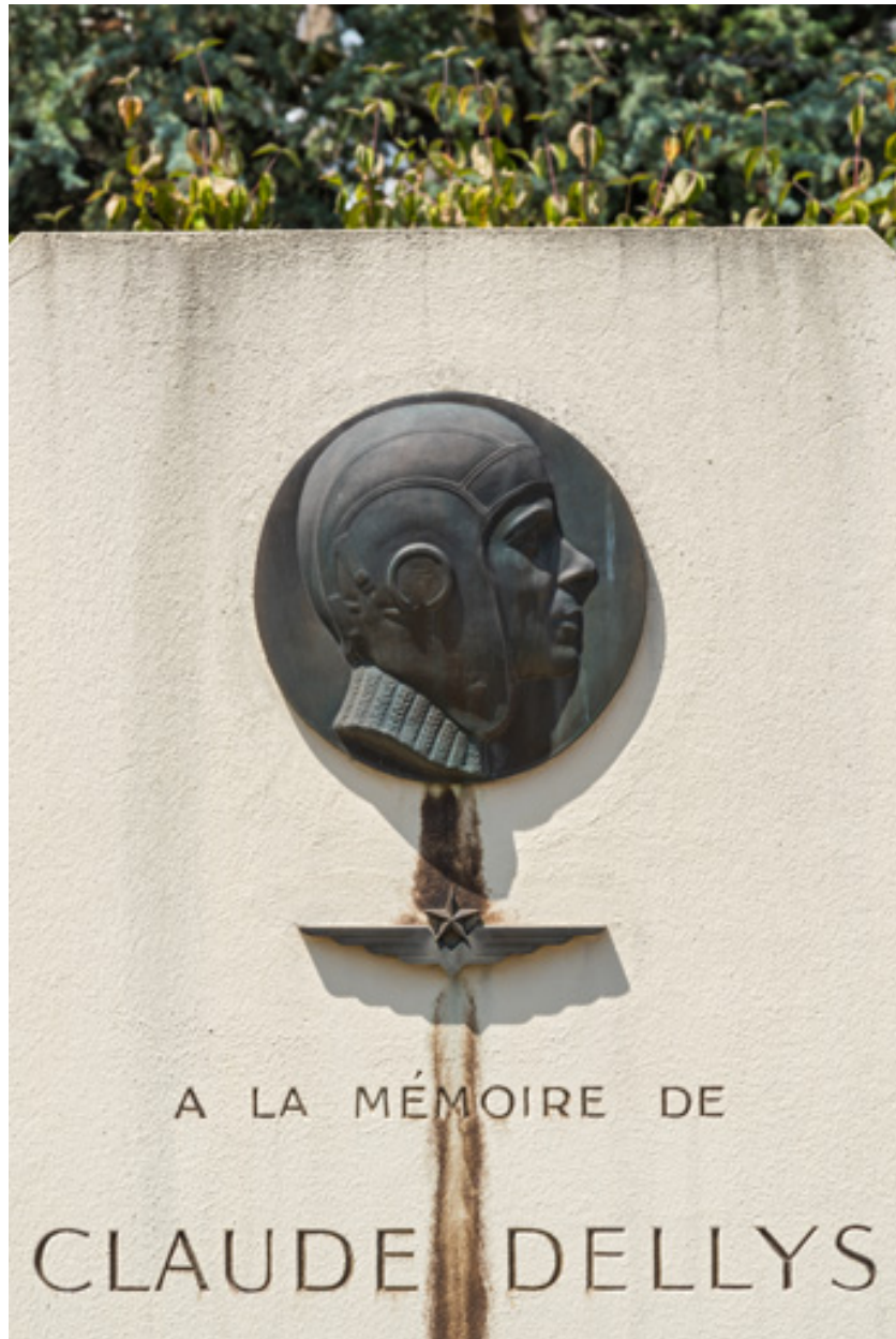
Détail, médaillon et inscription.