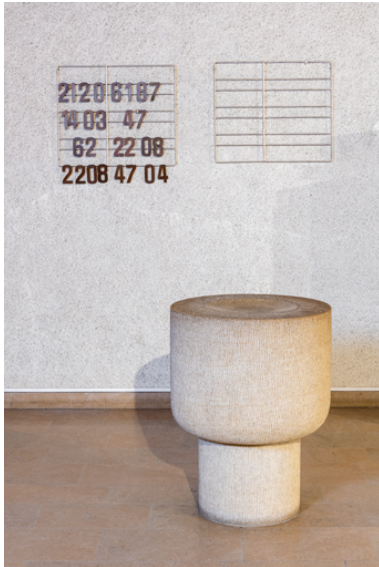
Vue d'ensemble des fontes baptismaux. IVR26_20227100225NUC4A