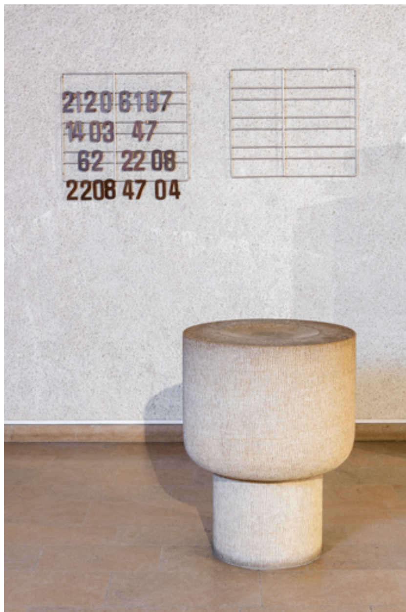
Vue d'ensemble des fonds baptismaux.