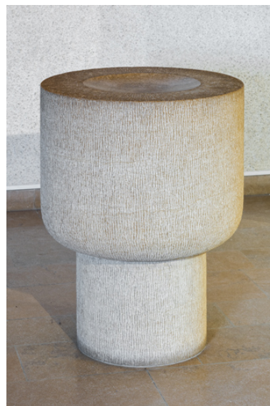
Vue des fonds baptismaux.

Autr. auteur inconnu IVR26_20227100262NUC4