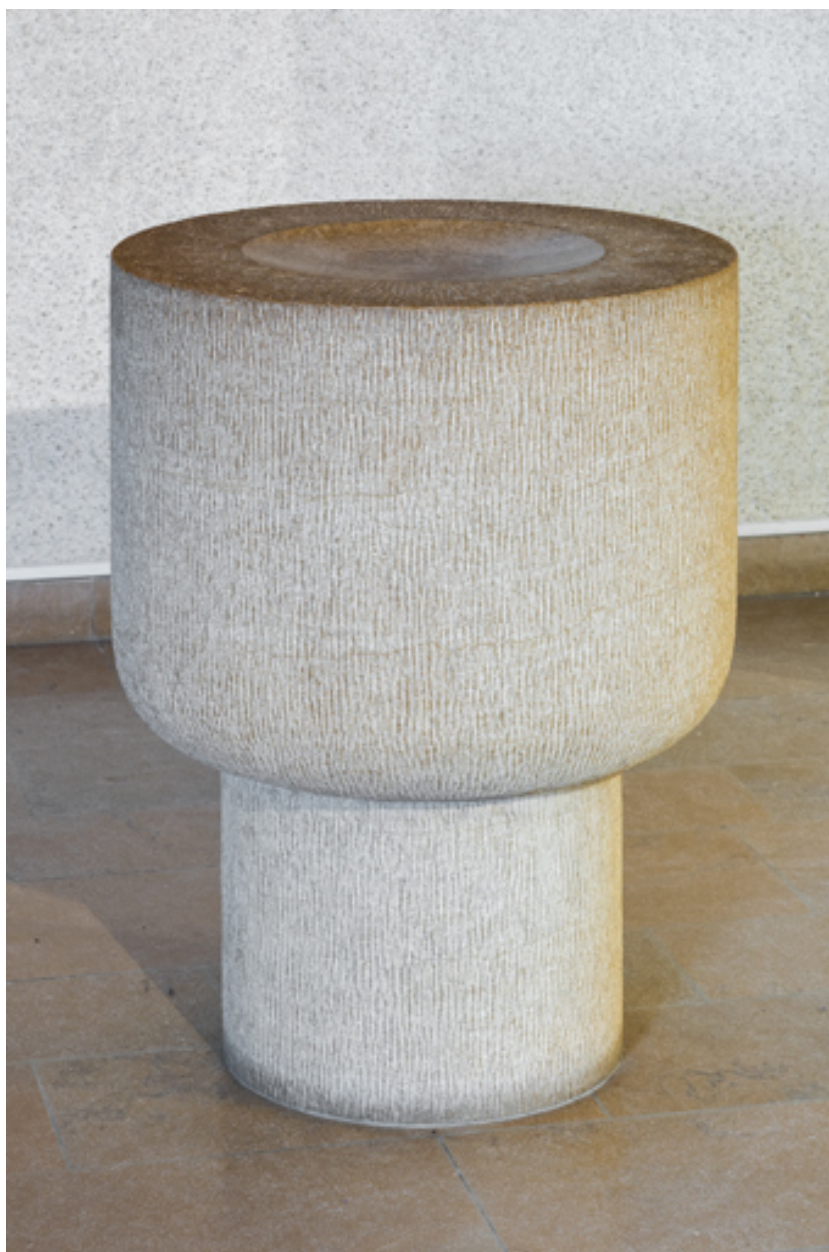
Vue des fonts baptismaux.