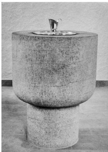
Vue des fonds baptismaux avec le plat de présentation et son aiguillère.

Autr. Oskar Bitterli, Autr. Barnabé Augros IVR26_20227100255NUC2A