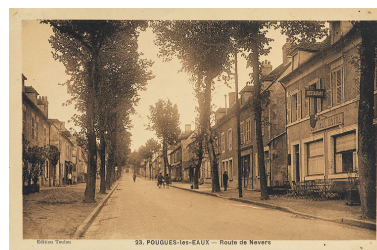
Situation de l'hôtel sur l'avenue de Paris, vue en direction du sud.