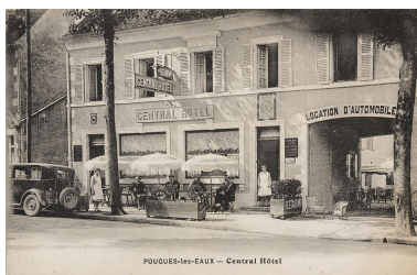
Façade de l'hôtel dans les années 1930.