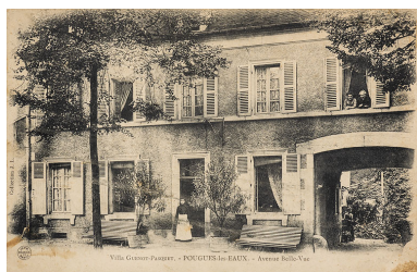
Façade de l'Hôtel dans les années 1900.