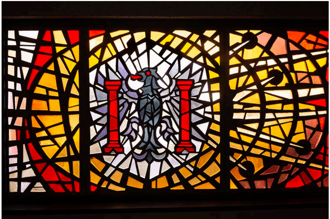
Partie gauche vue de face.