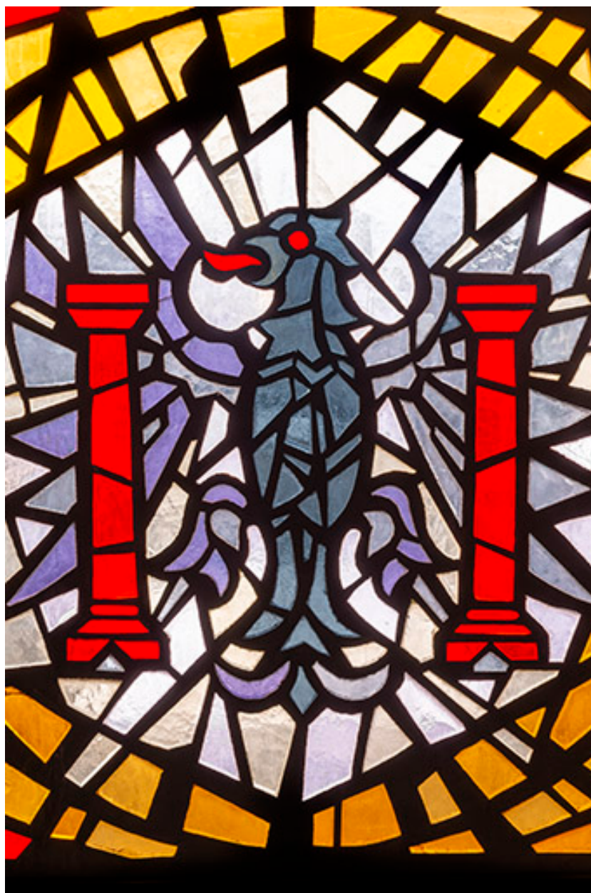
Détail : armoiries de Besançon.