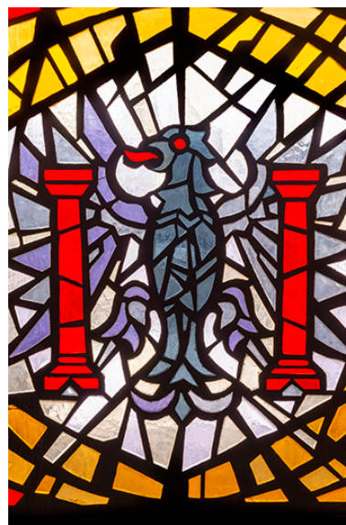
Détail : armoiries de Besançon. IVR43_20232500547NUC4A