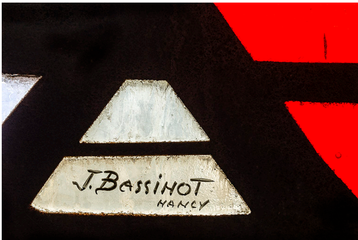
Détail : signature de J. Bassinot.