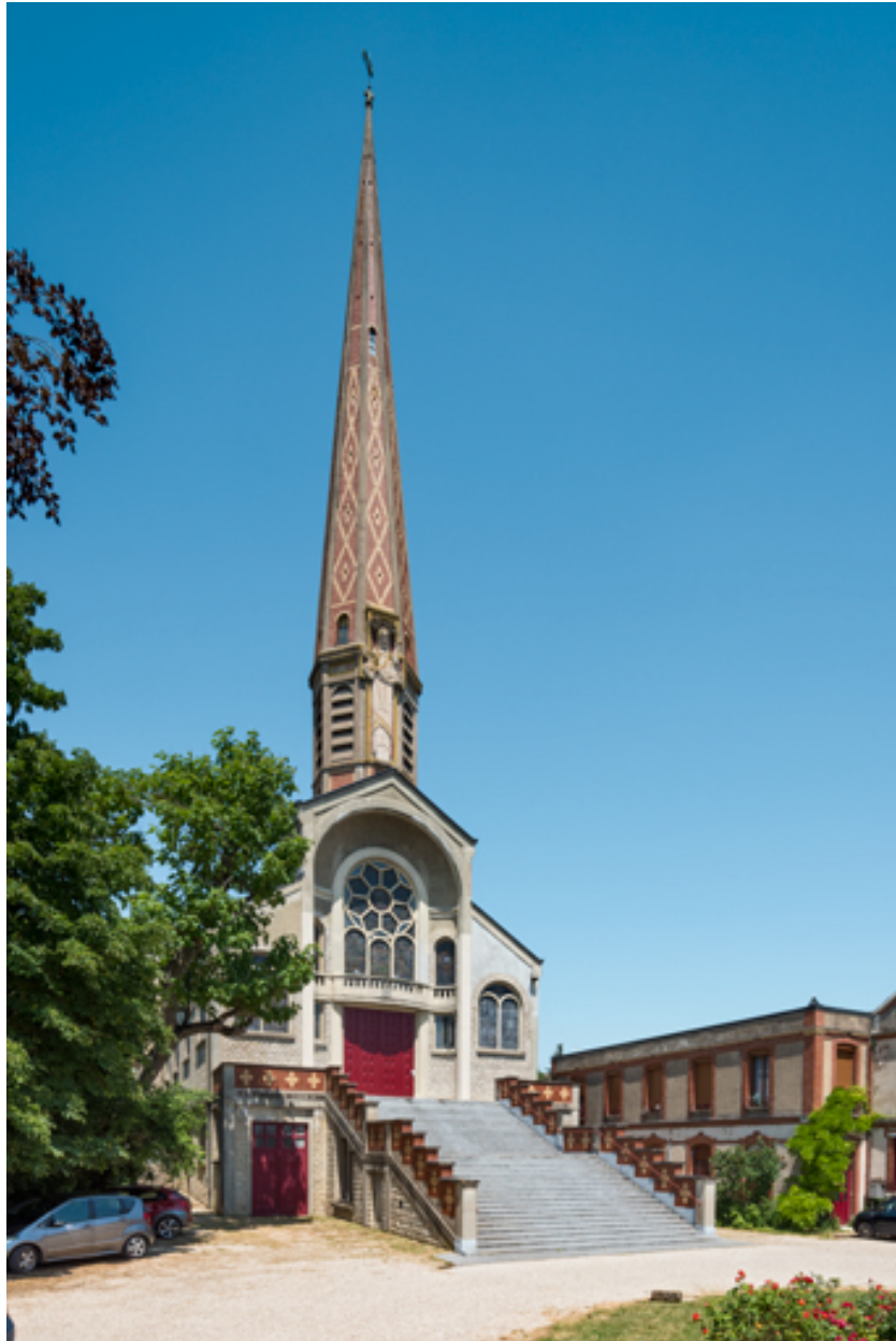
Eglise et chapelle. Vue de trois quarts.