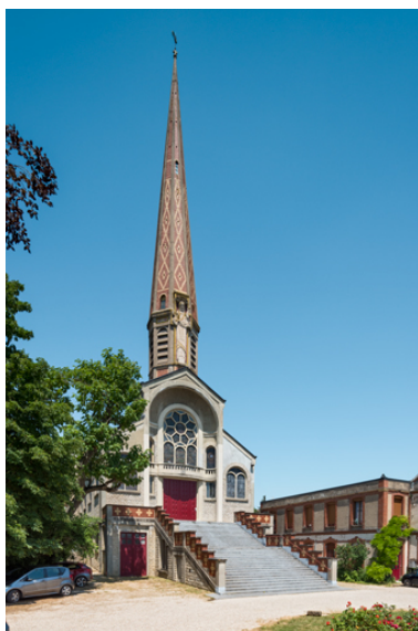
Eglise et chapelle. Vue de trois quarts. IVR26_20238901141NUC4A