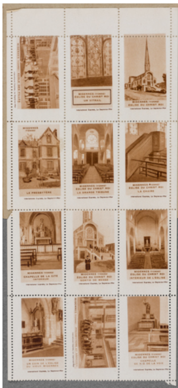
Carnet de timbres du Christ-Roi, détail.