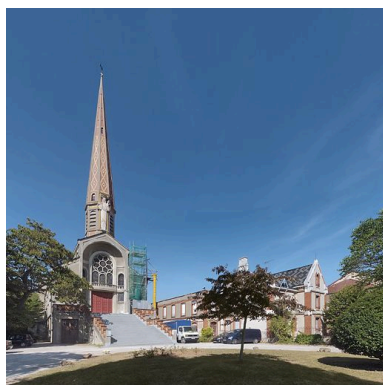
Eglise, chapelle et presbytère. Vue de trois quarts.