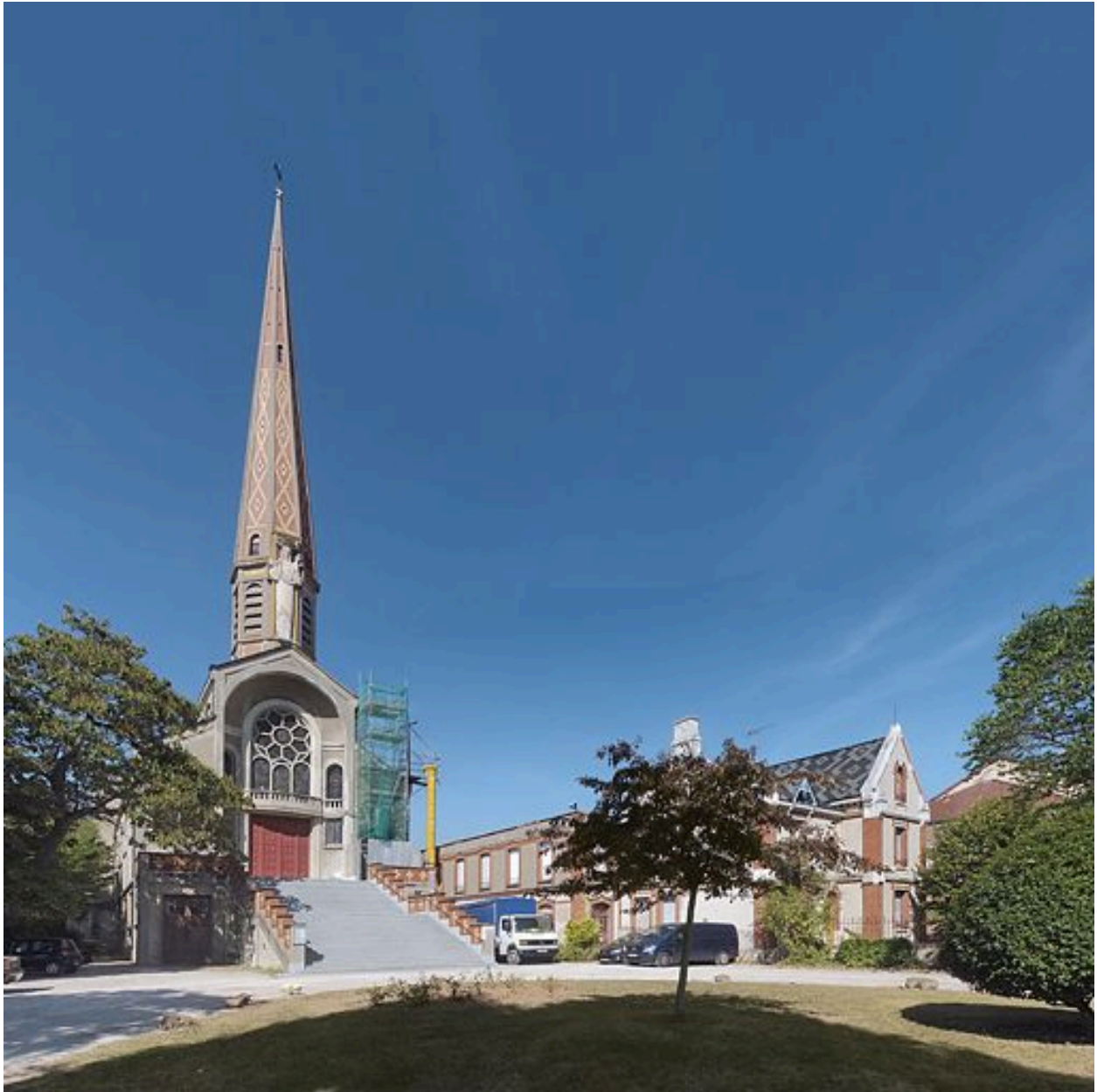
Eglise, chapelle et presbytère. Vue de trois quarts.