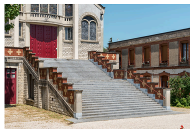
Escalier de l'église. A droite, la chapelle. Vue de trois quarts. IVR26_20238901140NUC4A