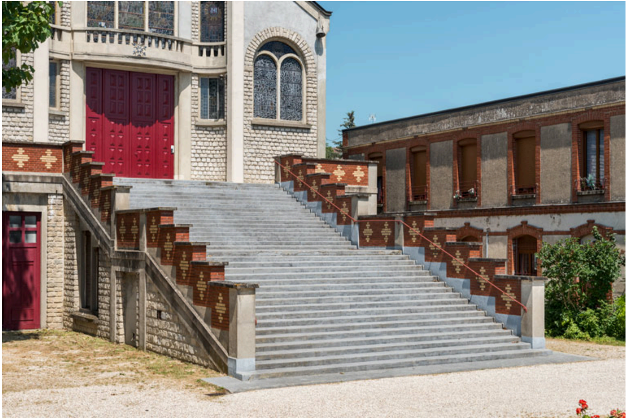
Escalier de l'église. A droite, la chapelle. Vue de trois quarts.