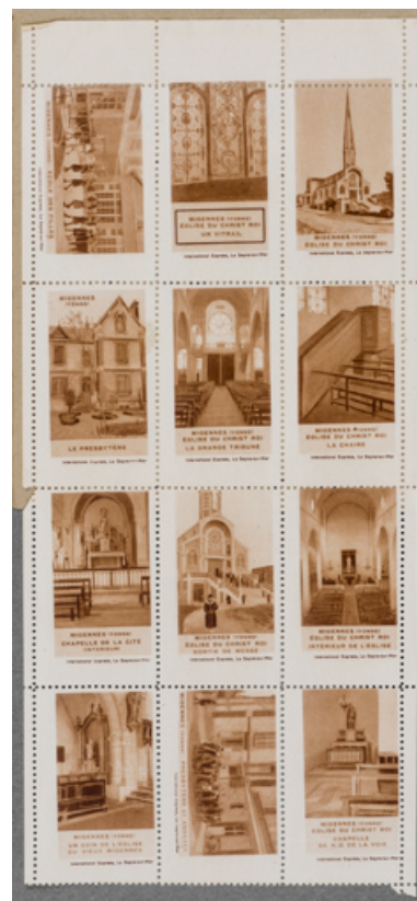
Carnet de timbres du Christ-Roi, détail. IVR26_20238900740NUC2A