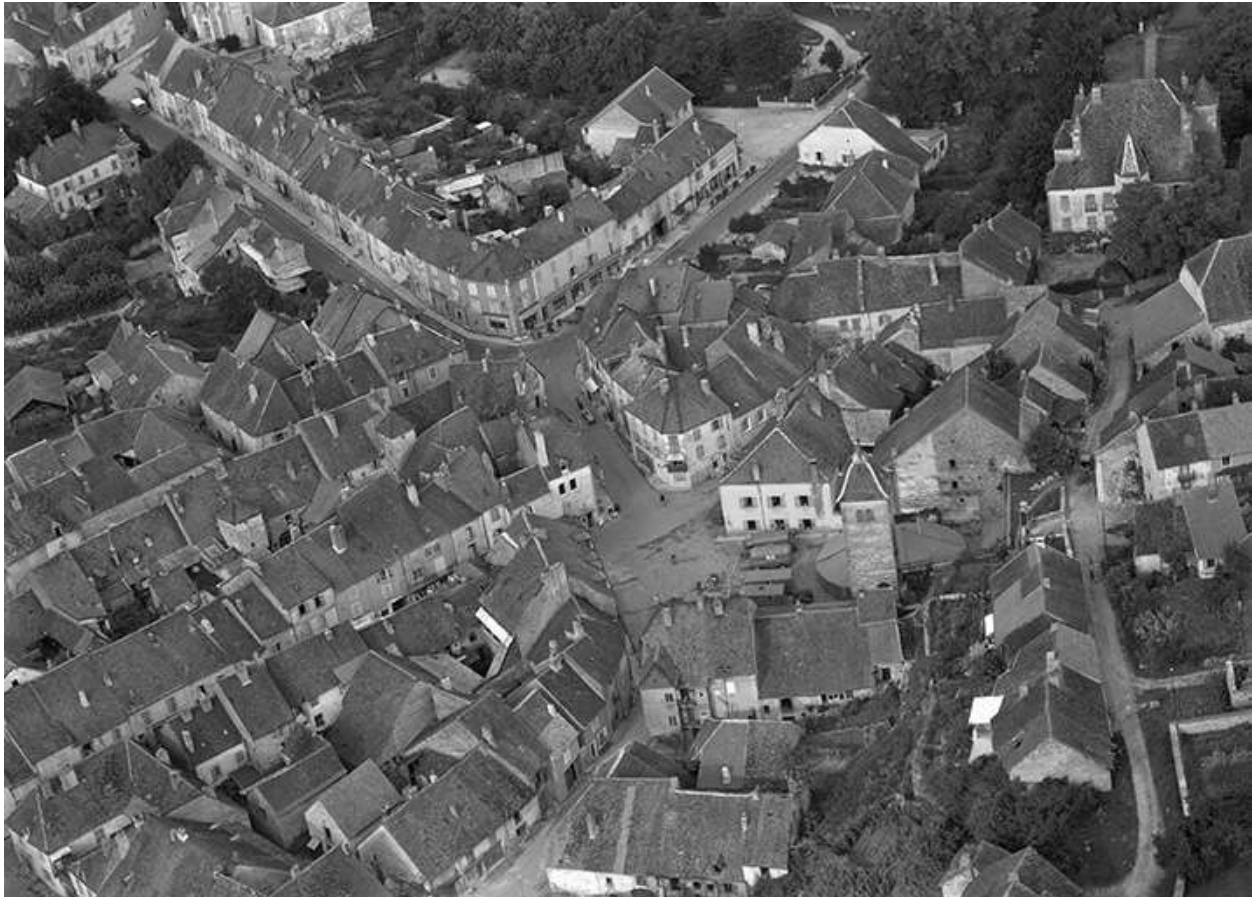
Vue aérienne du centre du village en 1956.