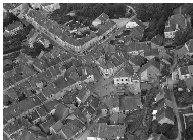
Vue aérienne du centre du village en 1956.