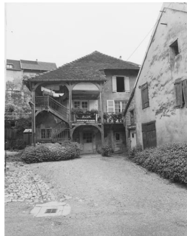
Maison située rue de la Vieille Eglise.