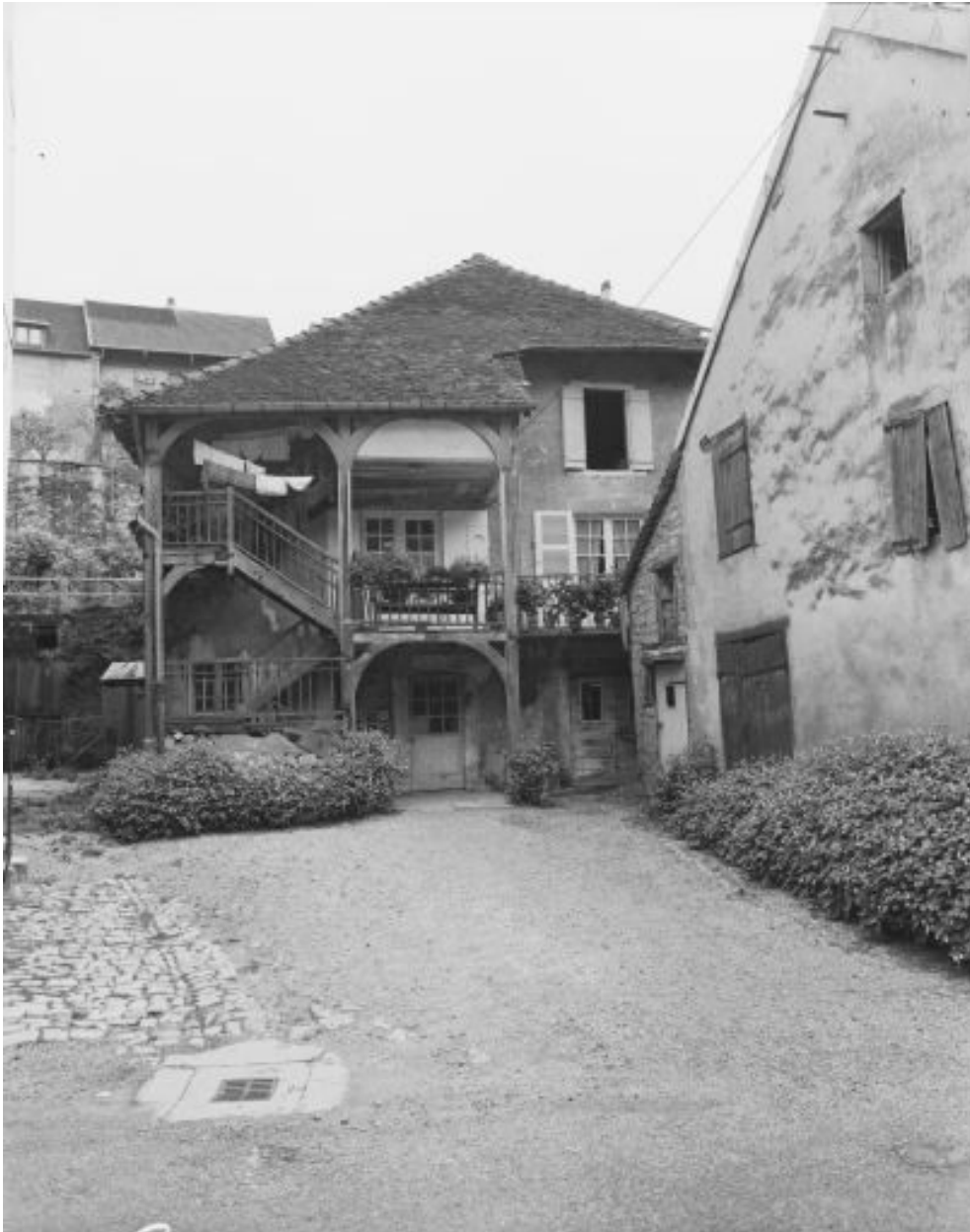
Maison située rue de la Vieille Eglise.