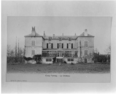
Vue d'ensemble. Carte postale ancienne