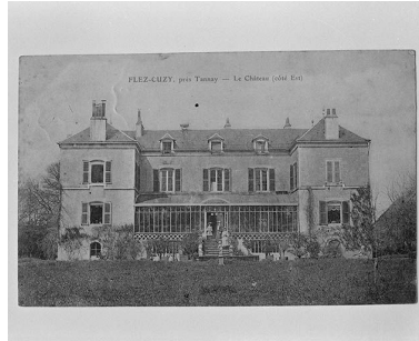
Vue d'ensemble. Carte postale ancienne. Oblitération datée août 1906.