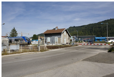
Vue d'ensemble. IVR43_20083900917NUC2A

Plan de situation. Extrait du plan cadastral informatisé, 2006, section AE, échelle 1:1000.