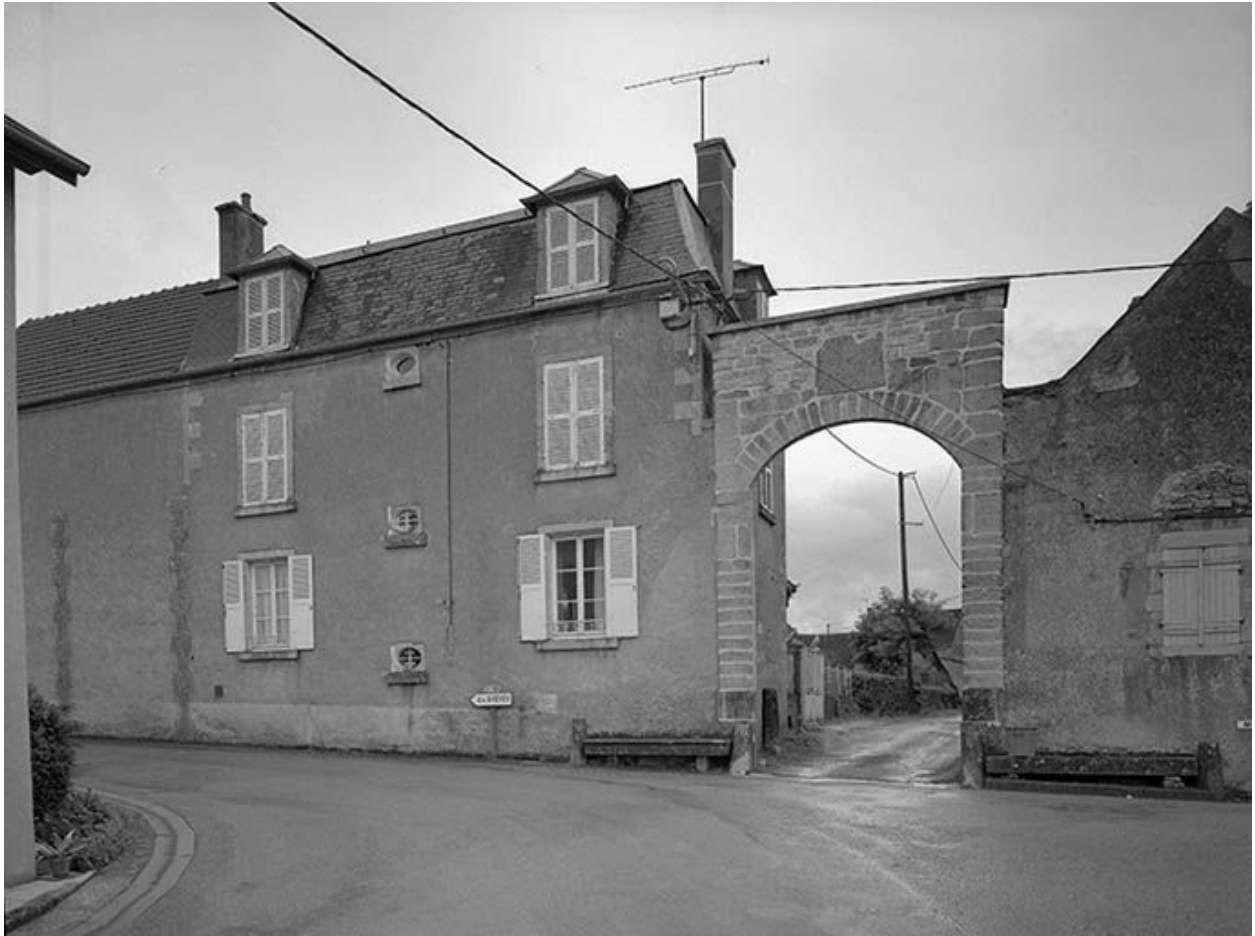
Portail d'accès à la basse-cour