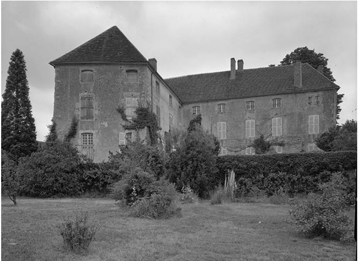
Vue d'ensemble prise du sud-est, depuis la terrasse inférieure.