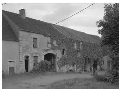
Ancienne ferme du château. Vue d'ensemble IVR26_19945800022V