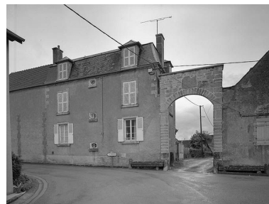
Portail d'accès à la basse-cour