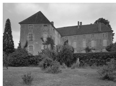
Vue d'ensemble prise du sud- est, depuis la terrasse inférieure. IVR26_19965800273X

IVR26_19965800283ZA