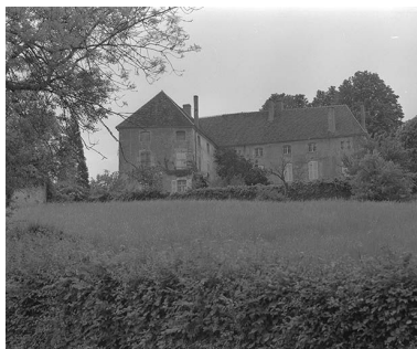
Vue d'ensemble des élévations postérieures