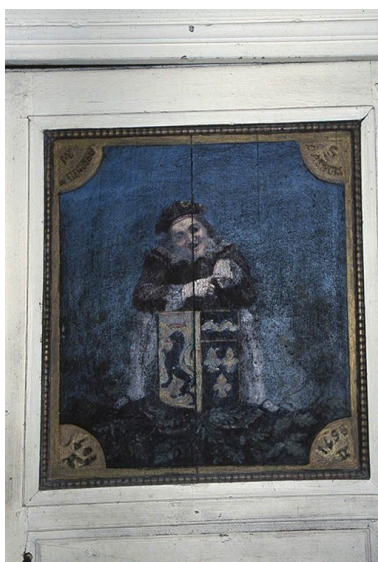
L'arcade d'entrée de la cage du grand escalier. Détail du couronnement.

IVR26_19965800283ZA