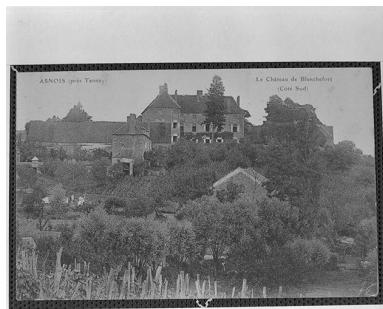
ASNOIS (près Tannay) - Le Château de Blanchefort (côté sud) (carte postale ancienne)