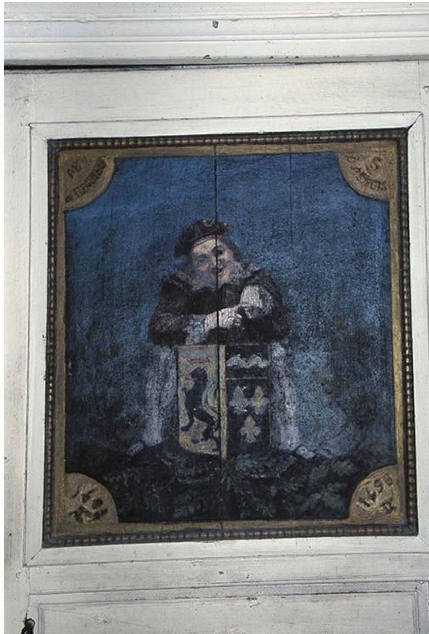
L'arcade d'entrée de la cage du grand escalier. Détail du couronnement.