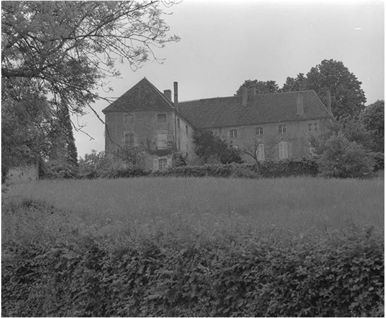
Vue d'ensemble des élévations postérieures