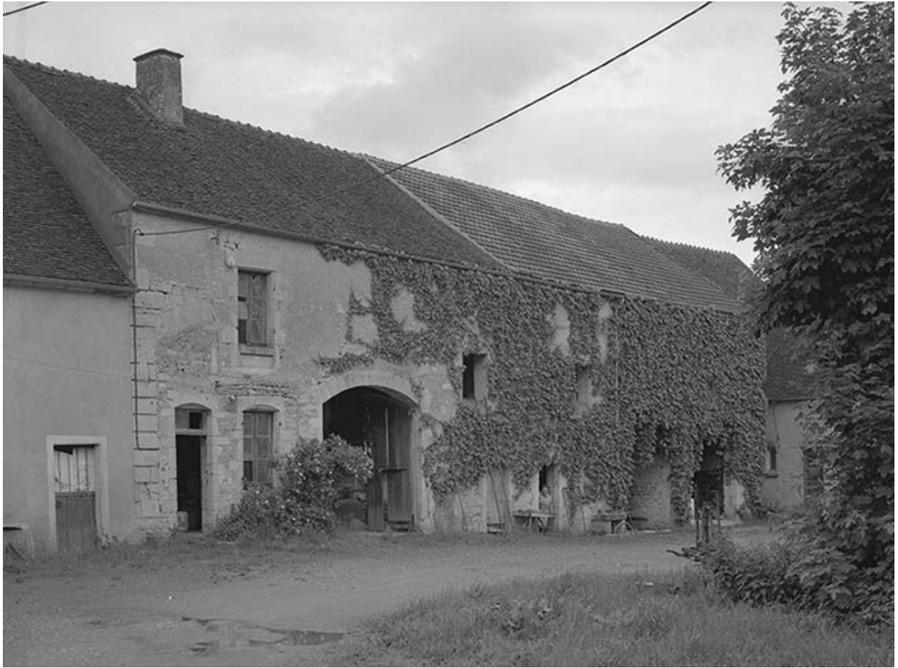
Ancienne ferme du château. Vue d'ensemble