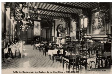
Vue ancienne du tableau encore en place dans la salle du restaurant (à droite).