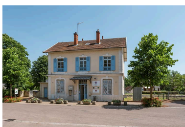
Façade nord. IVR26_20212100001NUC4A