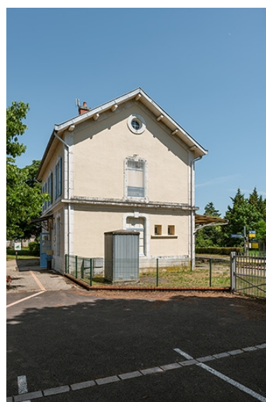
Façade ouest. IVR26_20212100002NUC4A