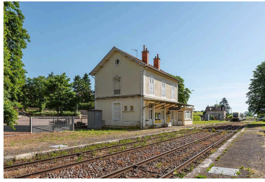
Vue de la voie ferrée en direction de Chagny.

IVR26_20212100003NUC4A