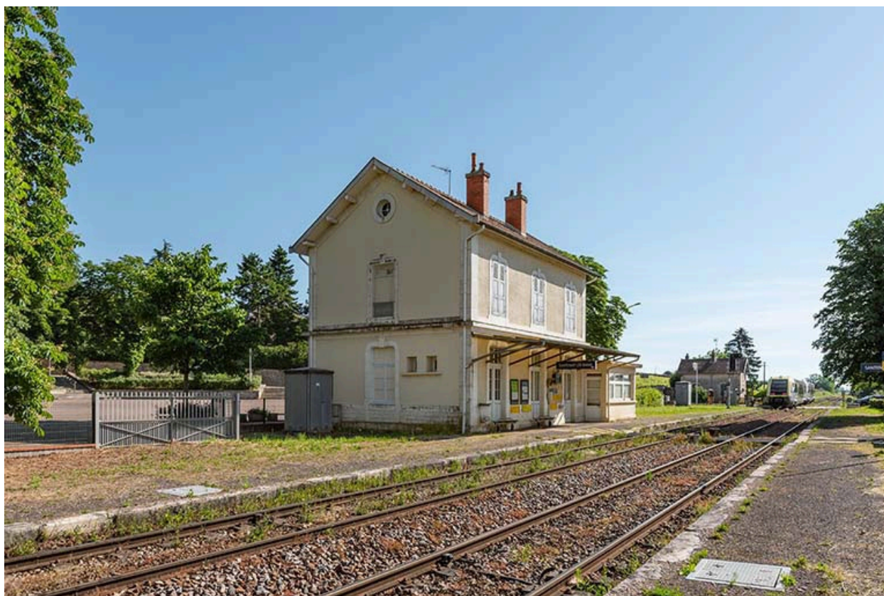
Vue de la voie ferrée en direction de Chagny.