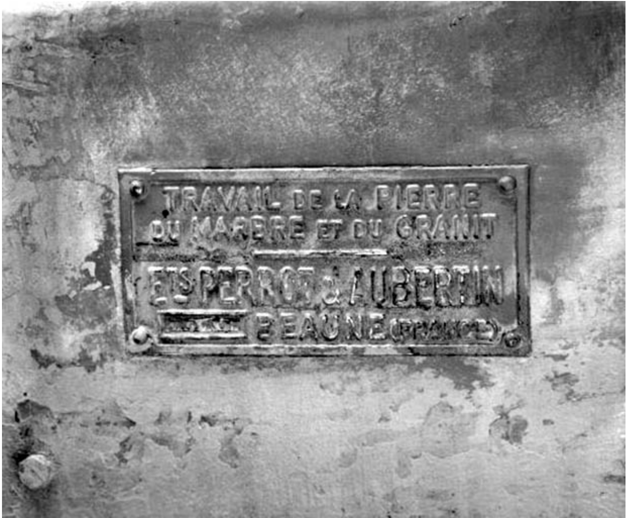
Débiteuse-moulineuse sud : plaque du constructeur.