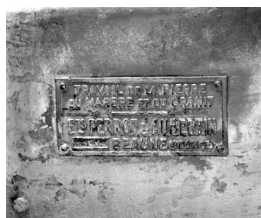
Débiteuse-mouleuse sud : plaque du constructeur.