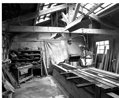
Débiteuse-mouleuse sud : vue d'ensemble.