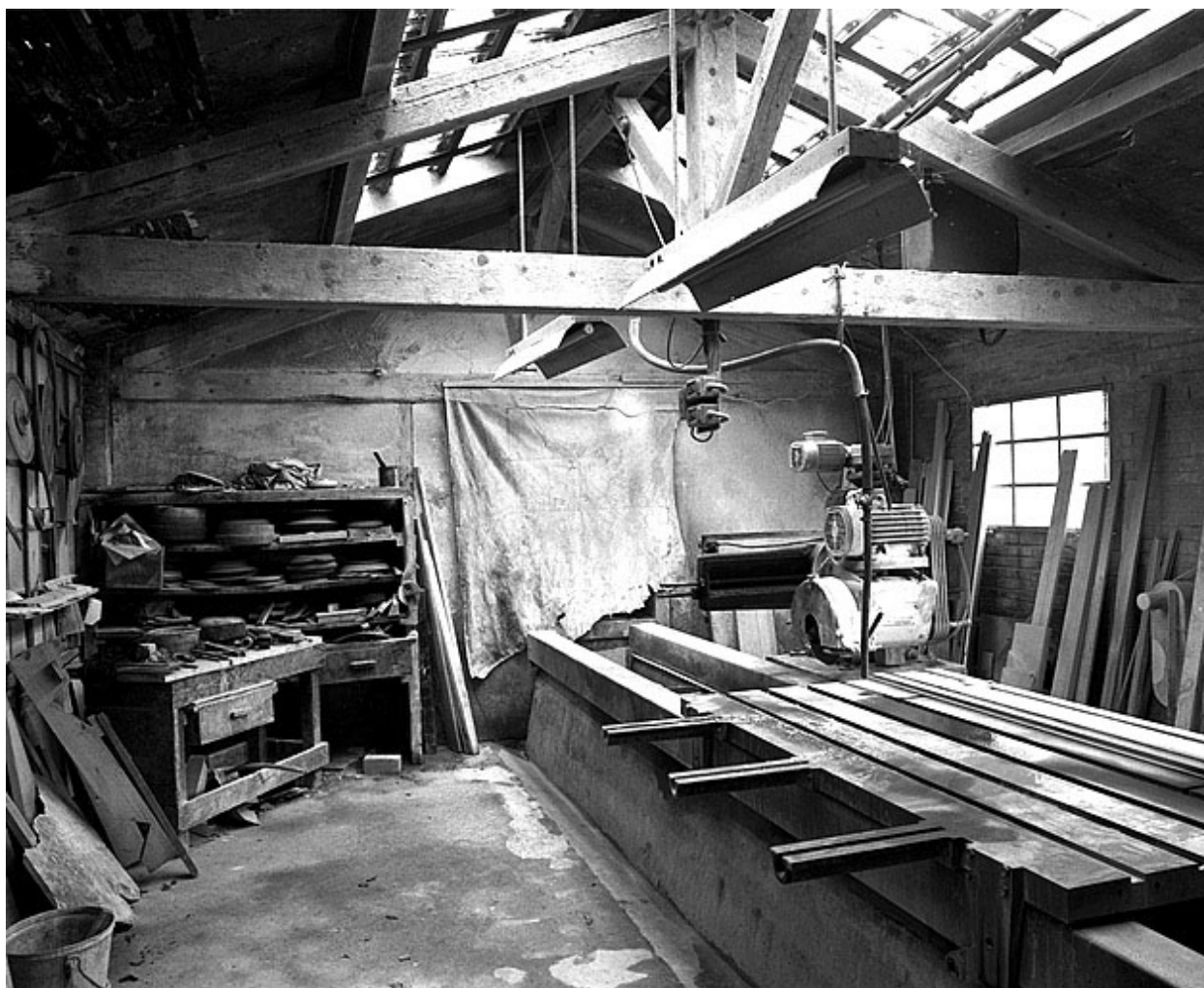
Débiteuse-moulineuse sud : vue d'ensemble.