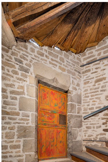
Escalier en vis (entrée n°1 cour des Halles). Porte palière. IVR43_20233900092NUC4A