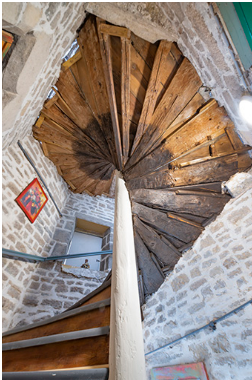
Escalier en vis (entrée n°1 cour des Halles). Vue en contre-plongée.