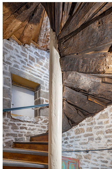
Escalier en vis (entrée n°1 cour des Halles). Détail des marches. IVR43_20233900093NUC4A