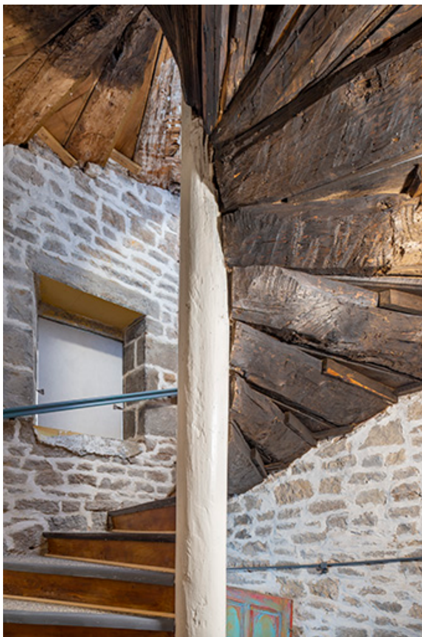
Escalier en vis (entrée n°1 cour des Halles). Détail des marches.