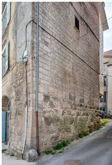
Façade nord du n°17.