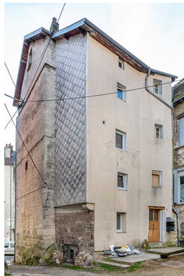
Façade postérieure (n°17) depuis la cour des Halles. IVR43_20233900086NUC4A