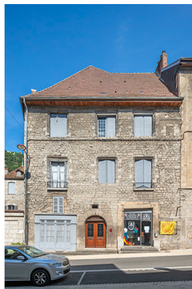
Bâtiment sud. Vue de face. IVR43_20233900867NUC4A