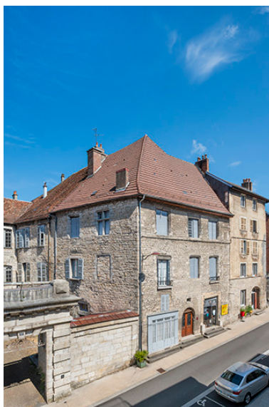
Vue d'ensemble depuis le sud-est. IVR43_20233900869NUC4A