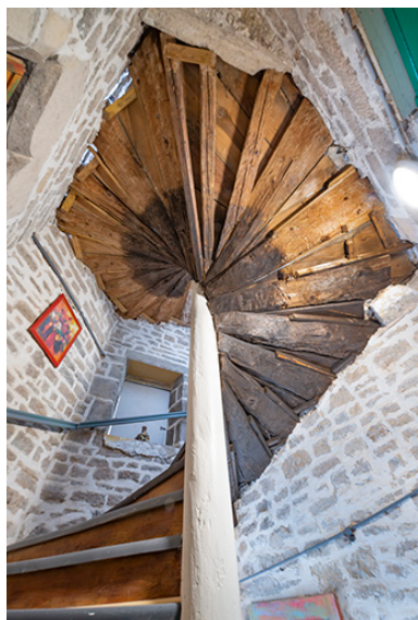
Escalier en vis (entrée n°1 cour des Halles). Vue en contre-plongée. IVR43_20233900091NUC4A