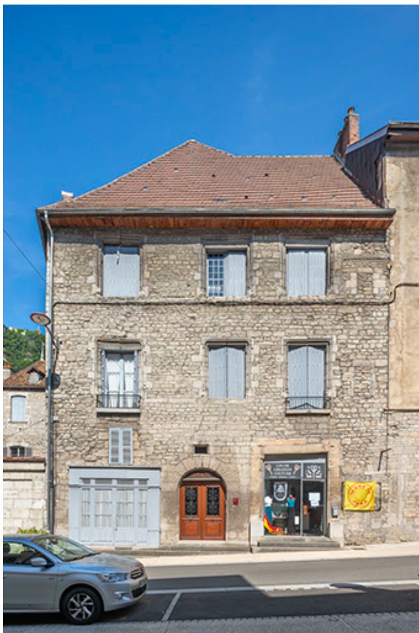
Bâtiment sud. Vue de face.