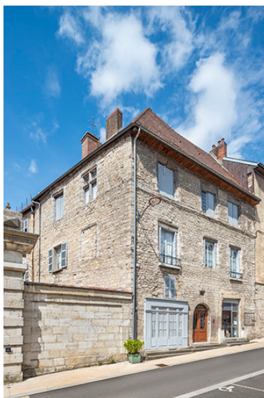
Vue d'ensemble de trois quarts gauche. IVR43_20233900187NUC4A