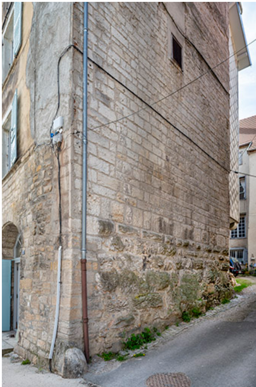
Façade nord du n°17.