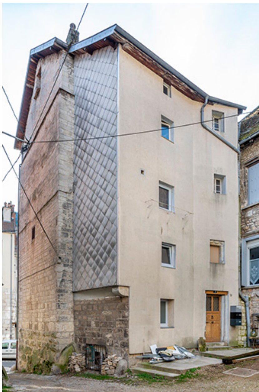
Façade postérieure (n°17) depuis la cour des Halles.