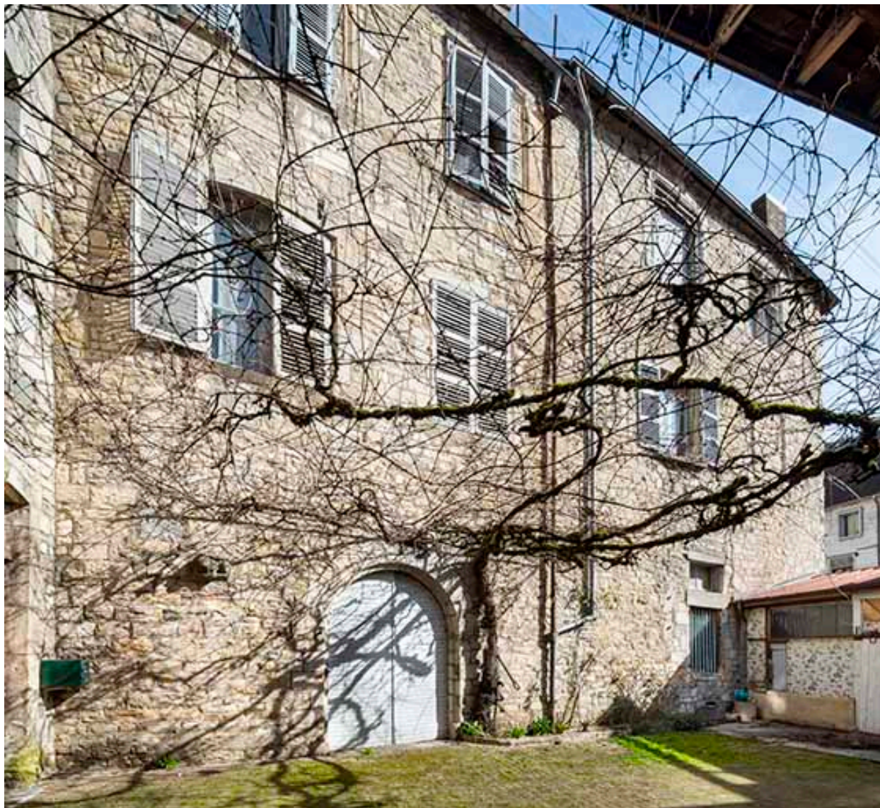
Façade sud (à gauche) depuis la cour de l'hôtel de Falletans.