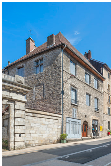
Vue de trois quarts gauche. IVR43_20233900868NUC4A