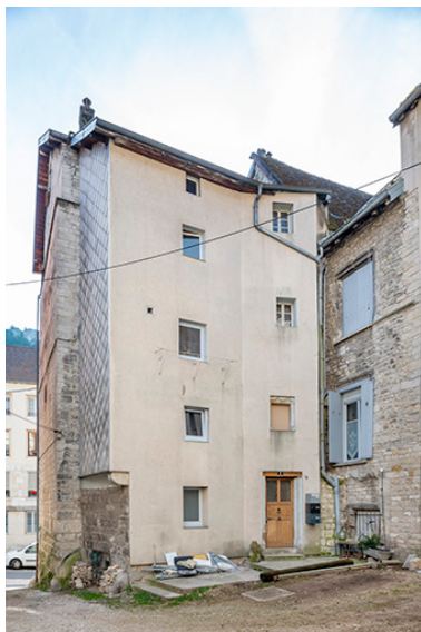
Façades postérieures des deux maisons depuis la cour des Halles. IVR43_20233900087NUC4A