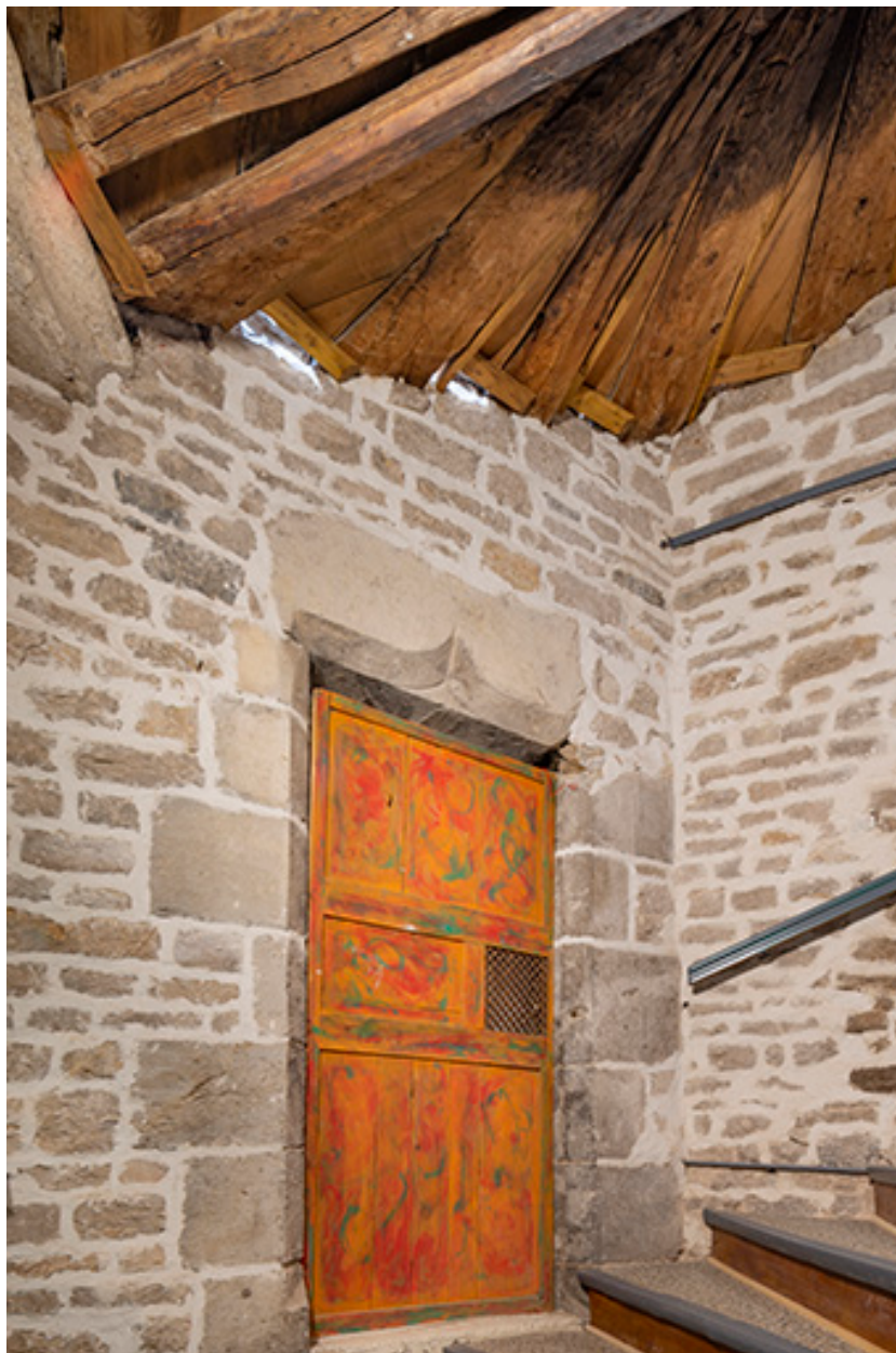
Escalier en vis (entrée n°1 cour des Halles). Porte palière.