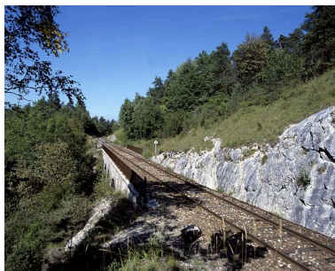
Vue d'ensemble, depuis le côté La Cluse (sud-est). IVR43_20050100044XA