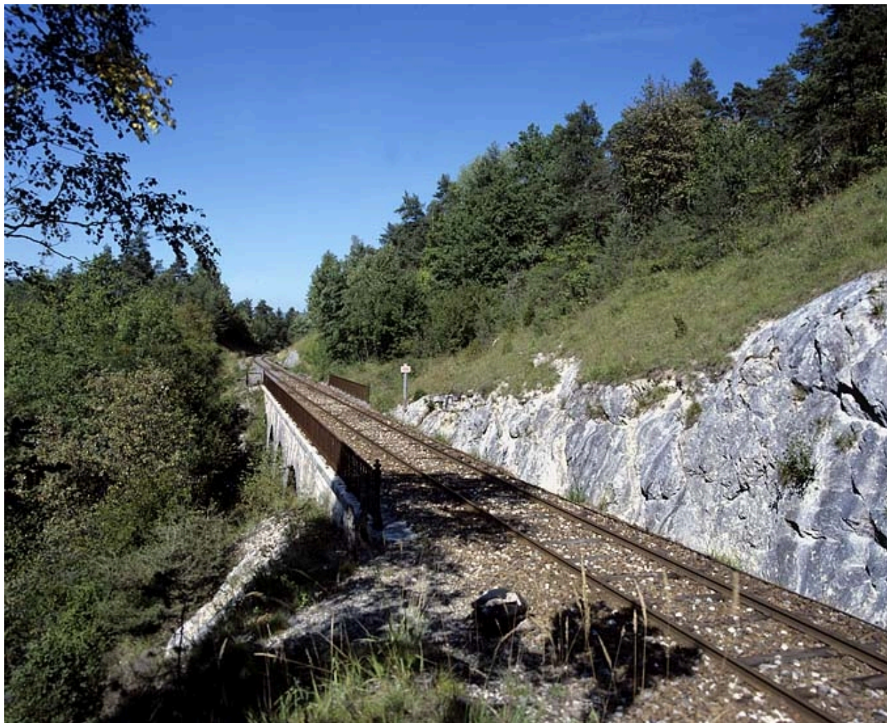
Vue d'ensemble, depuis le côté La Cluse (sud-est).