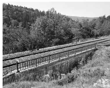
Elévation côté montagne.