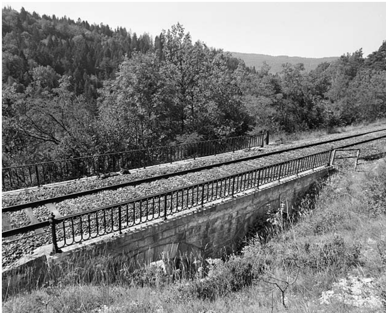
Elévation côté montagne.